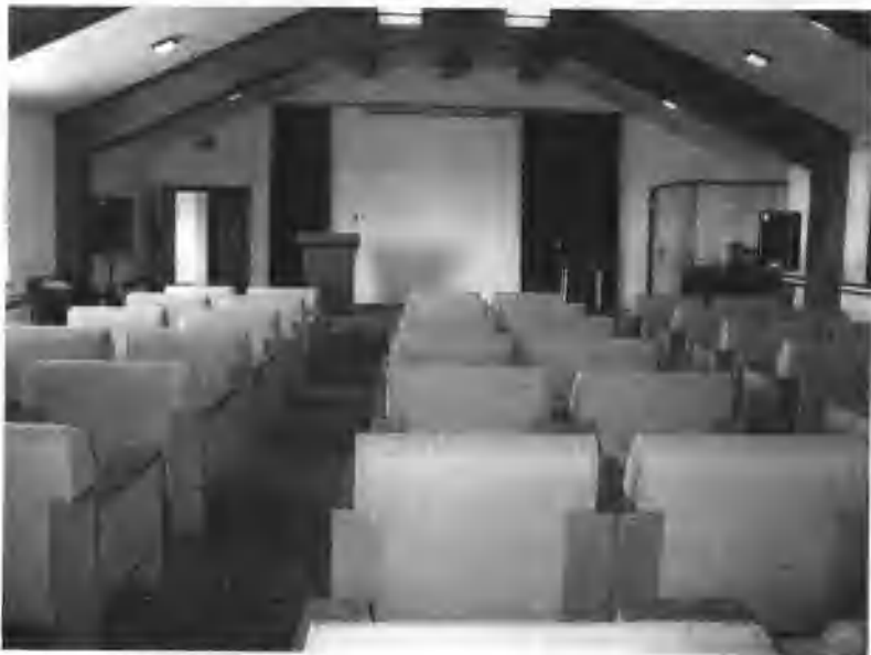
万松浦书院的多功能演讲厅。

这个独立性，坚持起来困难。前一段时间，凤凰卫视让我去它那个“世纪大讲坛”上做一个讲座。我对他们说，如果你们请我去，我就想讲我希望讲的；如果你们要我讲你们希望听的，那我就不去。他们说，我们凤凰卫视正好能够给学者和请来的嘉宾一点空间，我们就想听听思想性的东西，而不是只讲知识。我们前头办了许多期了，老是知识性的东西讲得太多了。观众对这个问题也有一个反应：知识性的东西我们通过其他的渠道也可以得到，为什么非要通过凤凰台呢？他们也想把这些观众给吸引住。他们所谓的思想性我也能明白，就是有针对性的思想，而不是死了的思想。死了的思想其实就是知识，有针对性活着的知识那才是思想。我去给他们讲了一下，后来他们把文字稿给我发了过来，我一看，还是洗得非