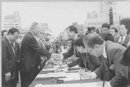
主辦年度迎春揮毫活動

張 炳煌先生，民國三十八年生，世界新聞學院畢業，現為中華民國書學會會長。由於長年從事書法研究與創作，尤其近二十年來，在電視上書寫「每日一字」標準國字示範，使他享有極高的知名度。但他並不以此為滿足，反而提供個人所累積的學習經驗和成果，完全奉獻給傳統文化的社會教育工作。