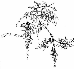
菜 花 藤