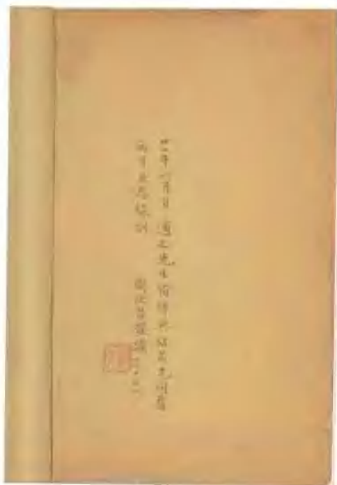
《石头记》甲戌本第一册末周汝昌題記