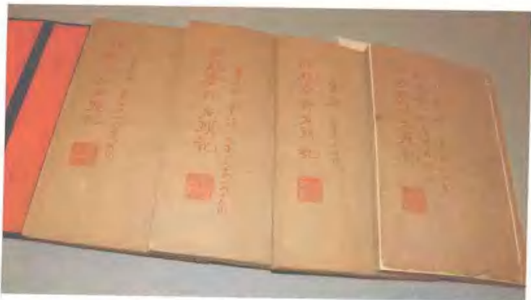
胡适先生收藏《石头记》甲戌本 2005年初归藏上海博物馆