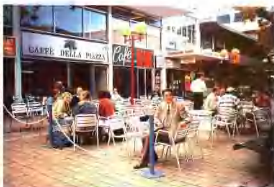
澳洲人喜爱露天咖啡座