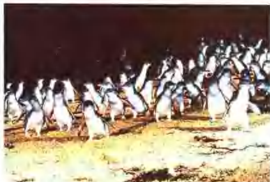
维多利亚州的菲利浦岛看企鹅归巢