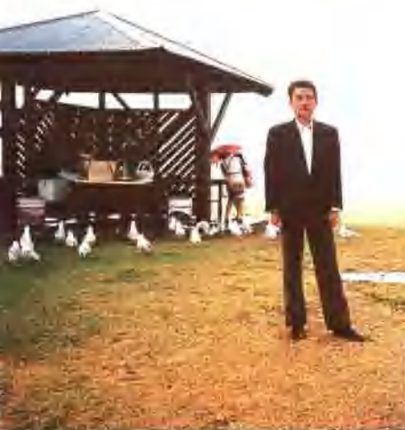
1. 澳洲海滨的免费烧烤亭