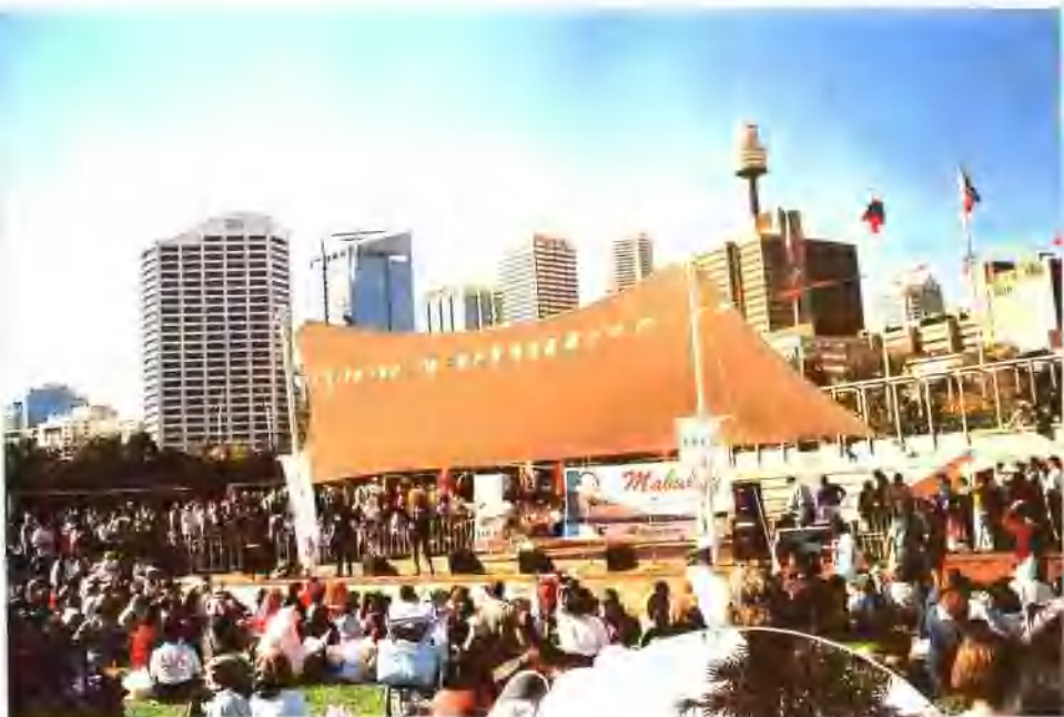
悉尼情人港嘉年华上的艺术表演