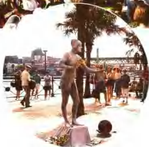
悉尼环形码头艺人装扮的雕塑秀