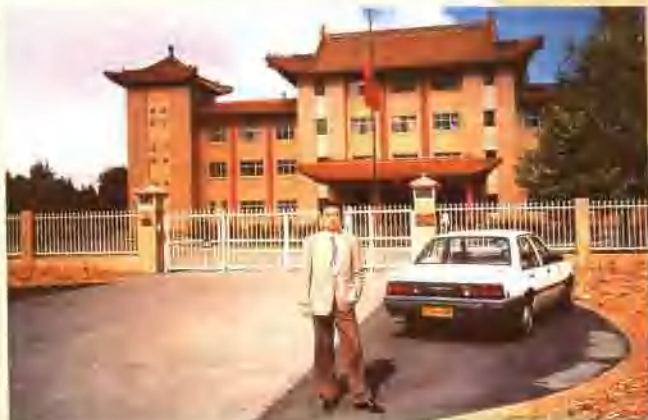
堪培拉中国大使馆前