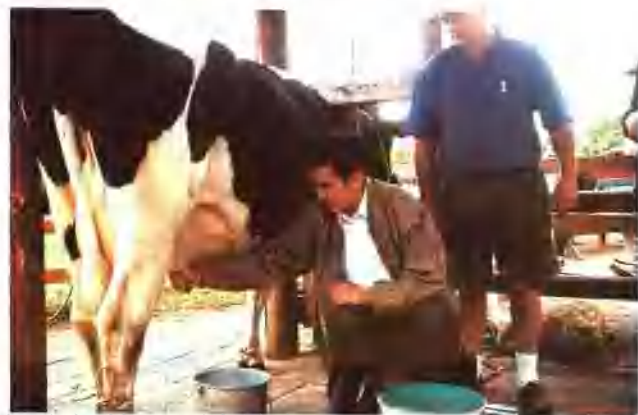
布里斯班农场参观时学习人工挤奶