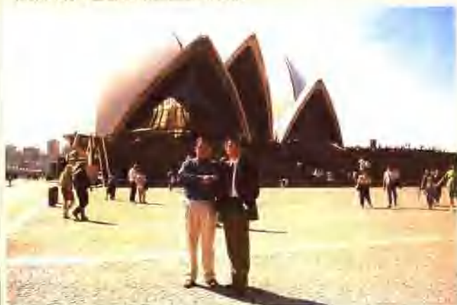
父子俩合影于悉尼歌剧院前