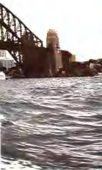
横跨悉尼港的大铁桥