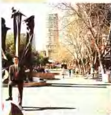
悉尼街头处处有雕塑