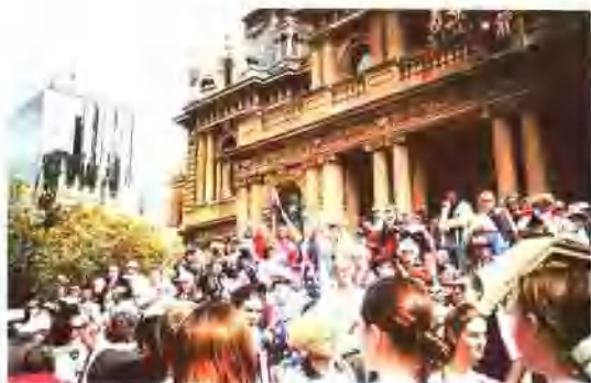
在悉尼市政厅前观看游行的澳洲人