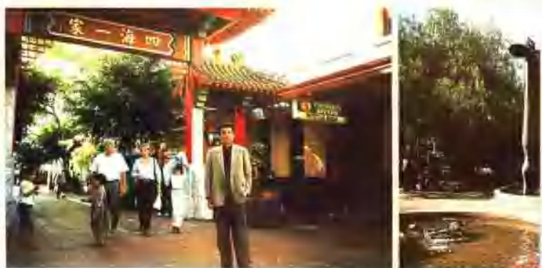
在悉尼“中国城”入口处