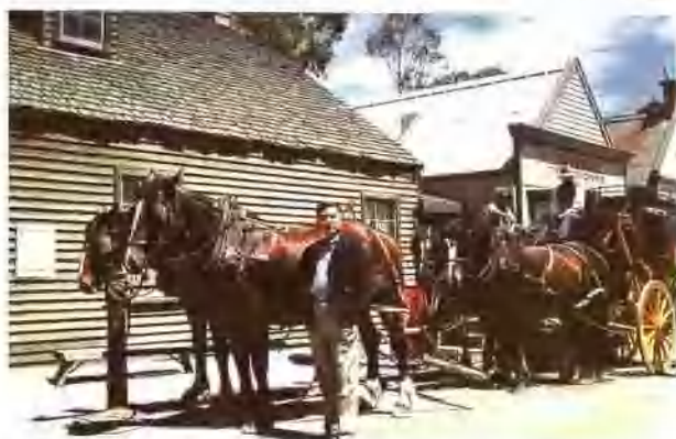
墨尔本金矿索弗仑古镇上的马车