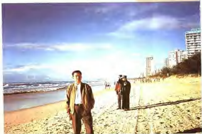
黄金海岸沙滩全长42公里