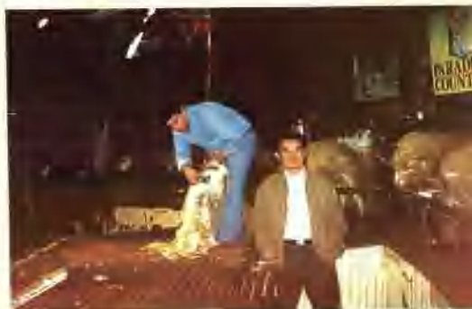
在Woolshed的澳洲羊毛栈观看剪羊毛表演