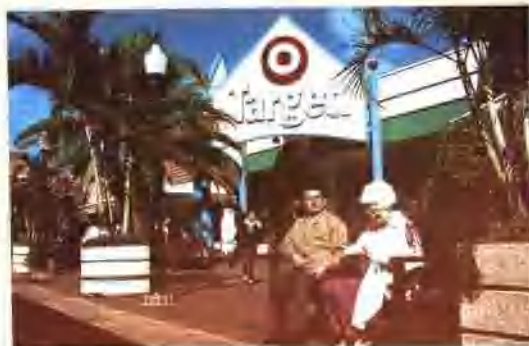
黄金海岸电影城与澳洲老太在一起