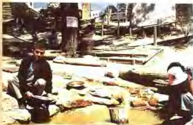
在索弗仑金矿区小溪中洗淘金沙