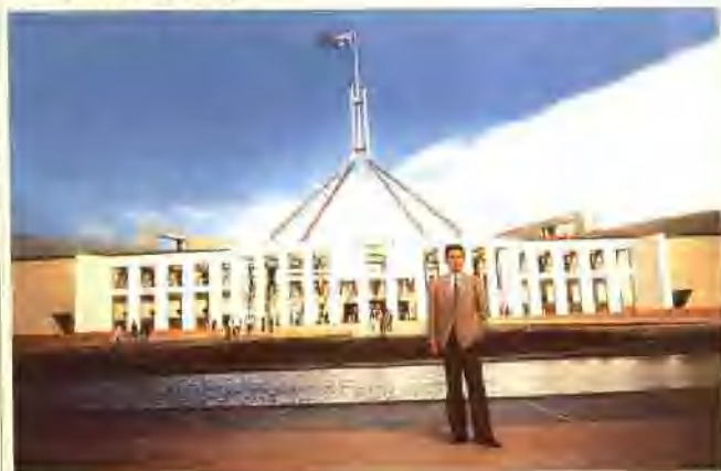
在澳大利亚首都堪培拉国会大厦前