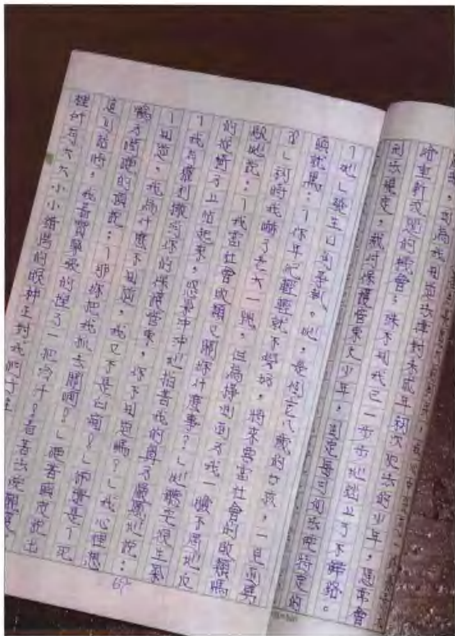
游嘉宏的字，工整得像刻的一般。