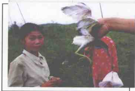
羽翼未丰的小白鹭也难逃厄运。