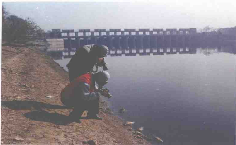
▲ 水变黑了，鱼儿死了，曾经造就了悠久文明、养育了芸芸众生的江河愤怒了，就连人想接近河边都要带上防毒面具。