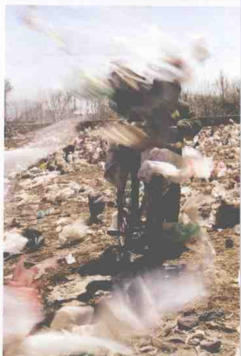
▲ 一阵突如其来的“白色风暴”，使得路人措手不及。