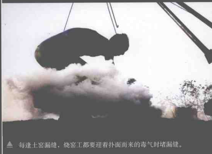
▲ 每逢土窑漏缝，烧窑工都要迎着扑面而来的毒气封堵漏缝。