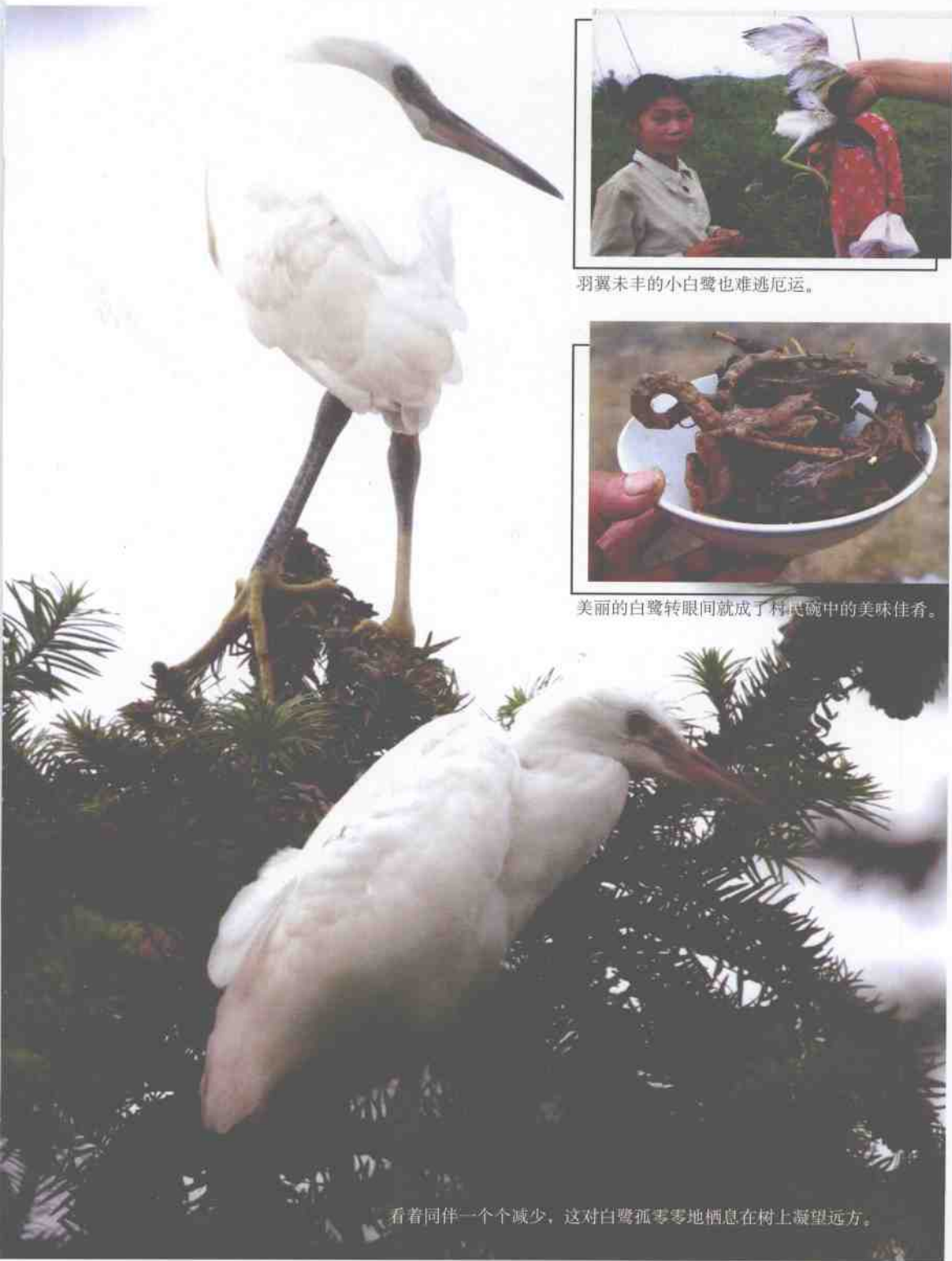
看着同伴一个个减少，这对白鹭孤零零地栖息在树上凝望远方。