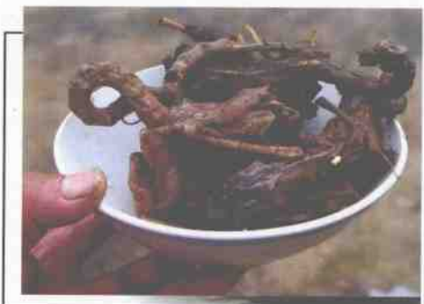
美丽的白鹭转眼间就成了村民碗中的美味佳肴。