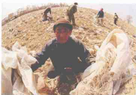
▲ 望着满目的白色垃圾，老农欲哭无泪。