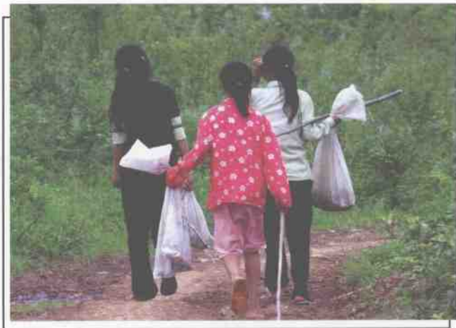
▲ 连小女孩也加入了捕杀者的行列。