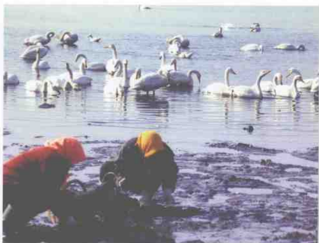
▲ 野生天鹅与当地人和谐相处。