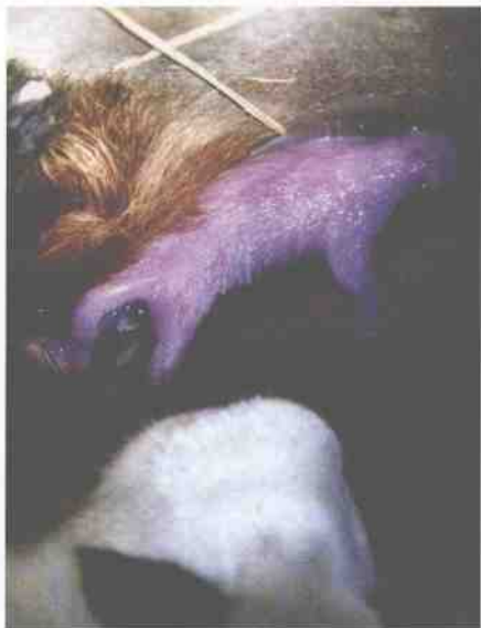
▲ 中国陕西首只人工繁殖大熊猫降生瞬间。