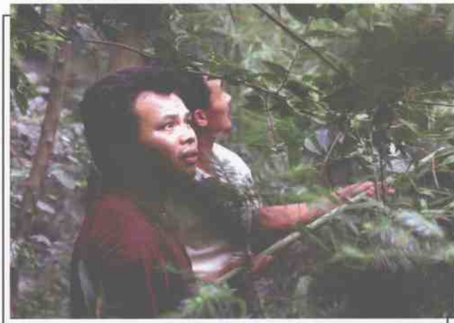
▲ 盗猎者贪婪的目光。