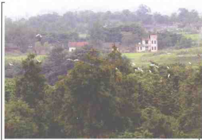
▲ 绿树成荫的额包山。