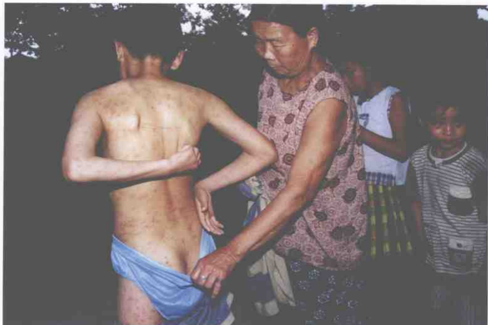
▲ 遭受严重污染的江河正在惩罚人类，这位在江河边长大的小男孩浑身长满了疙瘩。