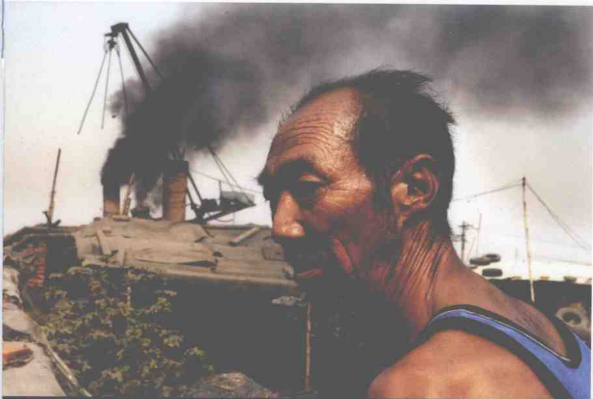
▲ 五旬老汉要用烧窑的收入来养活家人，至于污染，他没考虑那么多。