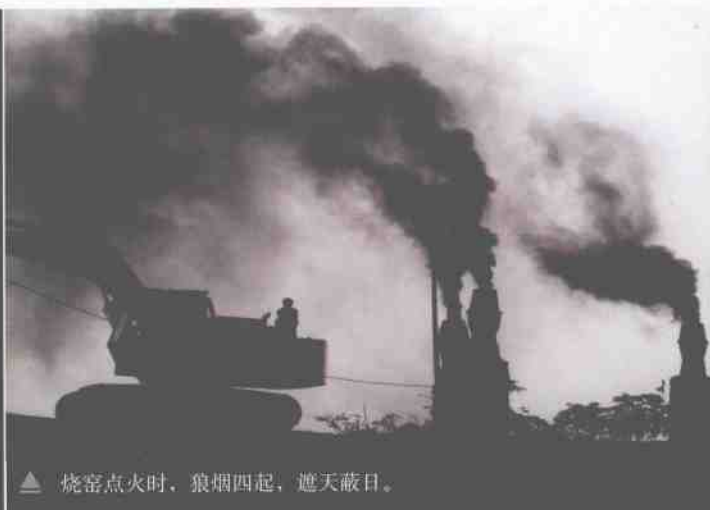
▲ 烧窑点火时，狼烟四起，遮天蔽日。