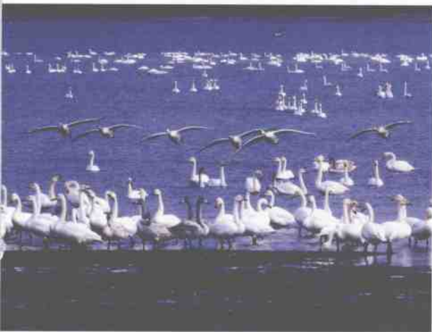
▲ “东方天鹅湖”丰盛的海草每年都吸引近万只野生天鹅来此越冬。

山东省荣成市加大了生态环境保护的力度，成立了野生动物保护协会，天鹅湖上一派人与自然和谐相处的融洽景象。