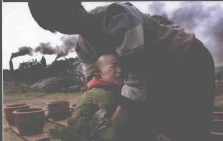
▲ 整日灰头土脸将成为孩子们童年的记忆。