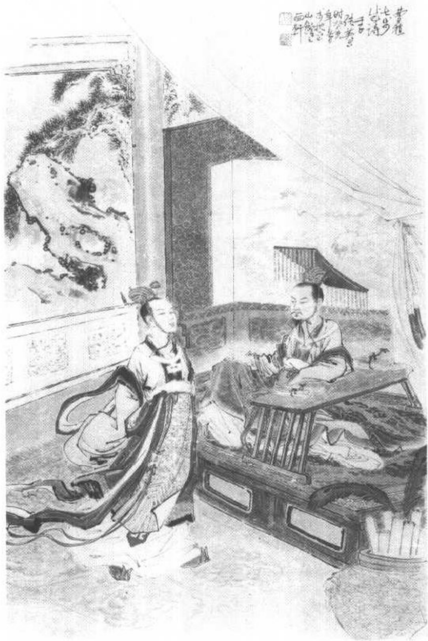
《文帝尝令东阿王七步中作诗》插图