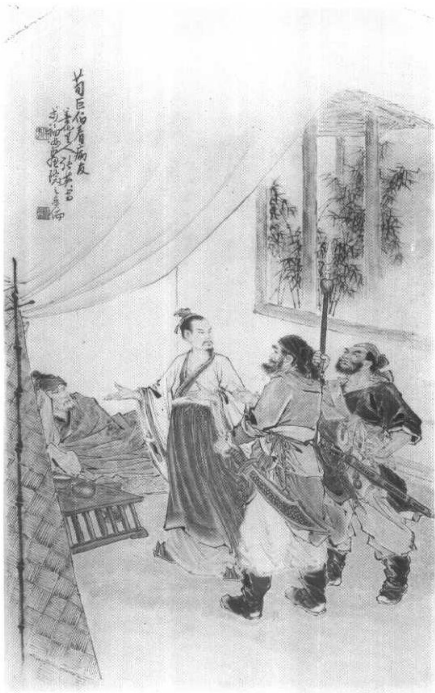
《荀巨伯远看友人疾》插图