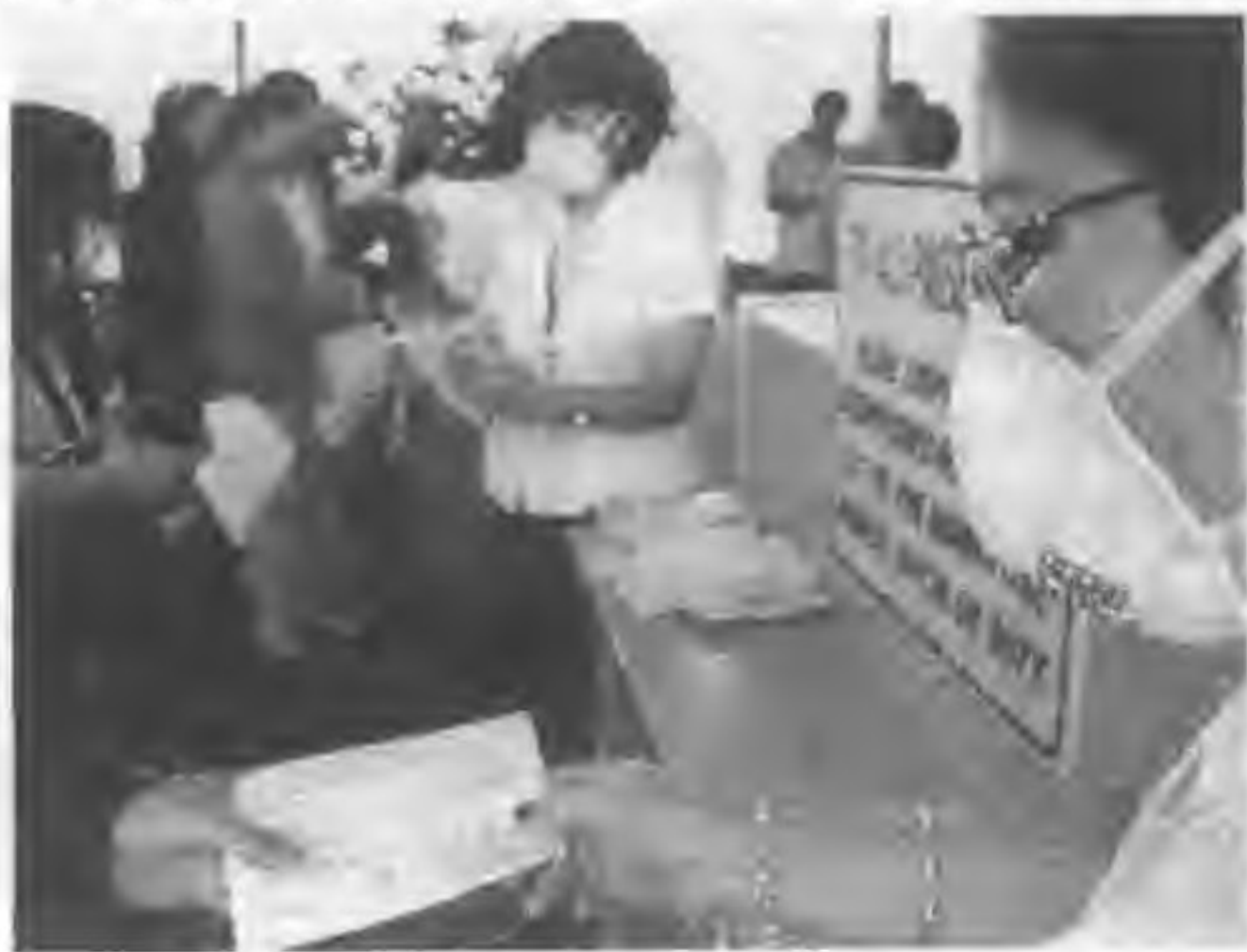
菲律宾海关在各港口和机场加强健康检查

每年 4 月中旬，菲律宾人都要享受长达一周的复活节假期，不少人选择出国度假，富有家庭的子女通常也利用三四月月份的暑假到国外游历，正是旅行社和航空公司财源滚滚的时候，但今年的复活节，全球对 SARS 病毒的关注已经超过对英美“倒萨”的关注度，许多菲律宾人也纷纷取消境外旅行计划。