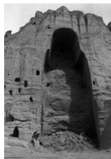
图 2 2001 年阿富汗内战中石雕巴米扬大佛被信奉伊斯兰教的塔利班政权炸毁