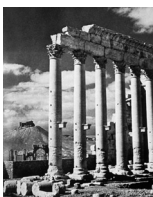
图 1 受希腊文化影响的西亚建筑遗址