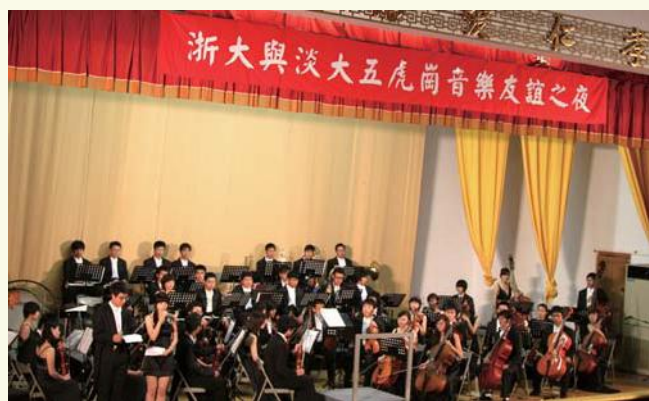
▶ 6月9-16日 浙大文琴交响乐团随浙江省代表团在台湾参加主题为“浙台经贸文化之旅”的系列活动，在台湾大学、淡江大学、逢甲大学、义守大学、台湾科技大学等5所高校巡演。