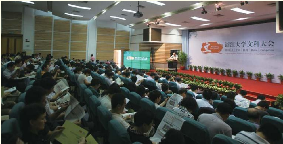
▲ 7月12日，浙江大学2010年文科大会在紫金港校区召开。