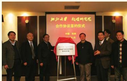
▲ 1月19日，浙江大学与敦煌研究院在紫金港校区图书信息中心签署合作协议，敦煌石窟壁画数字资源库和文化遗产数字保护技术联合实验室同时揭牌。