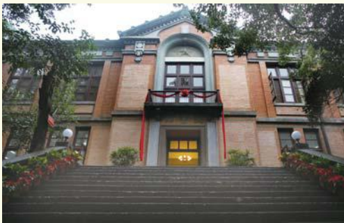
▲ 11月30日，有着百余年历史的之江校区主楼、图书馆、1号楼、5号楼和6号楼经修缮重新开放（图为图书馆）。