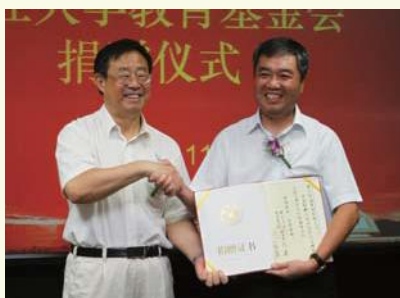
▶ 7月7日，浙江恒逸集团有限公司再次向浙江大学教育基金会捐赠1000万元人民币，用以扩大“浙江大学恒逸基金”。