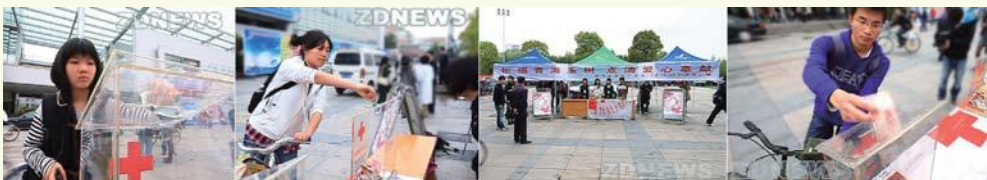
▲ 4月19-21日，浙江大学红十字会发起向青海玉树地区捐款祈福活动（图为学生们在紫金港、玉泉、西溪、华家池校区的捐款点捐款）。