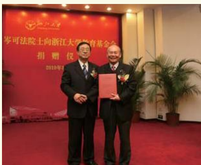
▲ 1月15日，正值75岁寿辰的中国工程院院士、能源工程学系教授岑可法出资350万人民币设立“浙江大学岑可法教育基金”。