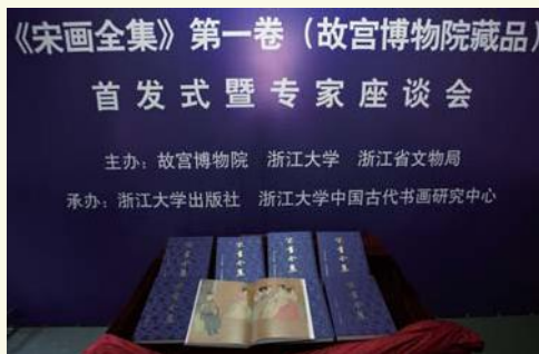
▲ 12月28日，浙江大学出版社编辑出版的《宋画全集》第一卷故宫卷在北京故宫举行首发式。