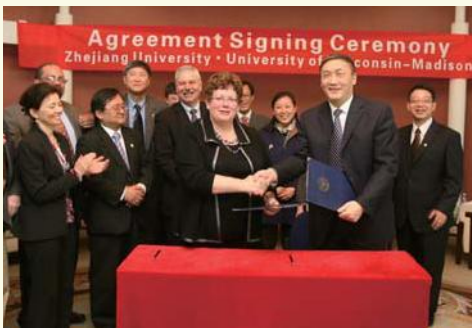
▲ 3月31日, 美国威斯康辛大学麦迪逊分校校长碧蒂·马丁一行访问浙江大学, 并签署校际友好合作备忘录。