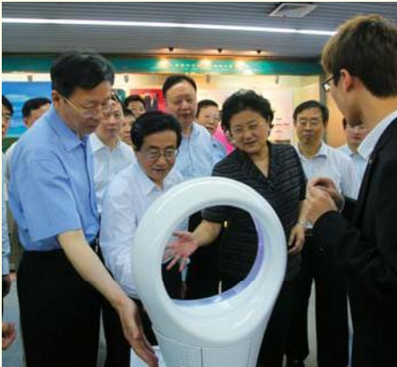
▲ 7月16日，中共中央政治局委员、国务委员刘延东（右三）来校考察。