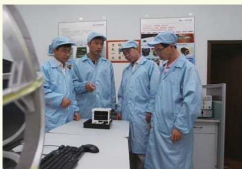
▲ 9月22日，10时42分，浙江大学研制的两颗“皮星一号A”卫星在中国酒泉卫星发射中心搭载“长征二号丁”运载火箭进入太空。图为研究人员和“皮星一号A”卫星。