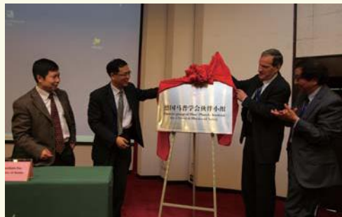
▲ 5月19日，德国马普学会伙伴小组正式落户浙江大学。