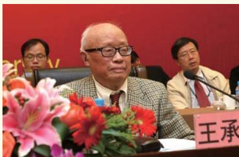
▲ 10月9日，在教育学院教授王承绪先生百岁华诞庆祝会上，中国高等教育学会向他颁发了“高等教育科学研究特殊贡献奖”荣誉称号。