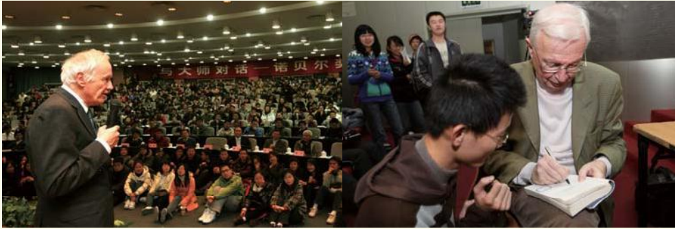
▲ 美国2003年诺贝尔物理学奖获得者安东尼·莱格特 (Anthony J. Leggett) 教授 (左) 和“超分子化学之父”的法国著名化学家、1987年诺贝尔化学奖获得者简·马里·莱恩 (Jean Marie Lehn) 教授 (右) 分别2月27日、11月2日在紫金港校区作学术演讲。