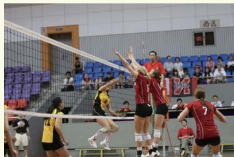
▲ 5月24日，浙大女排与美国内布拉斯加州大学女排在浙大举行友谊比赛。