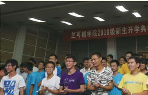
▲ 8月18日，浙江大学首届求是科学班举行正式开班典礼。