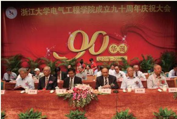
◀ 5月22日，电气工程学院成立九十周年庆典大会在玉泉校区举行。