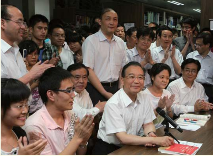
◀ 6月25日，中共中央政治局常委、国务院总理温家宝在中共浙江省委书记赵洪祝，省委副书记、省长吕祖善和校长杨卫等的陪同下，来到紫金港校区图书馆看望正在自修的大学生们。