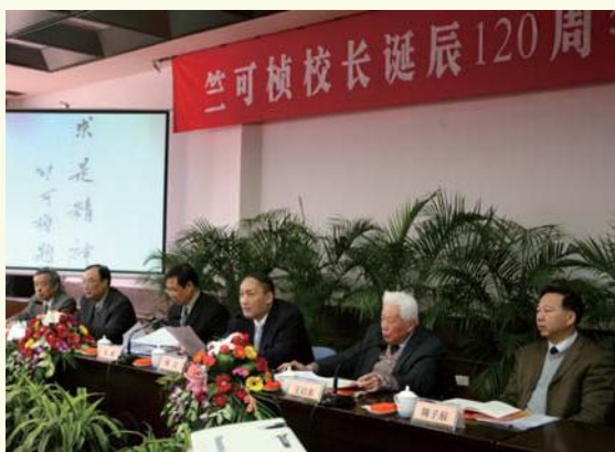
▲ 3月19日，竺可桢校长诞辰120周年纪念会在玉泉校区邵科馆召开。