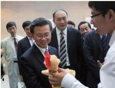
▲ 6月21日, 新加坡副总理兼内政部部长黄根成一行访问浙江大学。