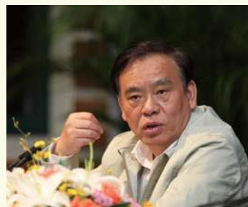
▲ 5月13日，中共浙江省委副书记、省长吕祖善在浙江大学党委中心组理论学习（扩大）会上讲话。