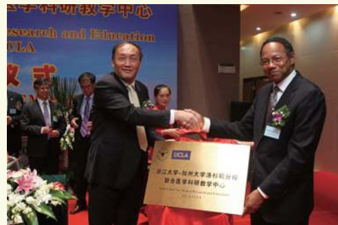
▲ 10月22日, 校长杨卫和美国加州大学洛杉矶分校 (UCLA) 副校长兼医学院院长Gene Washington共同为“浙江大学—加州大学洛杉矶分校联合医学科教研中心”揭牌。