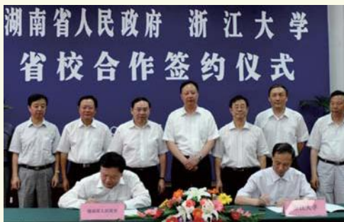
▲ 6月19日，浙江大学与湖南省人民政府在浙大玉泉校区邵科馆签署全面合作协议。