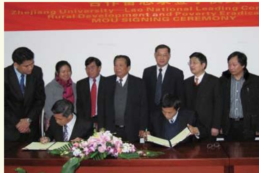
▲ 1月31日-2月5日, 以老挝内阁部长、国家农村发展与反贫困委员会主席昂纳·彭马占为团长的老挝国家农村发展与反贫困委员会代表团访问浙江大学并签署了合作备忘录。