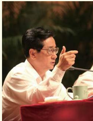
◀ 9月10日，中共浙江省委书记赵洪祝在为师生们作形势报告并进行调研。