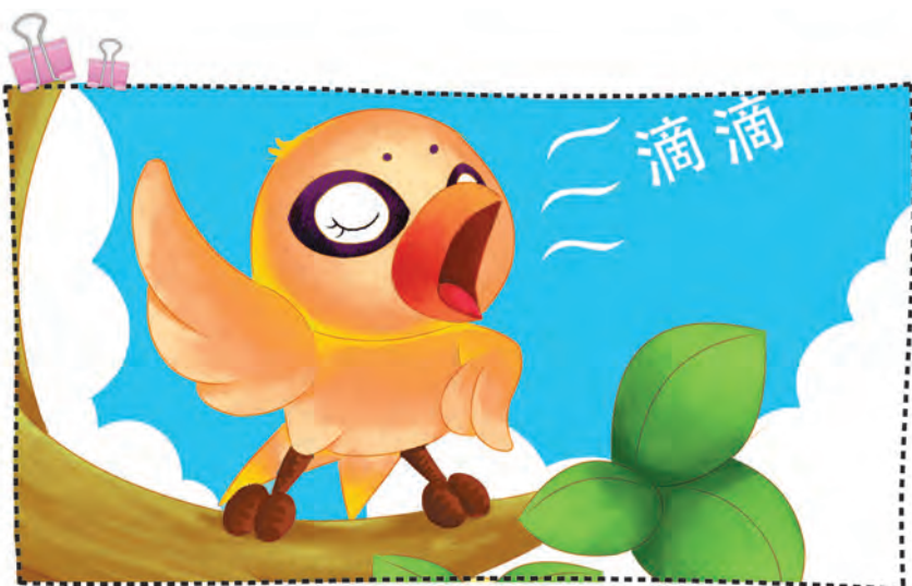
xiǎo huáng lí de gē shēng zhēn qīng cuì 小 黄 鹂 的 歌 声 真 清 脆 ！