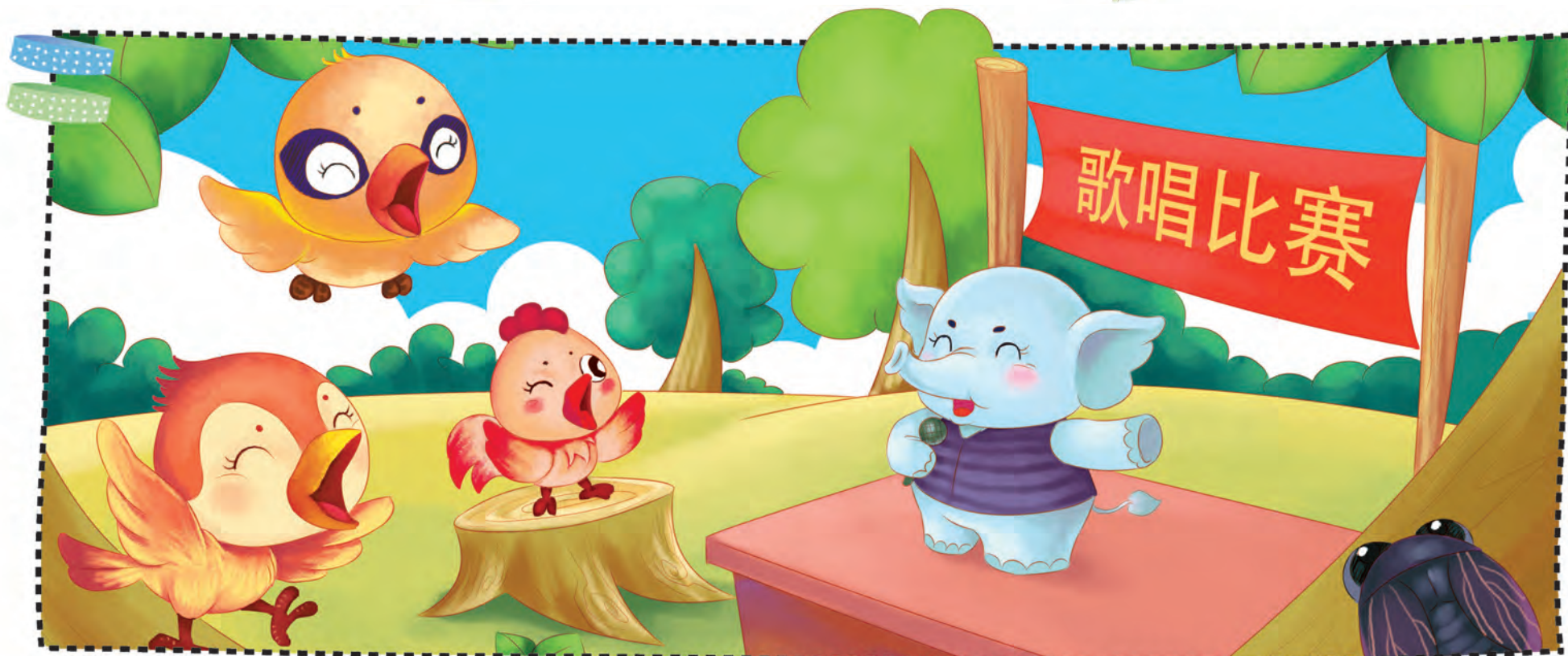
sēn lín lǐ jǔ xíng gē chàng bǐ sài la 森 林 里 举 行 歌 唱 比 赛 啦 ！