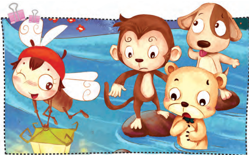
xiǎodēnglong dài zhe dà jiā zǒu guò xiǎo hé 小灯笼带着大家走过小河。