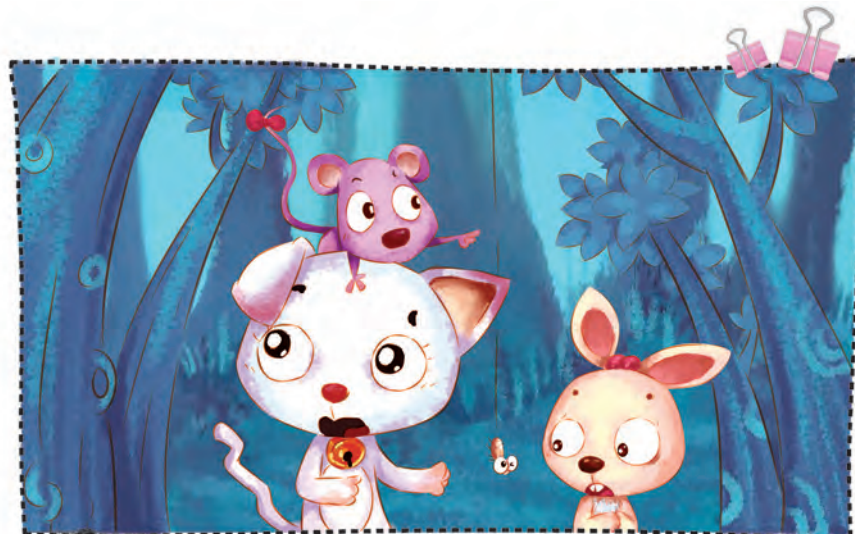
chuān guò yī piàn zǎo shù lín 穿过一片枣树林。