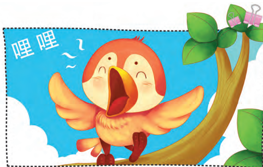
huáng yīng de gē shēng zhēn dòng tīng 黄 莺 的 歌 声 真 动 听 ！