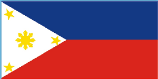
fēi lù bīn 菲 律 宾 Philippines