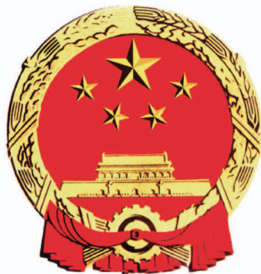
中华人民共和国国徽

中华人民共和国国徽,中间是五星照耀下的天安门,周围是谷穗和齿轮,象征中国人民自“五四”运动以来的新民主主义革命斗争和工人阶级领导的以工农联盟为基础的人民民主专政的新中国的诞生。