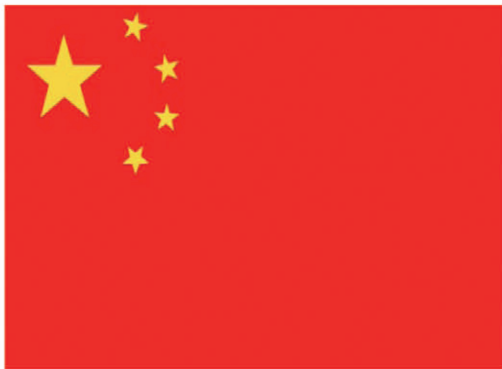
中华人民共和国国旗

中华人民共和国国旗是五星红旗。旗上的五颗五角星及其相互关系象征中国共产党领导下的革命人民大团结。五角星用黄色是为了在红地上显出光明,黄色较白色明亮美丽,四颗小五角星各有一尖正对着大星的中心点,这是表示围绕着一个中心而团结,在形式上也显得紧凑美观。