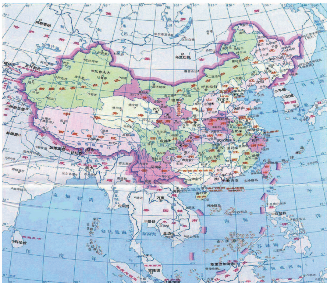
中华人民共和国地图：巨大的火炬

祖国像亚欧大陆东部、太平洋西岸的一把熊熊燃烧的火炬。960万平方千米的陆地国土，是这把火炬的腾腾火焰。约300多万平方千米的海洋国土，从渤海、黄海经台湾以东海域至南沙群岛曾母暗沙，再至海南至北部湾，是这支巨大火炬的托盘和手柄。