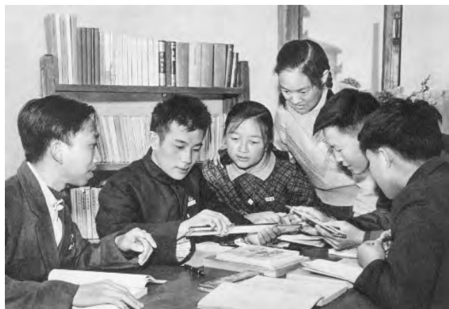
看谁计算尺拉得快（《清华大学画册》，1964）