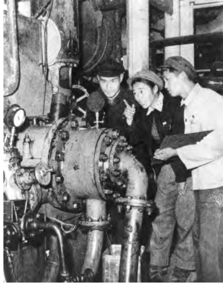
学生在试验电厂实习（《清华大学画册》，1911—1961）