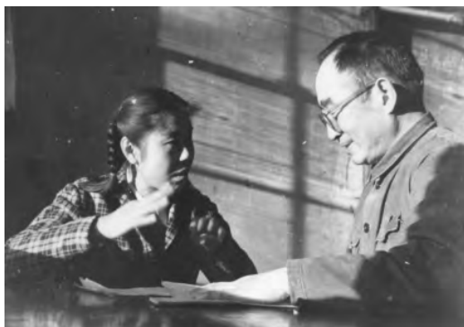
学生在接受刘绍唐教授（右1）的物理课口试