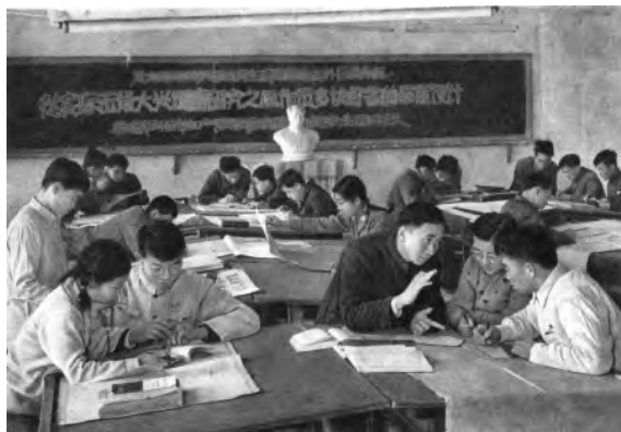
水利工程系师生结合毕业设计承担了国家委托的大中小型水利工程设计任务，这是学生在教师指导下进行京郊一水库的设计工作（《清华大学画册》，1911—1961）