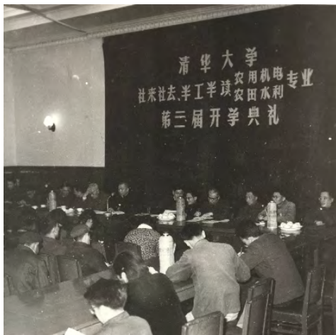
清华大学社来社去、半工半读农业机电与农田水利专业第三届开学典礼