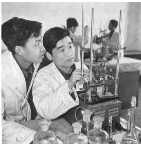
工程化学系学生在教师指导下进行物理化学分析实验（《清华大学画册》，1911—1961）