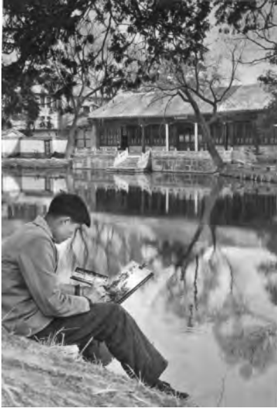
写生（《清华大学画册》，1911—1961）