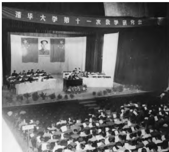
1958年6月，清华大学召开第十一次教学研究会