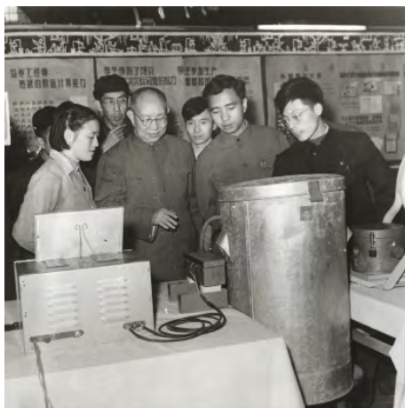
50年代末，北京市委书记刘仁（左2）到清华视察，在何东昌（右2）陪同下参观教育革命成果展览

1953年9月14日，《新清华》第10期刊登了教务长钱伟长在清华大学第5次教学工作研究会上所做的报告——“清华大学一九五二年度教学工作总结”