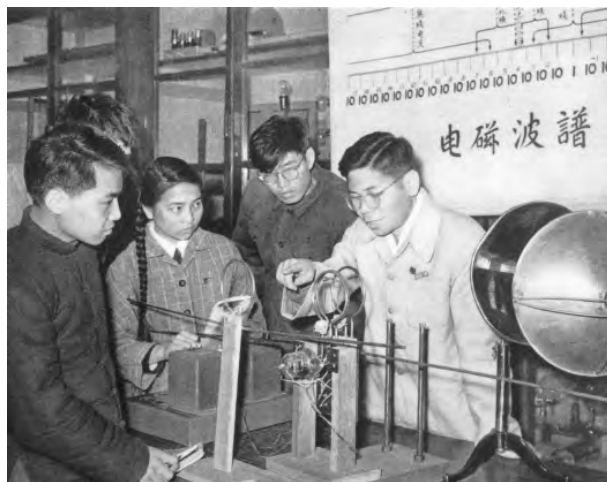
普通物理课堂表演（《清华大学画册》，1911—1961）