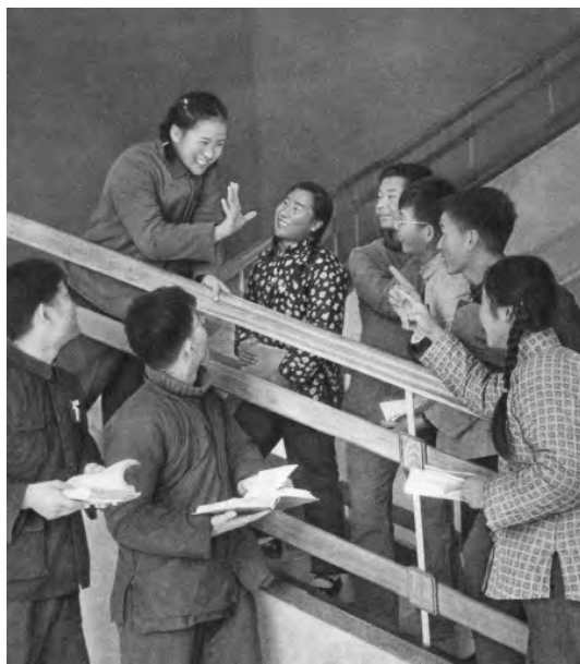
又一个5分（《清华大学画册》，1911—1961）