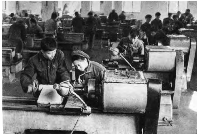
学生在综合机械厂生产实习（《清华大学画册》，1911—1961）