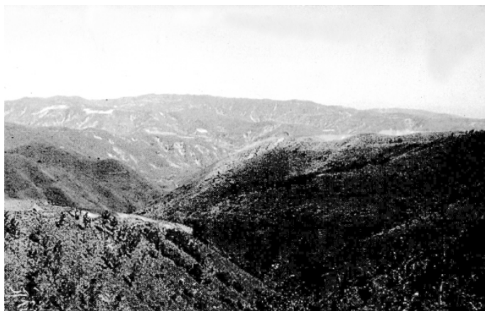
黄土残塬西南土石质山地景观