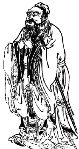
图一 (前 551~前 479 年)