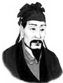
图二 董仲舒(前 179~前 104 年)

2005 年央视春节联欢晚会有一个别开生面的节目:对联集锦。山东上联:孔子仁,关公义,人文典范。山东人以孔子为骄傲,孔子也是中国的,更是世界的。因为孔子开创的儒家文化,作为中国传统文化的主流,它已经渗透到中国人思维意识的深层,所以要了解中国,要了解中国文化,不能不去了解儒家文化。