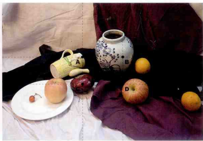
A、B、C、D为黄金分割点。亮部面积要大，暗部面积要小