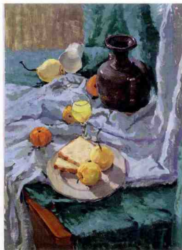
室内光(太阳的折射光)下光源色偏冷