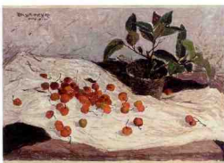
同类色小果子的处理要有色彩上的变化