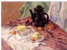
红色面积大且影响画面所有物体色调

中性色的调和:黑、白、灰三色为中性色。重色在表现画面纵深感时起到很关键的作用,面积不宜过大。亮色则起到突出画面视觉效果的作用,面积同样也不宜过大。灰色是画面最丰富的颜色,主要起过渡作用。