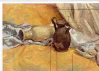
纯度低 明度低 纯度低 明度高