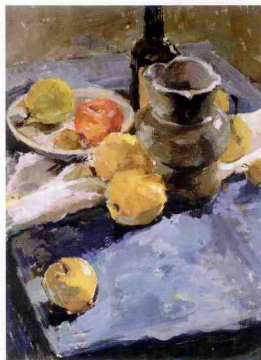
在太阳光直射下光源色呈暖色