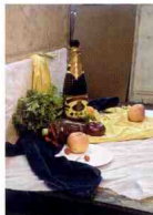
侧面平视，主体物高

作为高考如果是写生可能选取的角度不理想，构图怎么都觉得不合适的时候，一定要主动地挪动物体在画面的摆放位置，因为最终老师评卷还是看你的画面，不可能去想你当时具体遇到什么样的困难情况。默写的话一定要在平时积累一些比较好看的构图，这样就可以在考场上灵活运用了。