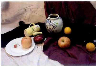
平面大立面小，注意重心点位置和透视角度，构图要饱满，大小适中