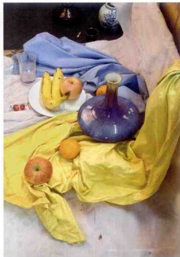
侧面俯视角大，平面宽阔，纵深感强