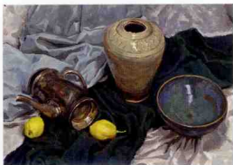
布纹处理要有体积虚实的变化,不同物体质感要有区别