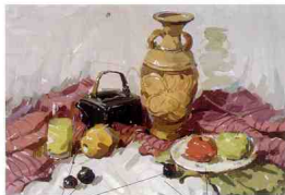
注意重色的面积大小及位置的摆放