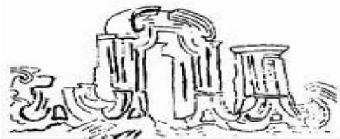
圆明园某建筑遗址