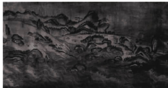
御制台湾府全舆图