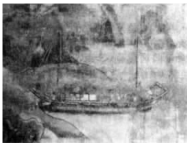
图1 第一批遣隋使到隋朝