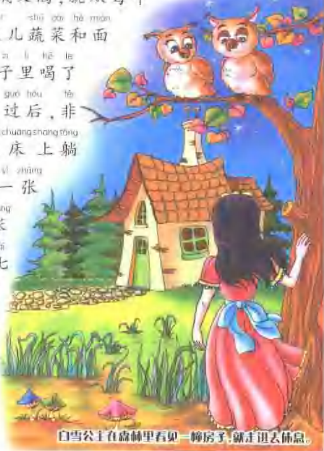
白雪公主在森林里看见一幢房子，就走进去休息。