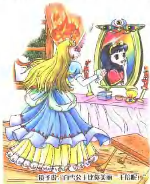
镜子说：“白雪公主比你美丽一千倍呢！”