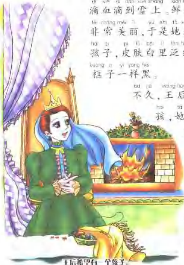
王后希望有一个孩子。

dōng tiān , mǎo bǎn de xuě huā xià ge bù tíng , yí wèi wáng hòu zuò zài chuāng zǐ biān fēng yī fu 。 yí bù xiǎo xīn , fēng zhēn bǎ shǒu zhǐ chā pò le , liú chū xiě lái , yǒu sān