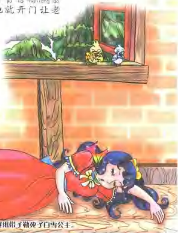
老婆婆用带子勒死了白雪公主。

pó pó jìn lái le bái xuě 婆婆进来了。白雪 gōng zhǔ tiāo le gēn piào liang 公主挑了根漂亮 de dài zi zhè shí lǎo pó 的带子，这时老婆 pó shuō hái zi nǐ zhēn 婆说：“孩子，你真 piào liang lái ràng wǒ gěi 漂亮!来，让我给 nǐ jì shàng xīn dài zi 你系上新带子。”