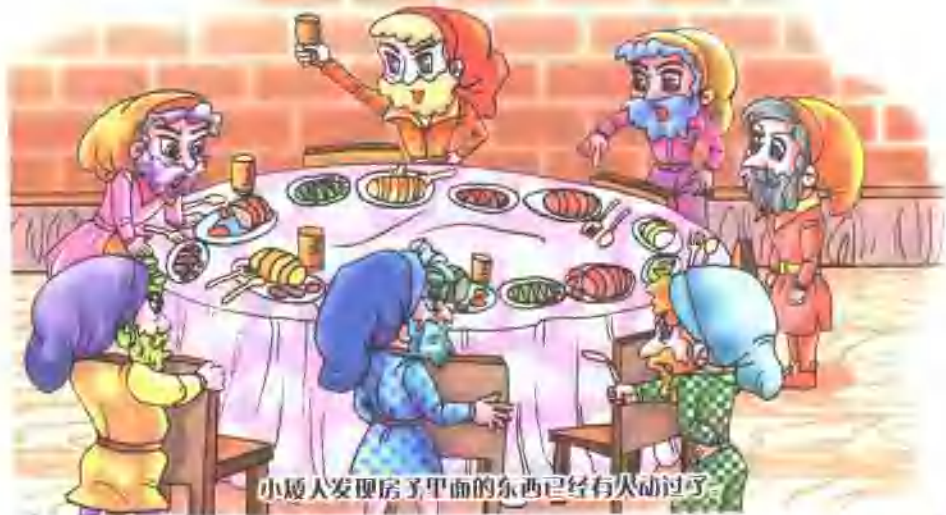
小矮人发现房子里面的东西已经有人动过了。

qí tā xiǎo duǒ rén dōu pǎo lái jiào dào wǒ de chuáng yě yǒu rén tāng guò 其他小矮人都跑来,叫道:“我的床也有人躺过。”