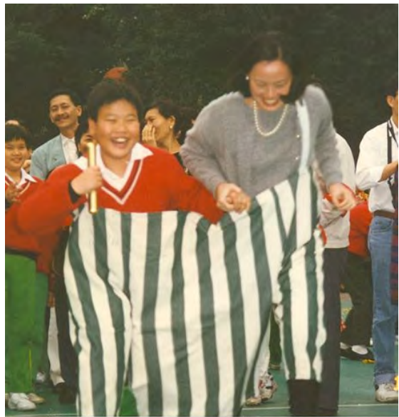
儿子四年级时的校庆活动中， 我们参加“两人三脚”接力比赛。