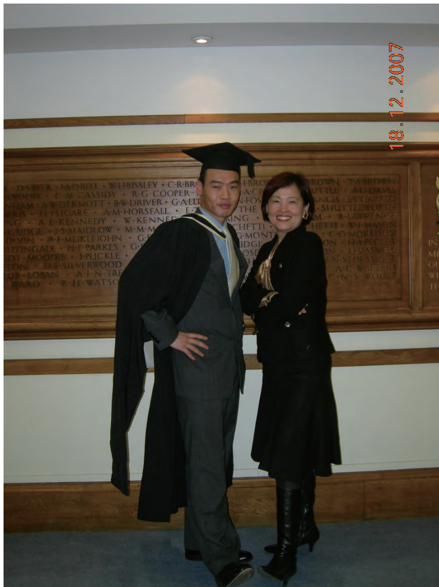
儿子研究生毕业典礼后， 母子于校训前故作潇洒状！