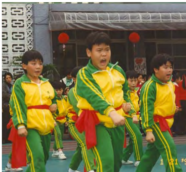
儿子小学五年级参加跆拳道校队。 一副很英勇的样子！