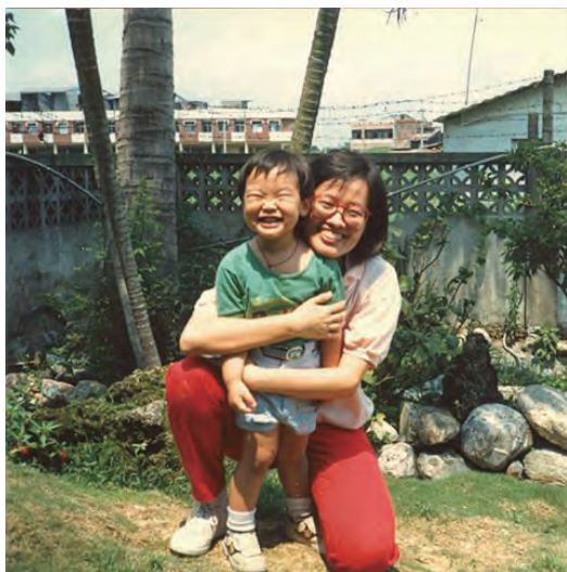
未满3岁的儿子已经知道面对镜头扮怪样。 这是我最喜欢的照片之一。