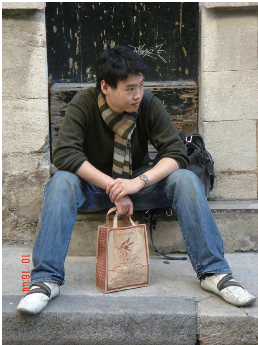
这年儿子刚大学毕业， 在法国普罗旺斯亚维侬小镇的不知名门前台阶上， 这是我用远镜头偷拍的照片。