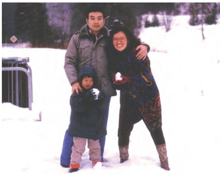
儿子3岁时，我们去欧洲旅行。 圣诞节在白雪皑皑的瑞士山区里打雪仗。