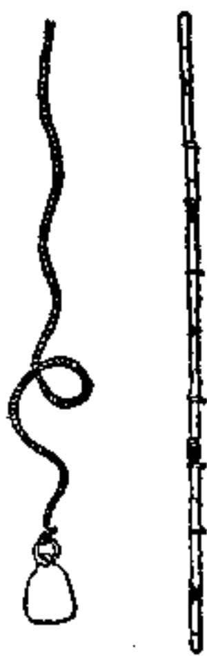
图6为“打水杆”及“試水墜”。

麟庆說明为：“打水杆有長至六、七丈者。东河兩鑲（即山东地方有用兩节相接的——作者），上半用杉木，取其輕浮易举；下半用榆木，取沉重落底。南河三鑲（即河南地方有用三节相接的——作者），中用杂木，兩头接束以竹，取攜便利，然遇大溜，探試少迟，即难得底，質輕故耳。又有試水墜、重十余斤，熔鉛为之，上系水綫，綜繩为之。盖鉛性善下，垂必及底，虽深百丈，只須放綫，亦可探得。定例有工处所派目兵專司打水，每日具报三次。若遇水勢陡長，埽前溜急淘深，更須隨時測量，以備搶护。再杆底鑲鉄，則下触碎石，錚錚有声，亦驗