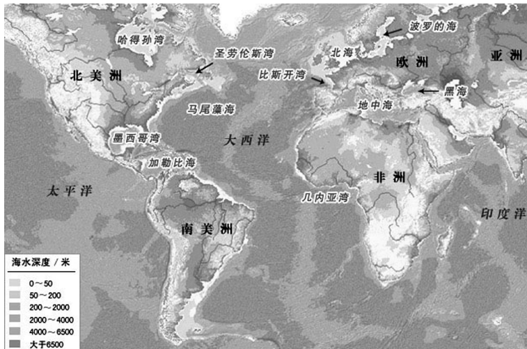
大西洋位置示意图

西狭窄、南北绵长，南北全长约 1.6 万千米，赤道区域最窄距离约 2400 多千米。两大洋连同附属海和南大洋部分水域约 9165 万平方千米，平均深度 3597 米，最深处 9218 米。北部岸线曲折，沿岸岛屿众多，海湾、内海、边缘海众多。