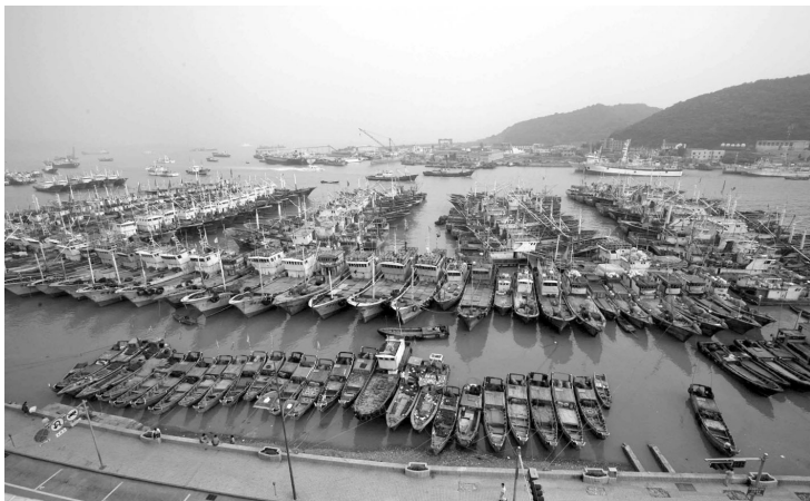
舟山渔港船只云集图

伦纽斯首先把它划成独立的海洋，称大北洋；1845年，伦敦地理学会命名为北冰洋。改为北冰洋一则是因为它在四大洋中位置最北，再则是因为该地区气候严寒，洋面上常年覆有冰层，所以人们称它为北冰洋。