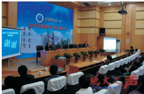
地学文化名家论坛现场

2010年1月26日,温总理在与科教文卫界代表座谈会讲话时说:“一所好的大学,在于有自己独特的灵魂,这就是独立的思考、自由的表达。千人一面、千篇一律,不可能出世界一流大学,大学必须有办学自主权。”2011年4月14日,在国务院参事和中央文史研究馆馆员座谈会上,温总理又言:“陈寅恪先生的‘独立之精神、自由之思想’,这是我一生都崇尚的格言。”殷鸿福院士也非常认同这些观点,他说:“大学教育的目的是培养人;科研的目的是追求真理,两者都不应以名、利为目的。两者都应以自由的意志和独立的精神为前提。自由意志和独立精神是大学精神的本质。”