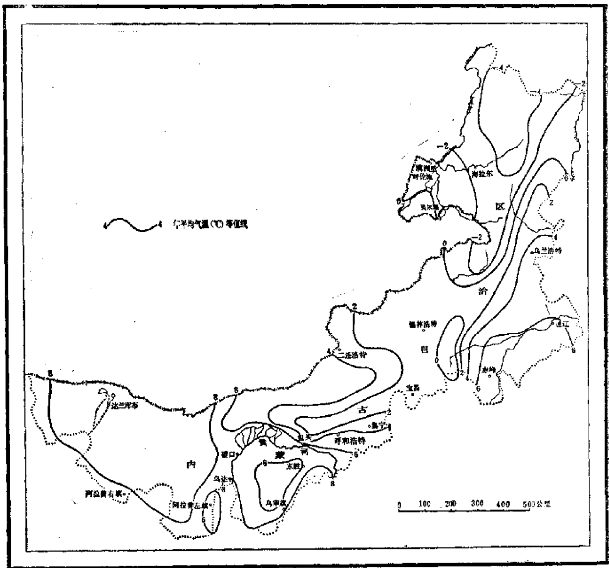
图1 年平均气温分布图

本考察区处在北半球中纬度的内陆地区，因此，具有明显的温带大陆性气候的特点。漫长的冬季，全区均受到蒙古高压的控制，从大陆中心向沿海移动的寒潮极为盛行。夏季则受到东南海洋湿热气团的一定影响。由于本区外围有长白山脉、燕山、太行山、吕梁山等山系在东南面的包围，又有区内的大兴安岭和阴山山脉的阻隔，使海洋季风的势力由东南向西北渐趋削弱，所以蒙古高原地区，东南季风的作用是不强的。它所影响的范围一般只能波及内蒙古高原的东、南部，不能深入到高原的中心，狼山与贺兰山以西的地区，仍