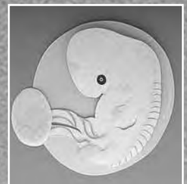
怀孕23天后的胎儿的形状