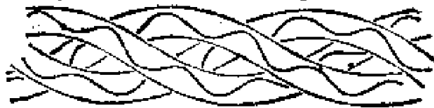
图 2.1 骨胶原分子的结构模型三条链扭合在一起，形成右螺旋结构

为在骨胶原的分子中，含有相当多的甘氨酸-羟基脯氨酸-其它某一种氨基酸一起组成的重复结构单元。骨胶原是由三条多肽链扭合在一起，形成三重螺旋结构(图 2.1)。这种结构一