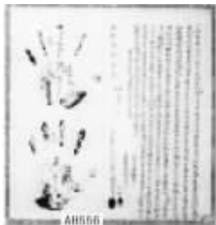
图 1-1 印有手纹指纹的契约,成品于 1797 年 (藏品号:AH556)

该有一个漫长的认识时期。若把西汉初(公元前 206 年)萧何为汉高祖刘邦制定汉律,规定“供词上捺印指纹为证”作为起点的话,我国把指纹应用于刑事诉讼的历史也应有 2 000 多年了。