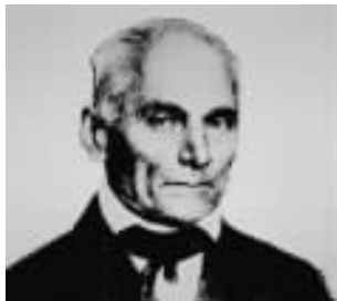
图1-2 帕金杰 近代肤纹学第一个里程碑的代表人物 (John Evangelist Purkinje, 1787~1869)

1823年,普鲁士伯莱斯劳大学教授捷克生理学家John Evangelist Purkinje(1787~1869)(见图1-2)在《视觉器官和皮肤组织生理学检查注解》一文中不仅描述了指纹,并根据观察的不同纹理形式对肤纹花样进行了系统的分类。他最先将指纹分为9类,分别命名为:拱、帐拱、左环、右环、左袋、右袋、左螺、右螺、重环。