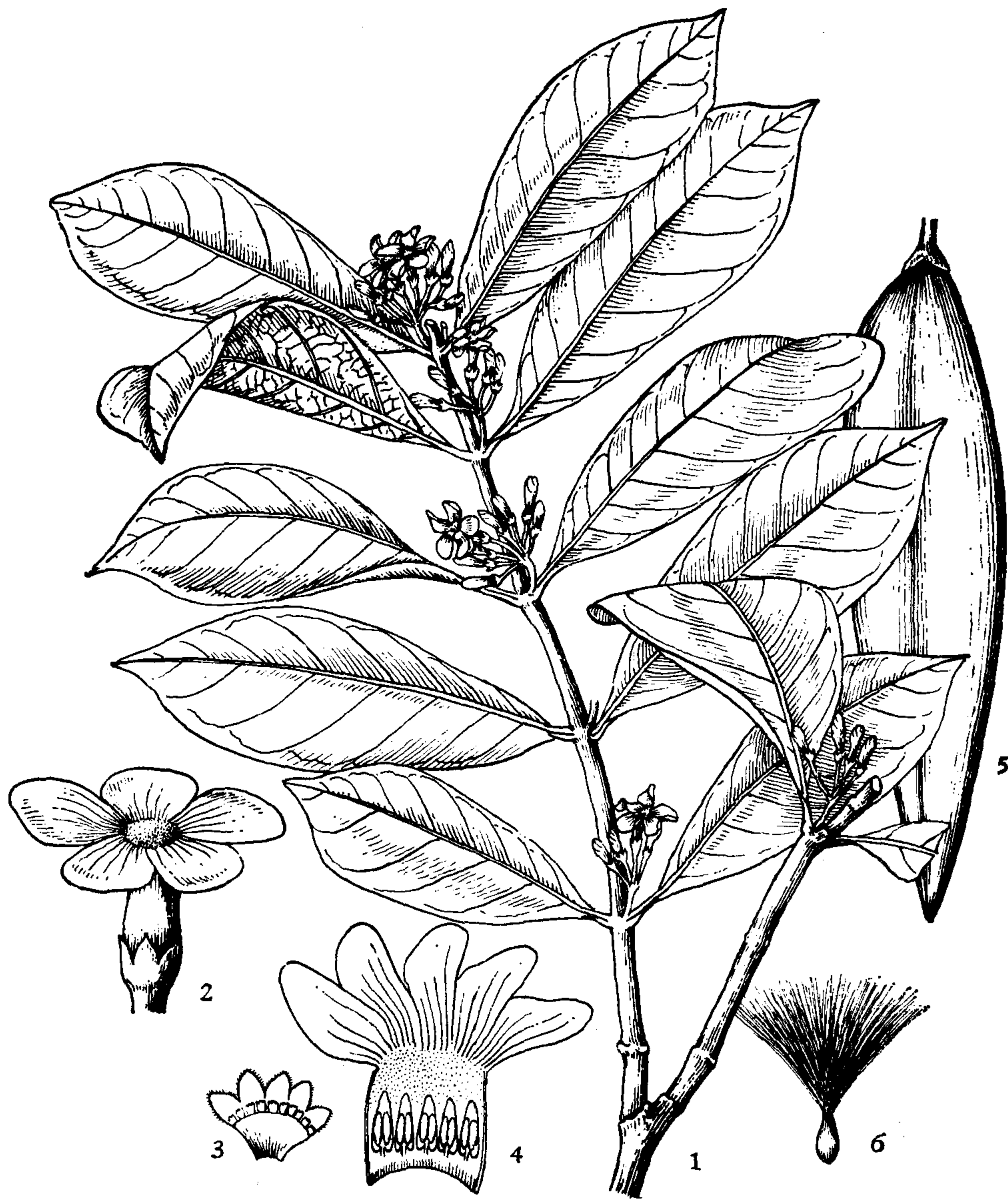
图2 紫花络石 Trachelospermum axillare Hook. f: 1.花枝, 2.花, 3.花萼展开, 示腺体, 4.花冠展开, 示雄蕊着生, 5.蓇葖果, 6.种子。(陈国泽绘)

柄长5毫米。花序顶生或近顶生;花蕾顶端渐尖;萼片卵状披针形,紧贴花冠筒上;花冠白色,花冠筒喉部膨大,内面无毛,花冠裂片与花冠筒近等长,长约6毫米;雄蕊着生于花冠筒喉部,花药顶端露出花喉之外;花盘5裂;子房无毛。蓇葖果线状披针形,长10—28厘米,直径3—4毫米,无毛;种子顶端种毛长达3.5厘米。花期4—6月;果期8—10月。