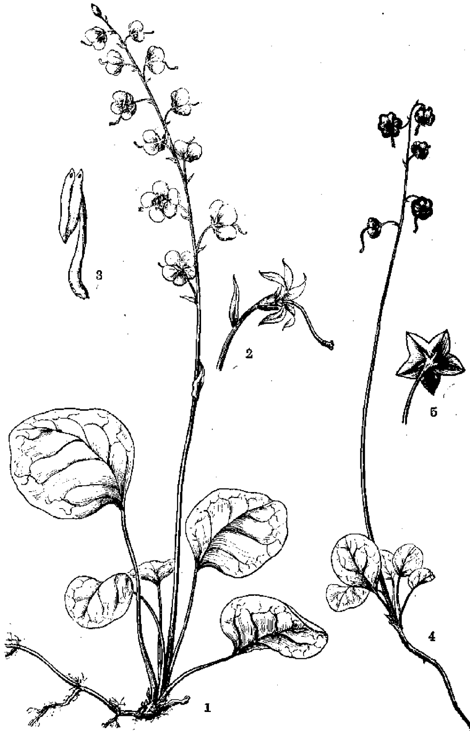
图版 1 鹿蹄草 Pyrola rotundifolia L. 1. 植株; 2. 花柱与花萼; 3. 雄蕊。绿花鹿蹄草 Pyrola chlorantha Sw. 4. 植株; 5. 花萼。 (田虹绘)