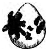
赛西蜚螂 粪球上的瘤

当隐居的幼虫已经开始长大时，我观察了一个小梨。我有时会看见它表面的某个部位湿润起来，变软，变薄；然后一个暗绿色的新芽通过一块不坚固的屏板升起，接着，新芽倒下，扭曲；形成一个瘤，随后因干燥而变黑。