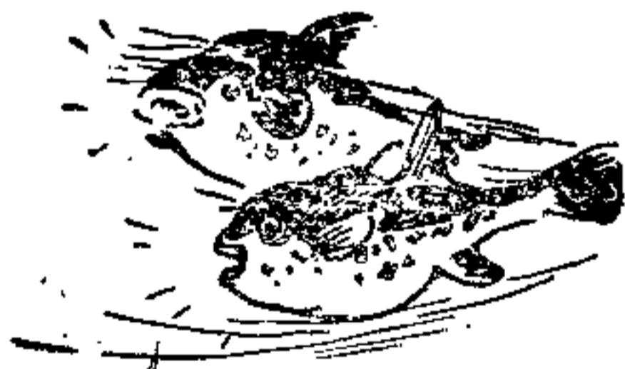
河豚的叫声象犬吠

悠扬而悦耳；箱鲀、河豚的叫声如犬吠；驼背鲂的声音象出征的战鼓；沙丁鱼发出的哗啦声，如浪涛拍岸，气势雄伟；小鲶鱼的声音如蜜蜂嗡嗡；黑背鲢的声音如风吹落叶，沙沙作响；海马、海胆的呼噜声如猪儿打鼾；石首