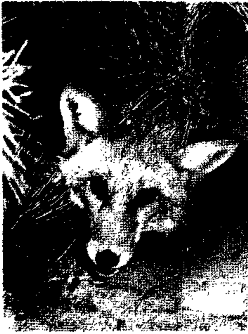
四、美洲赤狐有灵敏的嗅觉，机警而有智力。(参阅 185 页)