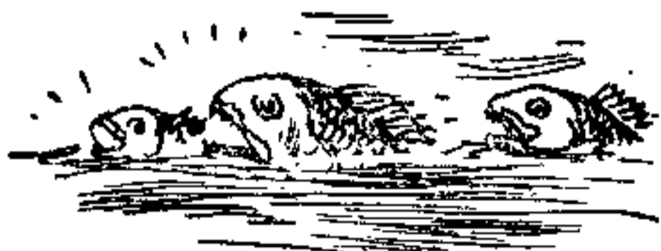
小黄鱼发出的声音象蛙鸣

了各种仪器帮助，能记录出鱼儿的各种声音，并追踪到它们的活动情况，因此对这种“语言”有进一步了解。