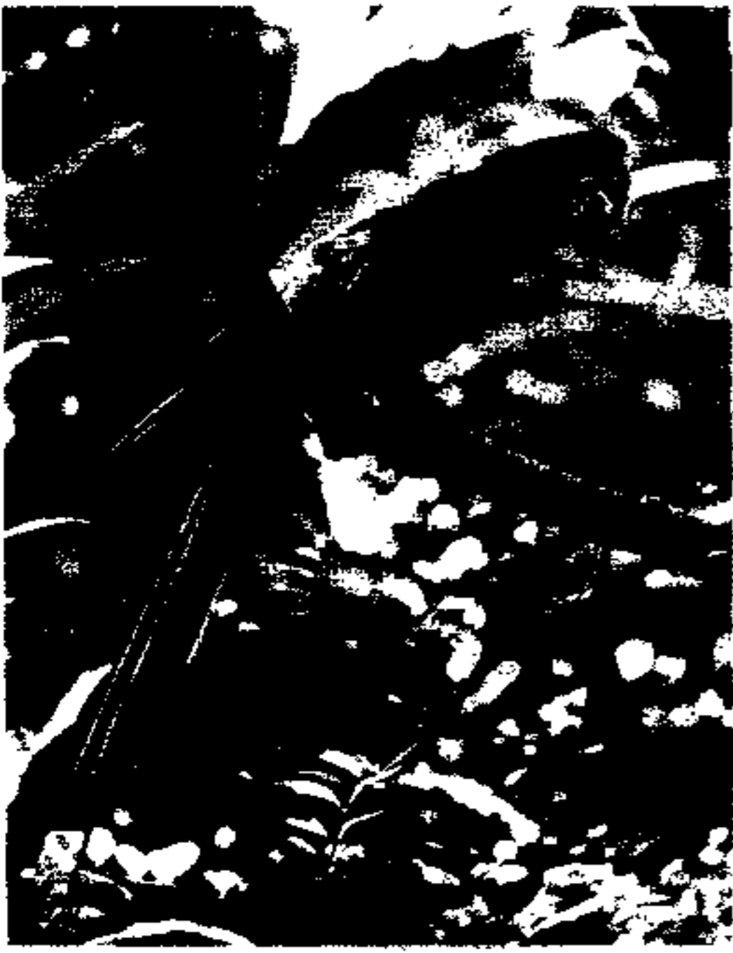
三、猩红鹈鹑、鲜艳美丽，是南美洲的一种大鸚鵡。(参阅 16 页)