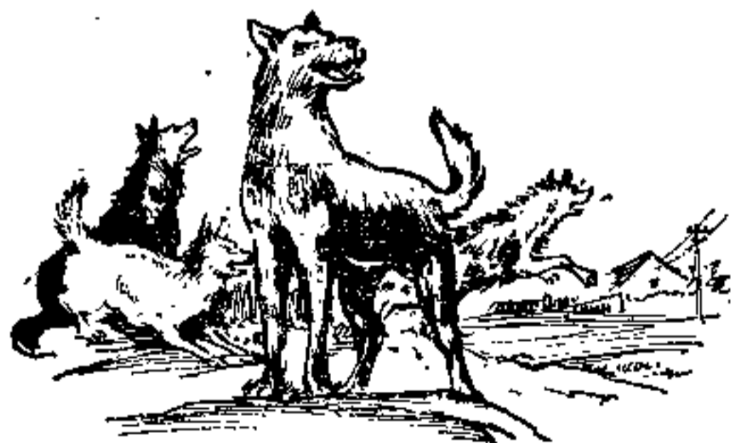
一只狗汪汪，许多狗一起响应

啼，都是走兽的“语言”。“一犬吠影，百犬吠声”，当一只狗发现了情况，用叫声告警，其他狗听了一齐响