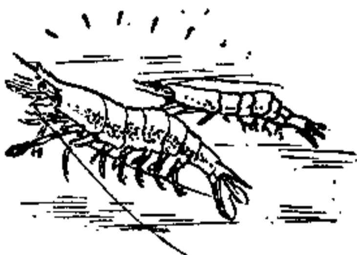
虾叫象竹扫帚的扫地声

了各种仪器帮助，能记录出鱼儿的各种声音，并追踪到它们的活动情况，因此对这种“语言”有进一步了解。