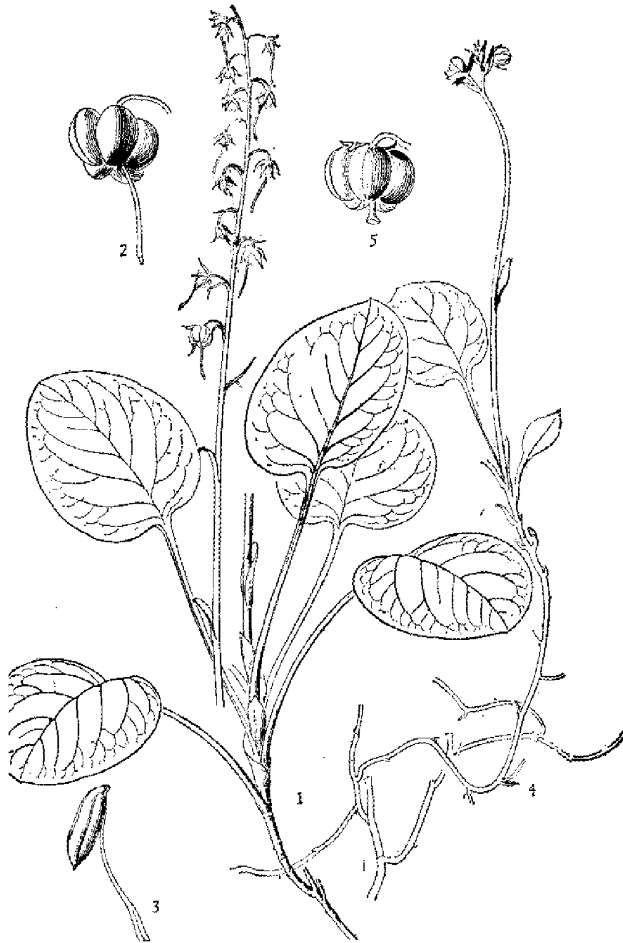
图版2 红花鹿蹄草 Pyrola incarnata Fisch. 1. 植株; 2. 蒴果外形, 示花柱长而弯曲; 3. 雄蕊, 示花药顶孔呈管状。 鳞叶鹿蹄草 P. subaphylla Maxim. 4. 植株; 短柱鹿蹄草 P. minor L. 5. 蒴果外形, 示花柱短而直。(冯金环绘)

Pyrola japonica Klenze ex Alef. in Linnaea XXVIII (1856) 57 (in nota); Nakai in Bot. Mag. Tokyo XXXV (1921) 146; Hara, Enum. Sperm. Jap. I (1948) 4; 中国高等植物图鉴 III (1974) 13, 图 3980; 牧野富太郎, 新日本植物图鑑 (1977) 451, 图 1802. — P. japonica Sieb. in Bonplandia X (1860) 93 (nom. nud.); Kitag. Lineam. Fl. Manch. (1939) 345; 刘慎谔等, 东北植物检索表 (1959) 272.