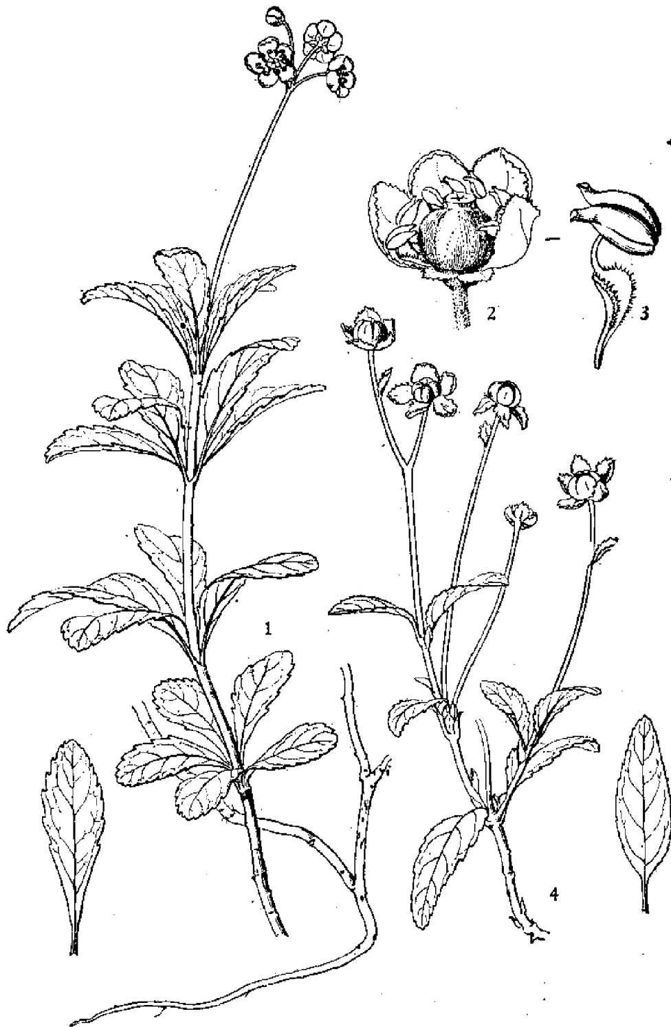
图版 4 伞形梅笠草 Chimaphila umbellata (L.) Barton 1. 植株外形及地下茎; 2. 花解剖; 3. 雄蕊。梅笠草 Ch. japonica Miq. 4. 植株外形及叶形。(张桂芝绘)

数,常排成 3—5 轮,革质,倒披针形,长 2.5—4.5 厘米,宽 7—12 毫米,顶端钝圆或近急尖,向基部渐狭,中部以上边缘有粗锯齿,表面暗绿色,叶脉凹入,背面淡绿色,叶柄长 4—7 毫米。伞形花序,总梗长 4—6 厘米,有乳头状突起,有花 3—4 朵;苞片披针形,长约 4 毫米;