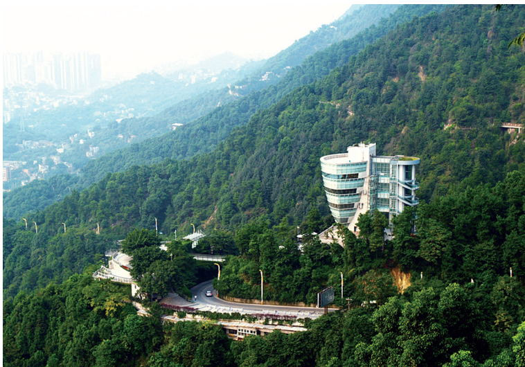
南山一棵树观景台

堪为读书佳境的南山，最令人浮想翩翩的是那座文峰塔。“秀培主山，郁起人文”的文峰塔始建于1851年，“万松围护、攒天一碧、峭立山巅”，是南山人文遗风最具象征的建筑。作家况浩文先生的力作《一双绣花鞋》中的动人故事，正是以文峰塔为背景展开的。小说字里行间的那些惊悚、那些神秘、那些离奇，在南山这样的风景中一幕幕出现，令读者也随着情节的发展产生天马行空的想象。