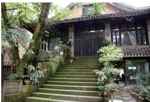
抗战时期德国大使馆

在南山，重庆邮电大学的历史从1950年东川邮政管理局邮政人员训练班开始，历经1953年建设重庆邮电学校、1955年更名“重庆电信学校”、1959年成立重庆邮电学院、1970年改名为“电信总局529厂”、1973年改名为“邮电部第九研究所”、1979年重庆邮电学院恢复办校、2006年更名为“重庆邮电大学”的变迁。在60年的暑热寒风、春华秋实、坎坷岁月中，学校师生始终秉承教学科研为国家建设发展服务的宗旨，并将之视为自身发展