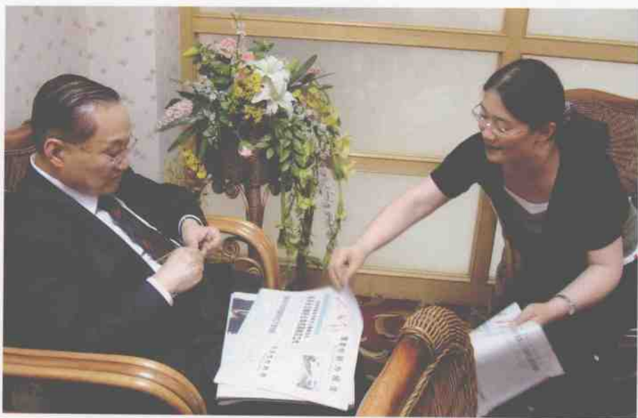
2007年6月18日，本报记者王庆环采访香港著名作家金庸。