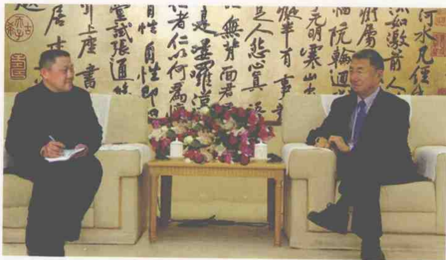
2007年初,本报记者郑晋鸣采访著名物理学家、诺贝尔奖获得者丁肇中。