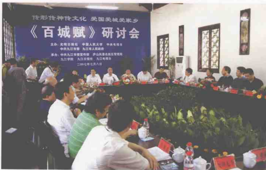
2007年7月8日，本报和中国人民大学、中央电视台、九江市委市政府在江西九江白鹿洞书院联合主办“百城赋”研讨会。