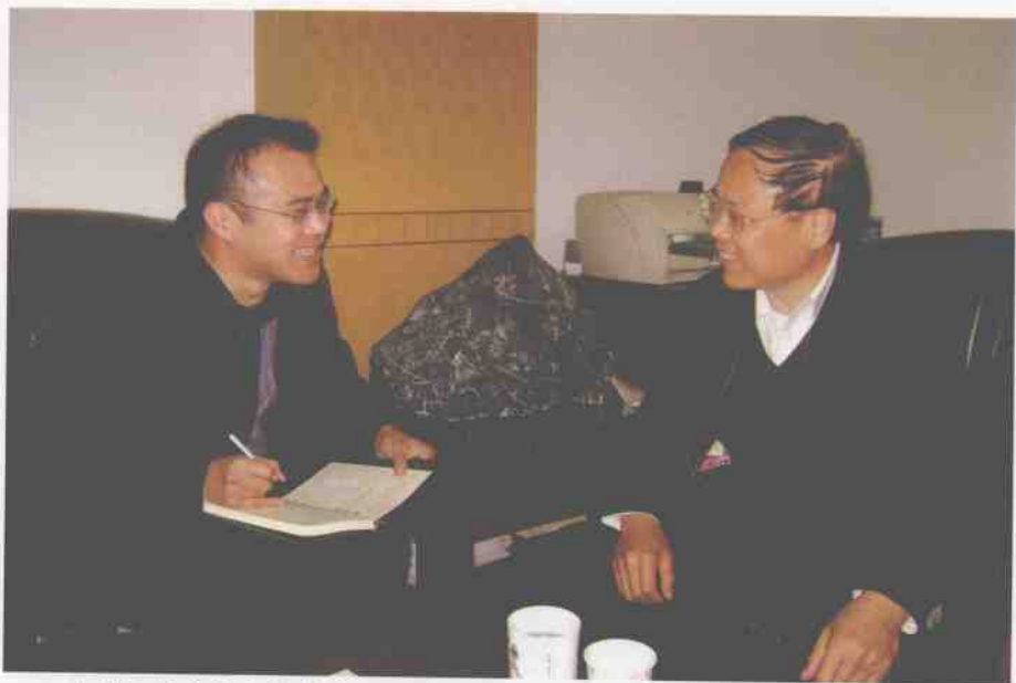
在贯彻落实十七大精神主题采访中，本报记者李可在江苏采访江苏省社科院院长宋林飞。