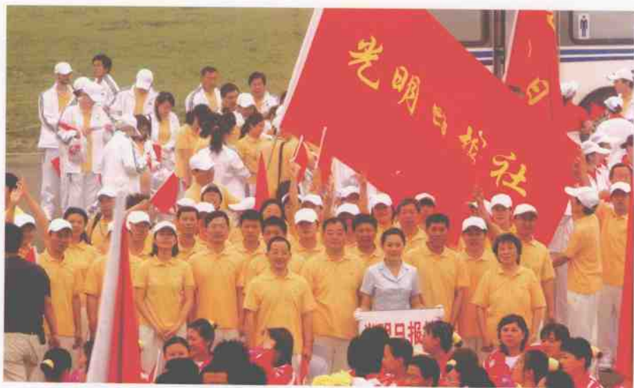
2007年6月2日，光明日报组成代表队参加中直机关第七届运动会。报社共有149人参加此次活动，其中80余人参加了比赛。