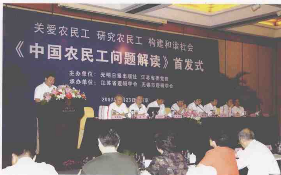
“光明学术文库”是被列入《“十一五”国家重点图书出版规划》的大型学术著作出版工程。图为学术文库新书首发式。