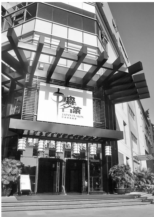
嵌入现代大厦中的传统日本料理饭店