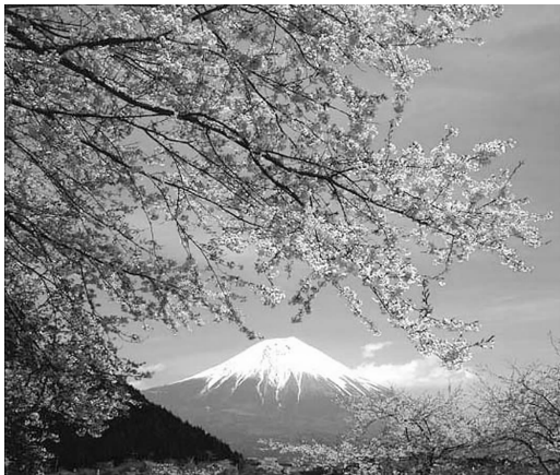
日本自然和性格的象征，富士山与樱花

在亚洲大陆的东侧，如同一把碎石从东北向西南撒过来散布在北太平洋，由此形成了一溜大小岛屿。在那里日出比亚洲大陆要早一个小时，因此这里居住的人们用朝日来称谓这一串岛屿，对大陆来说那里是日出之处，有人说是盛唐女皇武则天给那里起了个名字叫“日本”。