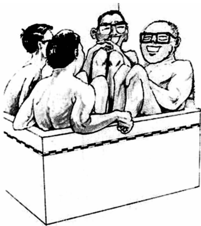
英国教科书中形容的日本式群体交际

对那些“对人不安”的日本人来说，最为恐怖和羞耻的事情是“与众不同”。他们深知做事不得自作主张、标新立异，更不能轻举妄动。离开了集体，一个人不但什么也做不了，还可能要遭受到集体的蔑视和攻击，要忍受孤独、寂寞甚至屈辱。他们普遍愿意被包裹在日本式的小集团中安稳度日，具有强烈的对群体对集团的归属感。他们普遍认为集团的意志就是自己的信念，集体的力量是无穷的，集体的任何事情离了谁“地球照转不误”。认为所有成绩都是大家的，是大家共同努力的结果，个人再能，也是集体中的一分子。要不是公司给你提供好的工作环境，要不是有大家的全力协助，纵然你会十八般武艺、七十二种变化，一个跟头能翻十万八千里，你能怎么着？到头来你能折腾出集体这个如来佛的手掌心吗？那里并不需要特别能干的人，如果谁特别有主意，有新想法，或者标新立异显得突出能干的话，