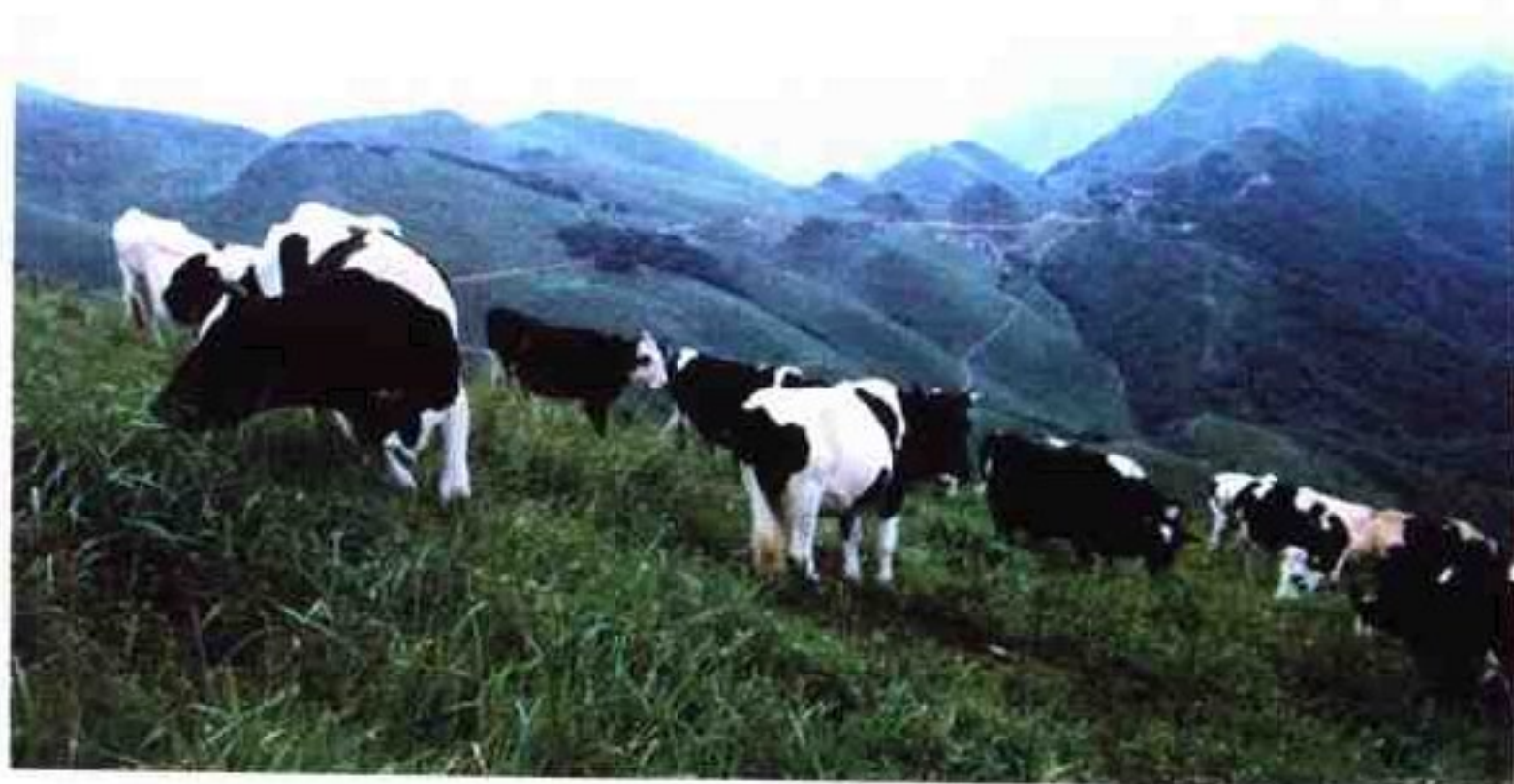
天然真正无污染高山草原