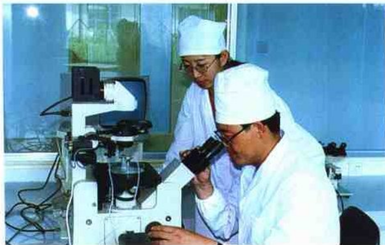
科技人员徒手切割胚胎

沐浴着改革开放的春风，伴随着经济发展的步伐，内蒙古家畜改良工作站自1957年成立以来，技术队伍不断壮大，服务功能逐步增强，科技推广与开发硕果累累，已发展成为集科研、生产、推广、开发、种畜禽质量监测于一体的家畜改良社会化服务中心。依托高新技术成立的内蒙古高达生物工程研究开发公司，标志着全区家畜改良事业揭开了崭新篇章，标志着畜牧科技向高新技术产业化迈出了雄健步伐。