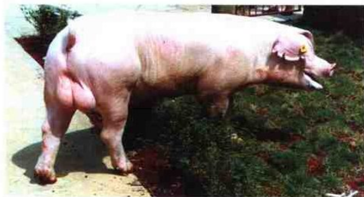
长白猪:2000年引进,饲料转化率2.69,瘦肉率67%,肢蹄较原长白猪有明显改进,双肌臀明显

来源的“双肌臀联合育种组”已开展了四次研讨活动。该中心还与中国农大、国家农业生物技术重点实验室、江西农大等科研院校合作,应用分子生物学等高新技术,培育具有世界先进水平的种猪——中国超级猪。