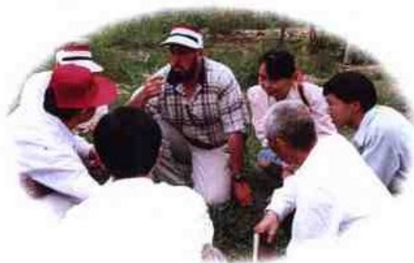
澳大利亚专家专程到牧场技术指导

于都屏山牧场地处于都县境内的屏坑山顶端，平均海拔高度1300米，总面积3000多公顷。牧场气候湿润，水源充沛，土质肥沃，牧草丰厚，年平均气温16.7℃，最高气温29℃，最低气温零下6℃，无部落居住，距山下村庄10公里，无污染，是我国南方少有的天然高山牧场。屏山牧场总投资达到1800万元，已有存栏奶牛100多头，肉牛500多头，肉羊近千头，形成了一牧业为基础，加工为主导，产供销一条龙，牧工贸一体化，并与旅游资源配套开发，协调发展的绿色企业集团。屏山牧场引进澳大利亚工艺技术和设备，生产有屏山鲜牛奶、高山青草奶、奶茶等系列饮料产品，“鲜奶来自云端草原，产品在原始森林加工”，是真正的绿色产品。