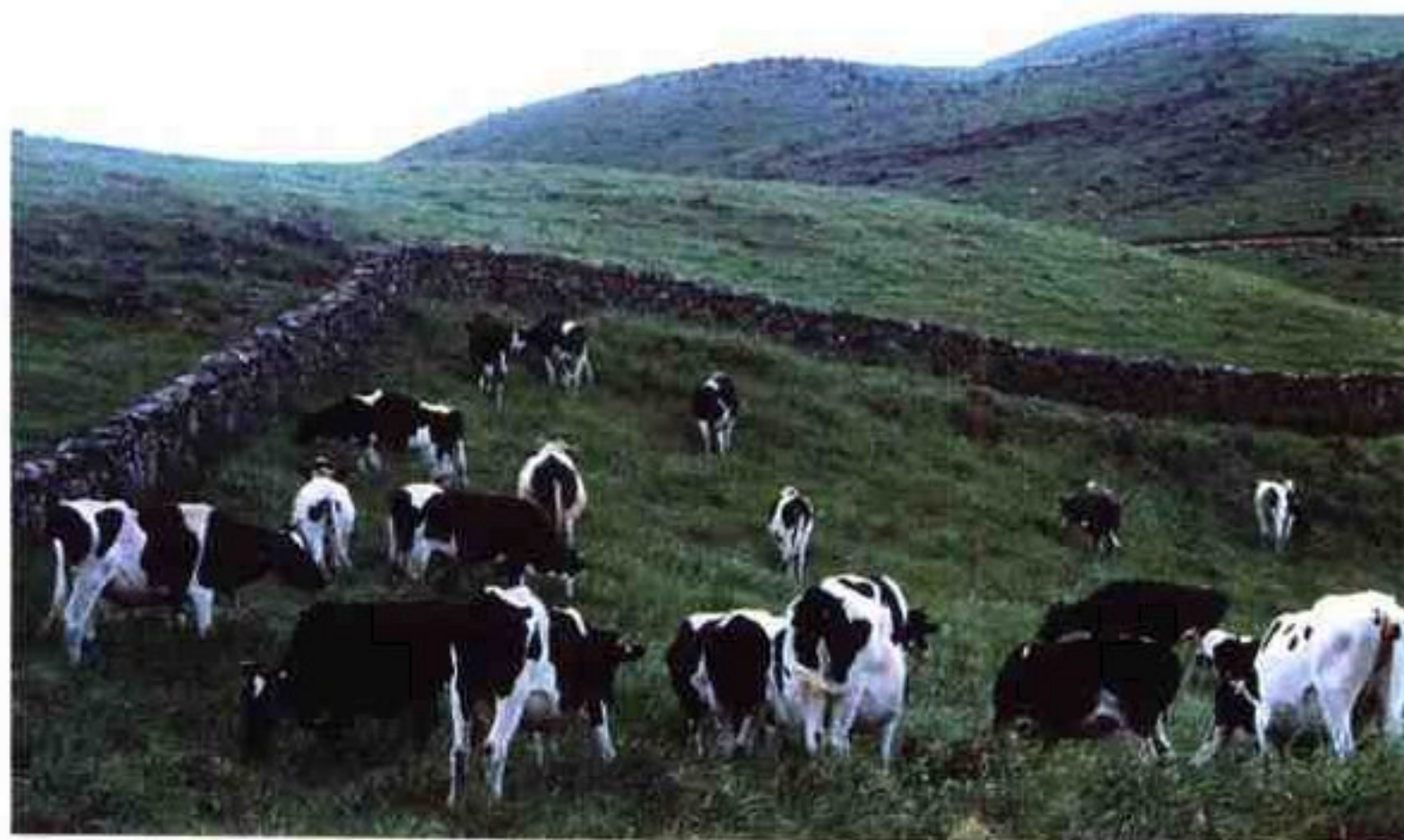
围栏轮牧一角，令人心旷神怡