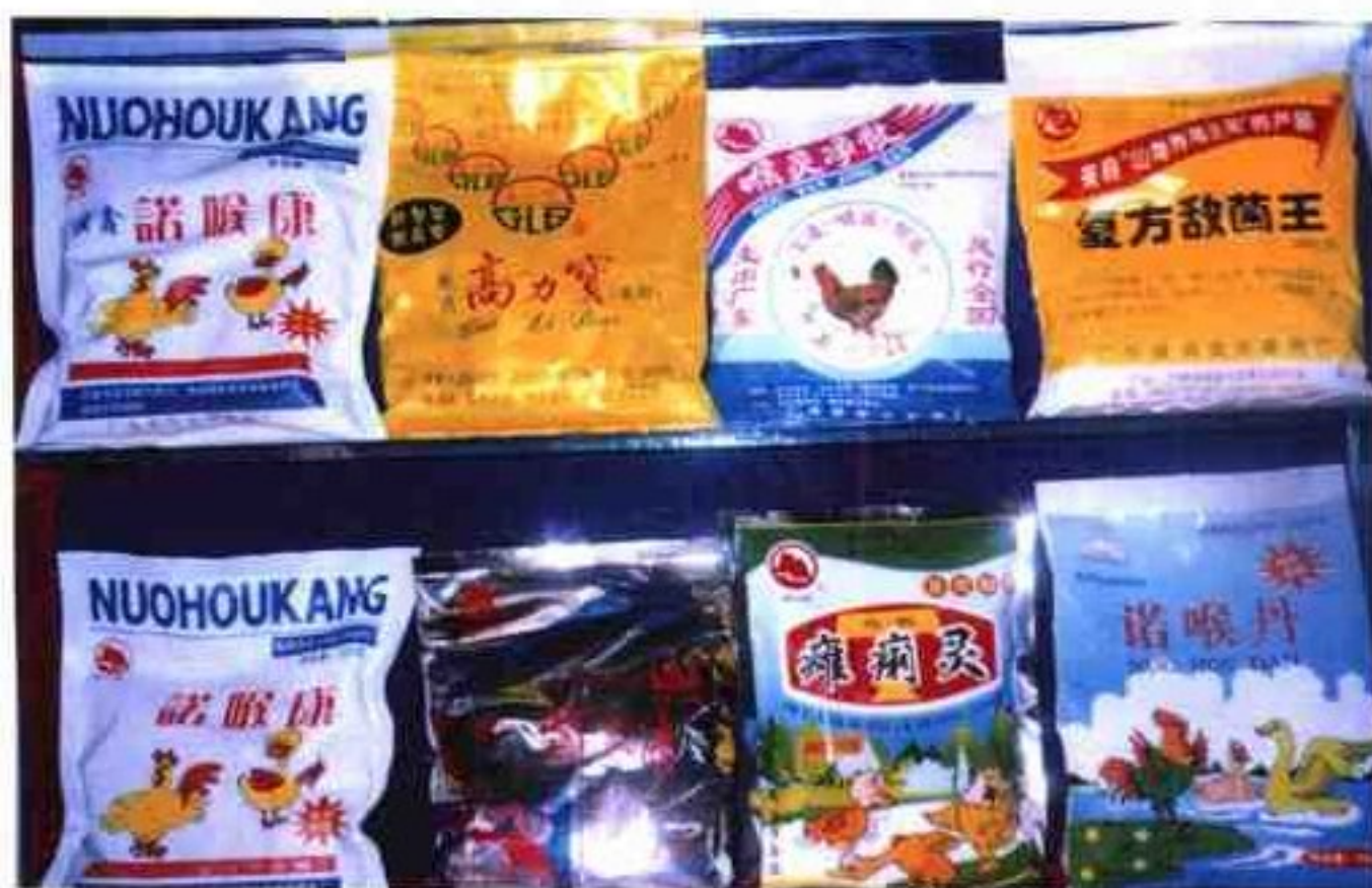
信宜市兽药厂生产的部分兽药

以比“八五”期末数倍的速度增长；畜牧业产值超过20亿元，基本实现了畜牧业占农业半壁江山的目标；肉类总产量15.5万吨。自1998年以来，肉类总产量在广东各县(市)中名列第一，牧业产值名列第二。