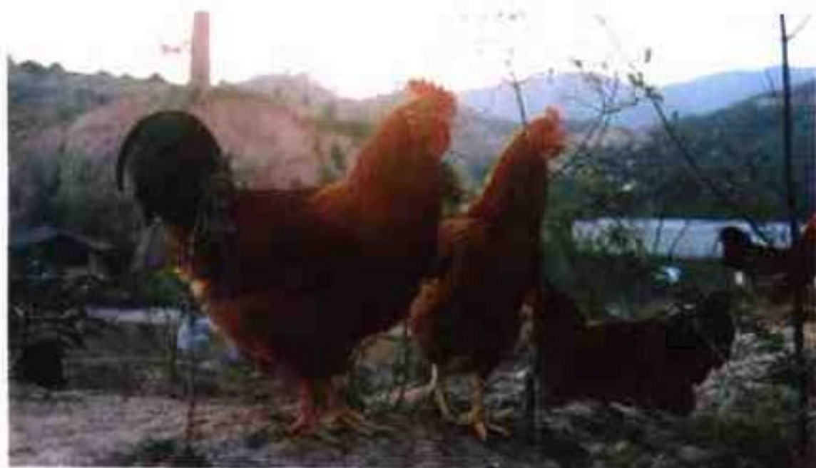
信宜市山地鸡阉鸡

开放改革以来，特别是1991年以来，广东省信宜市畜牧业取得连续10年高速发展。在“九五”期末的2000年，以山地鸡为主的三鸟出栏量达6 658万只，比“八五”期末1995年的3 680万只增长60%，是“七五”期末1990年300万只的22倍；生猪出栏量61万头，比“八五”期末1995年的37万头增长65%，是“七五”期末的1990年25万头的2倍多；山羊、肉兔等草食性动物也