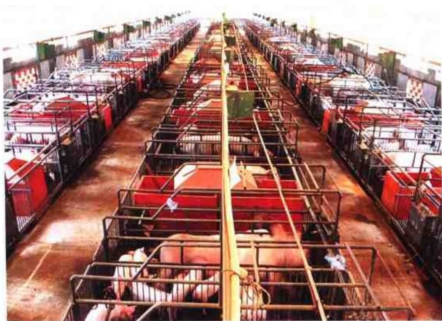
闭路电视24小时监控的产仔舍

江西省养猪育种中心是在原国家级重点种畜禽场(1993年挂牌)——江西省种猪场的基础上组建的,由原种猪场、种猪性能测定站和种猪饲料厂组成,期间得到农业部和江西省委省政府的支持。目前,种猪基础群母猪扩大到1500头,供种能力提高了五倍,种猪销售覆盖全国30个省市,取得了很好的经济和社会效益,人均创利近五万元。先后三次从加拿大、美国、丹麦引进了双肌臀大白猪、杜洛克和新丹系长白猪,种猪质量得到极大提高。特别是双肌臀大白猪的推广开创了我国引进种猪的新局面,创立了“赣绿”品牌,成套复制推广至12个省16个种猪场。第一个具有相同遗传