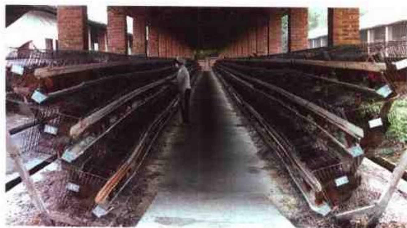
市种鸡场清远麻鸡原种群

清远市畜牧水产示范场隶属市畜牧水产局，是全市规模最大的，集科研、生产、示范、科技推广和销售、生态环保于一体的多功能综合性示范农场。