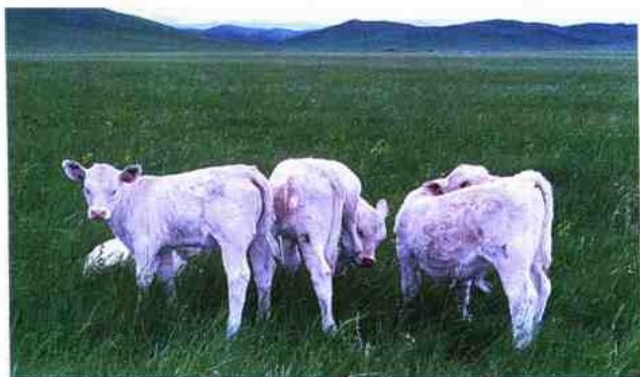
夏洛来胚胎移植犊牛

内蒙古家畜改良工作站现有高级畜牧兽医师19人，畜牧师20人，博士研究生3人，硕士研究生5人，一部分青年科技人员已成为生物工程领域的学科带头人和跨世纪的人才。内蒙古家畜改良工作站仪器设备先进，拥有冻精生产和胚胎生产移植成套大型精密仪器等现代化实验生产设施。站内现饲养着从加拿大引进的世界一流的纯种优秀西门塔尔、夏洛来、海福特、安格斯、利木赞、德国黄、皮尔蒙特、荷斯坦等八个品种的肉用和乳用种公牛60头，种母牛70头。年生产冻精100万支（粒），冻