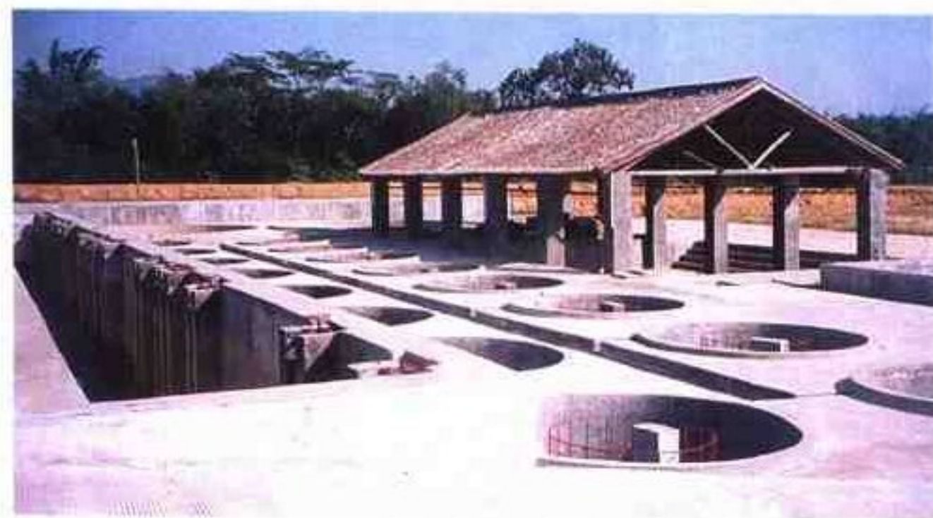
设计先进，年产15亿尾的北江名优鱼种孵化场一角