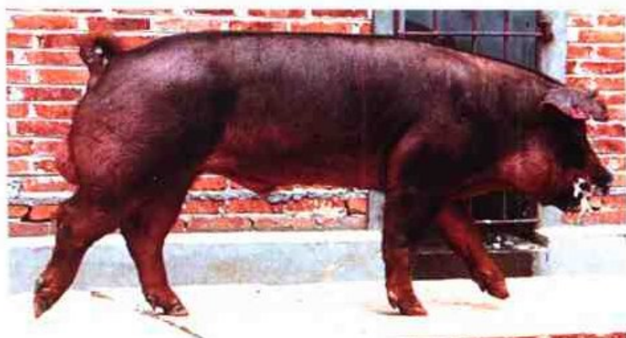
杜洛克:1999年引进,瘦肉率69%,全部来自美国SPF猪场,双肌臀明显

同时,引进法国ACEMA-64育种自动化测试系统,建起了年检测种猪1500头规模的种猪性能测定站;还建立起了种猪饲料厂,开发出对人畜和环境无害的高产高效的绿色饲料,年单班种猪用预混料3000吨,全价料1万吨。江西省养猪育种中心面向市场,依靠科技,正朝着更快、更好的方向发展。