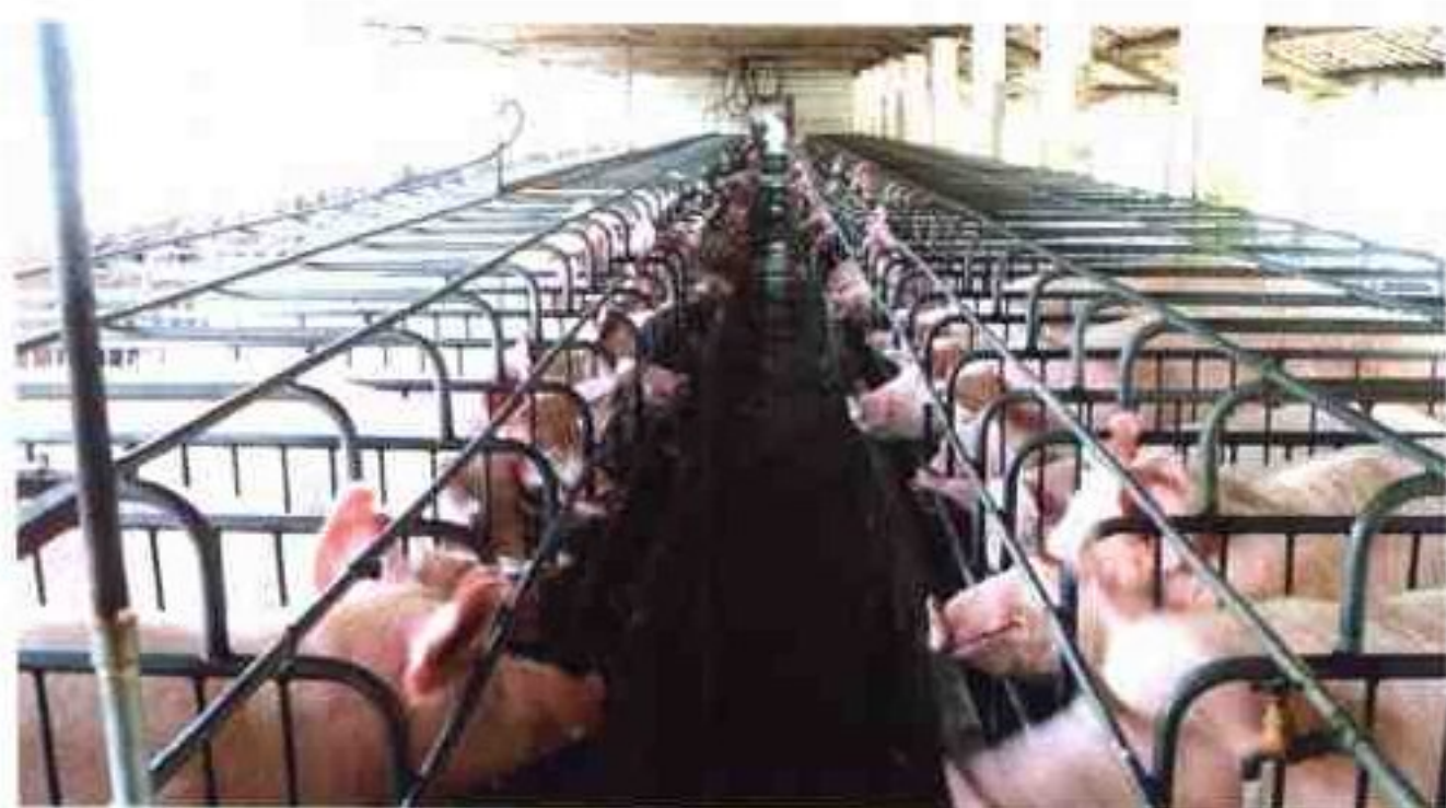
万头瘦肉型猪场生产线一角