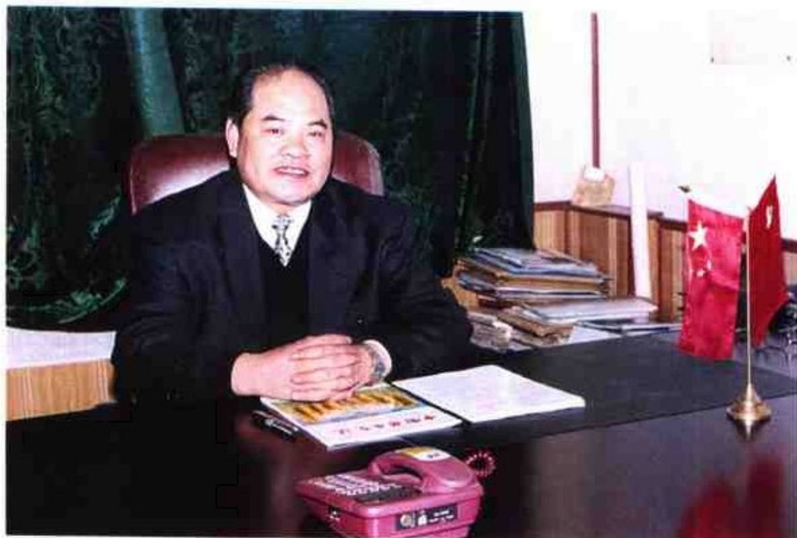
天津市宝坻县畜牧水产局局长