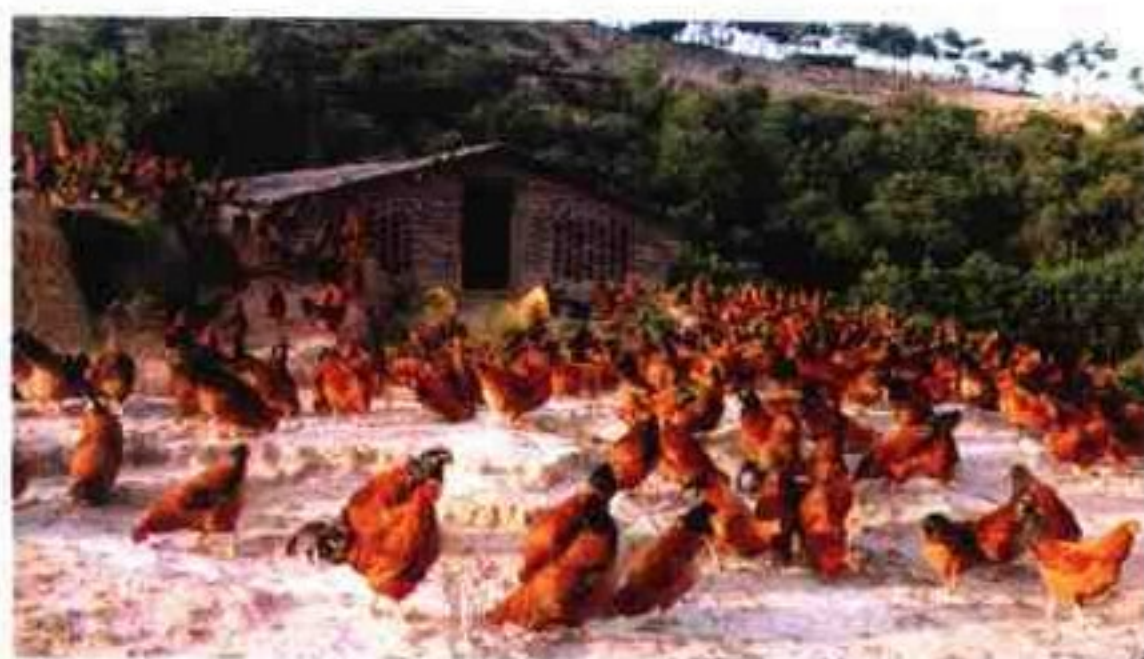
信宜市山地鸡阉鸡