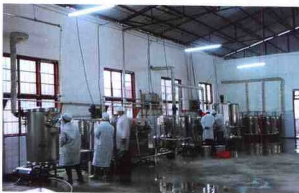
车间一角，购进的班产4吨甜牛奶、奶茶、鲜奶生产设备

于都屏山牧场地处于都县境内的屏坑山顶端，平均海拔高度1300米，总面积3000多公顷。牧场气候湿润，水源充沛，土质肥沃，牧草丰厚，年平均气温16.7℃，最高气温29℃，最低气温零下6℃，无部落居住，距山下村庄10公里，无污染，是我国南方少有的天然高山牧场。屏山牧场总投资达到1800万元，已有存栏奶牛100多头，肉牛500多头，肉羊近千头，形成了一牧业为基础，加工为主导，产供销一条龙，牧工贸一体化，并与旅游资源配套开发，协调发展的绿色企业集团。屏山牧场引进澳大利亚工艺技术和设备，生产有屏山鲜牛奶、高山青草奶、奶茶等系列饮料产品，“鲜奶来自云端草原，产品在原始森林加工”，是真正的绿色产品。