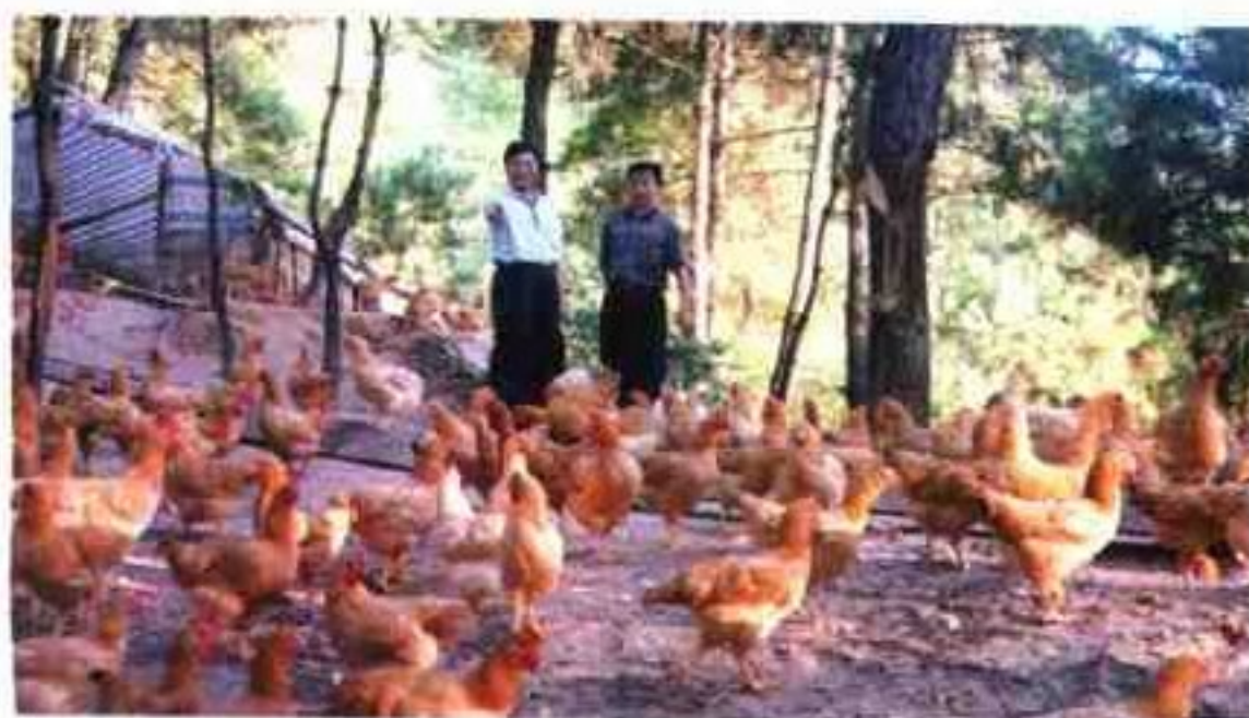
信宜市山地鸡项鸡