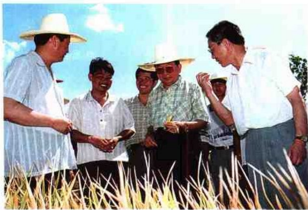
● 田纪云副委员长在省委书记舒惠国的陪同下，视察公司的饲料生产基地

江西国鸿实业有限公司创办于1989年，是一家以“公司+农户”为生产经营模式，以养殖优质瘦肉型猪出口香港和加工冷鲜肉内销为主营业务的大型私营企业。公司注册资金3688万元，占地约19万平方米，年产值5000万元，创汇460万美元。公司多次被评为省市先进私营企业，党和国家领导人江泽民、宋平、田纪云、姜春云、毛致用、李铁映等先后亲临视察。