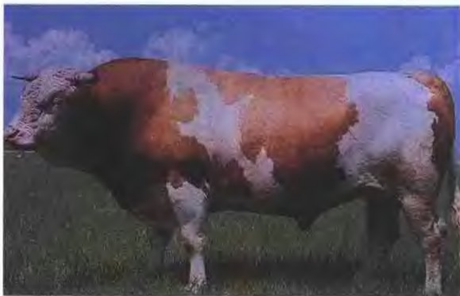
三河牛(公) 原载《中国牛品种志》