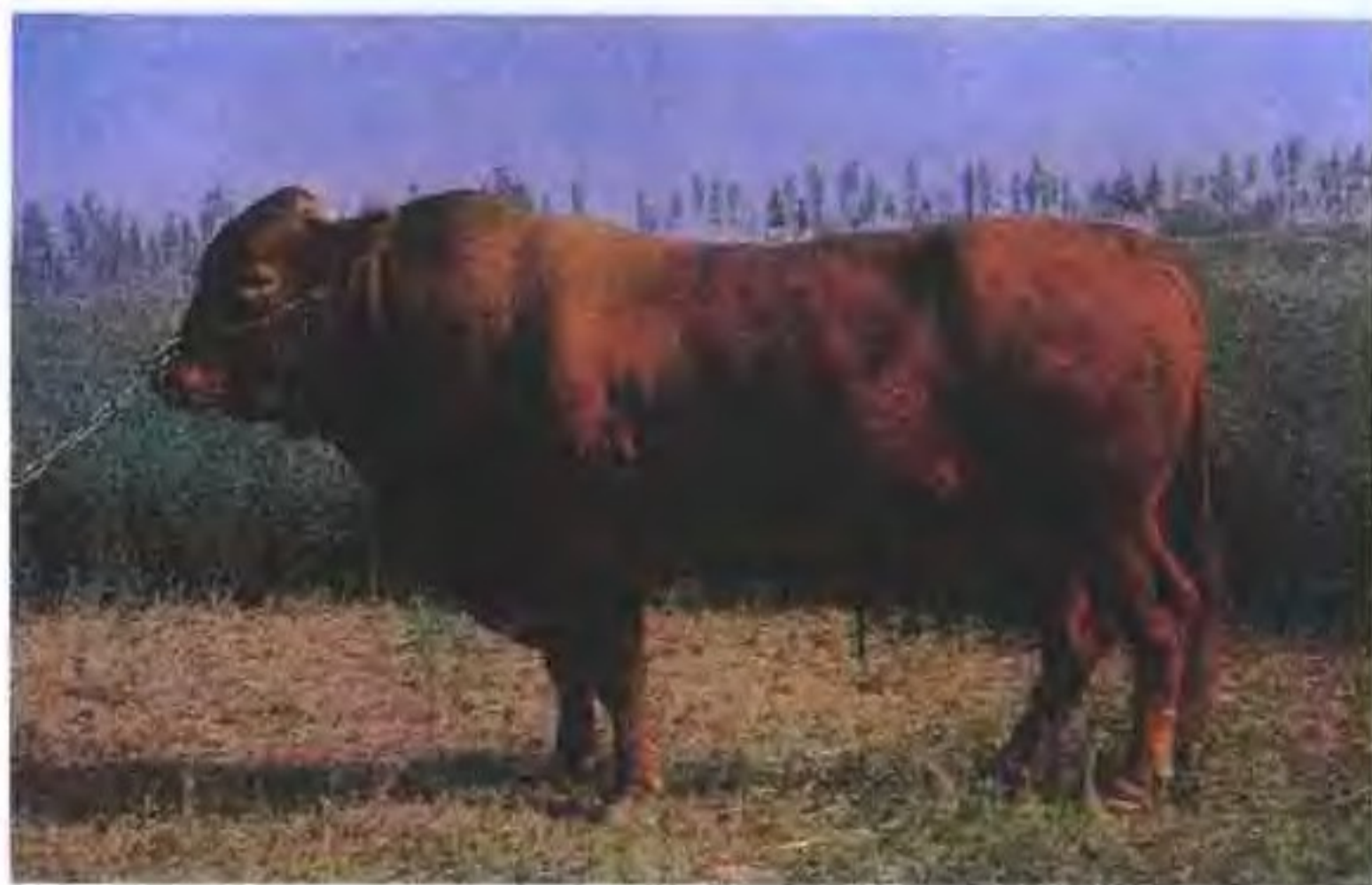
秦川牛(公)