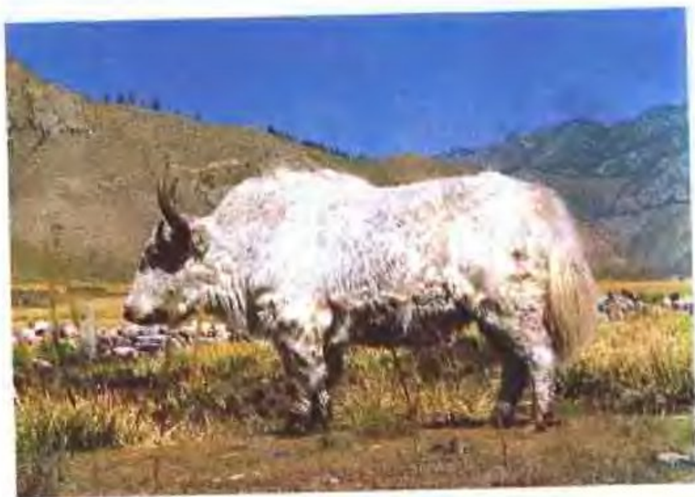
天祝白牦牛(公)