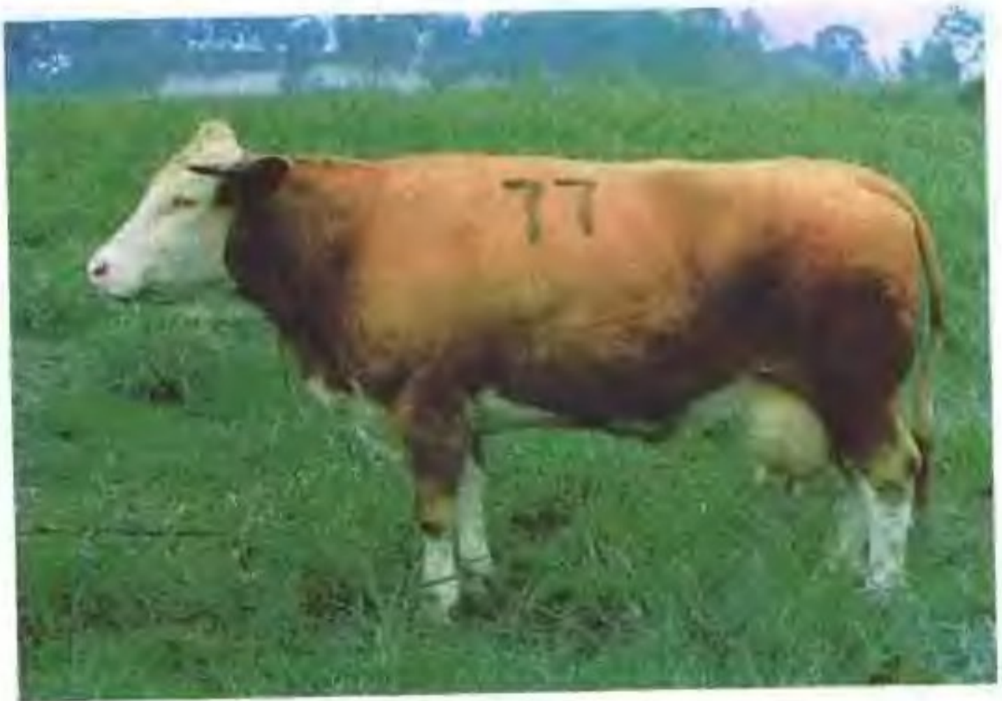
西门塔尔牛(母)