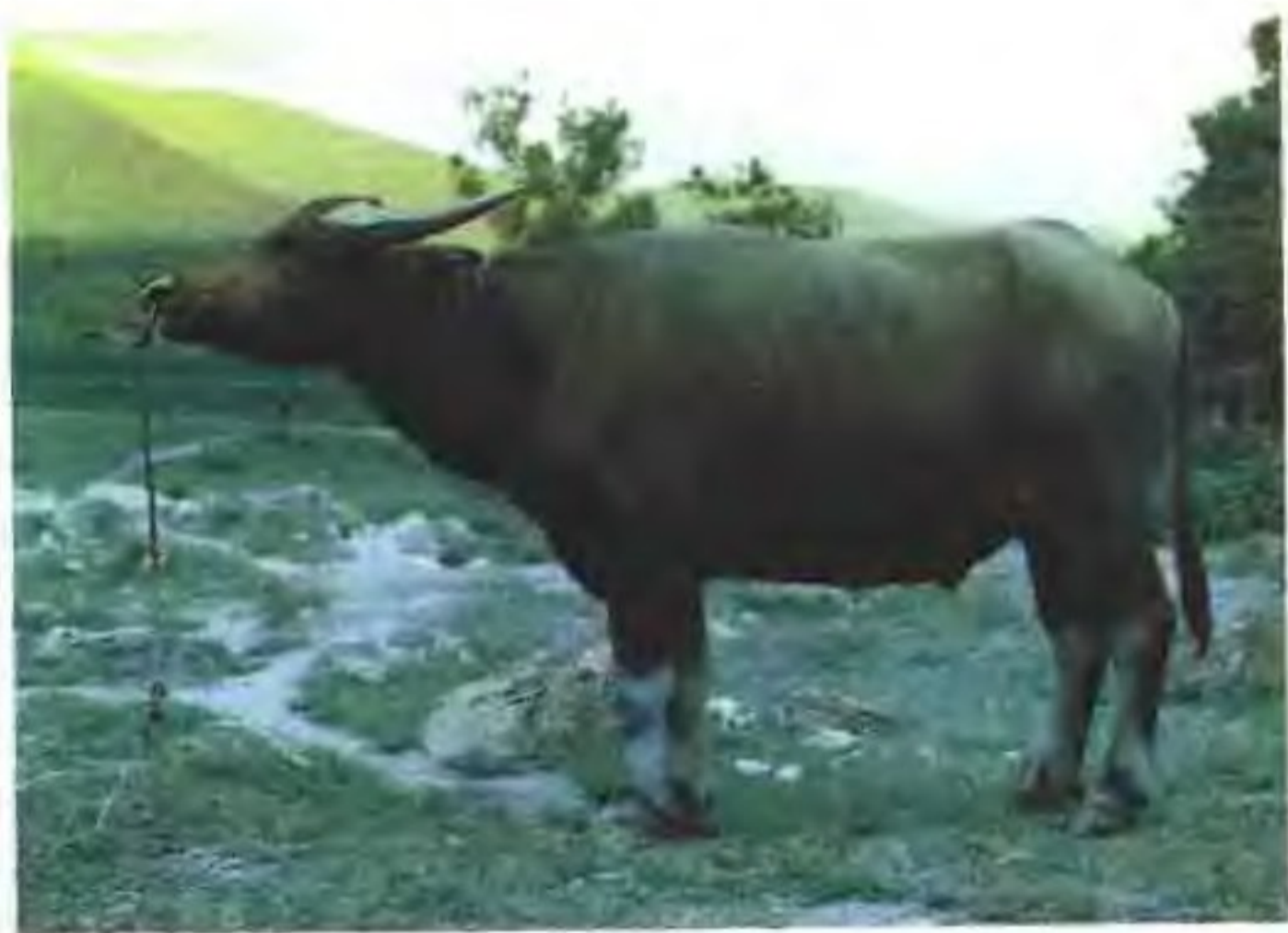
中国水牛(公)