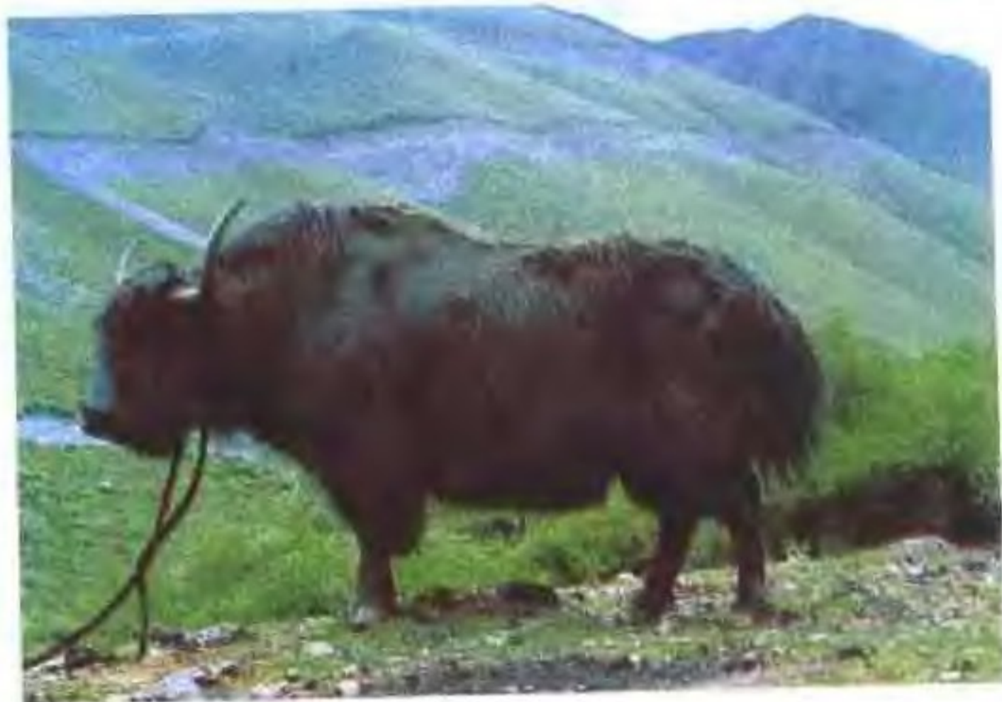
九龙牦牛(公)