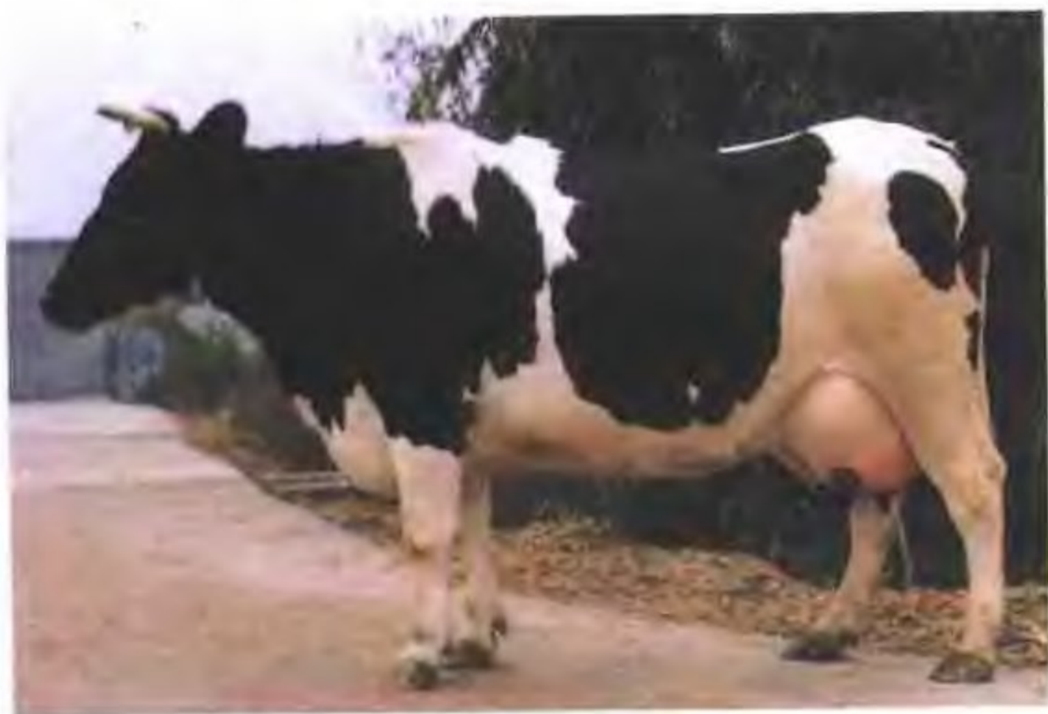
中国荷斯坦牛(母)