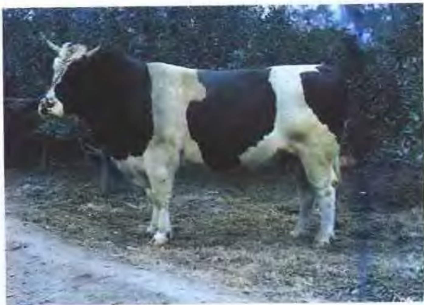
中国荷斯坦牛(公)