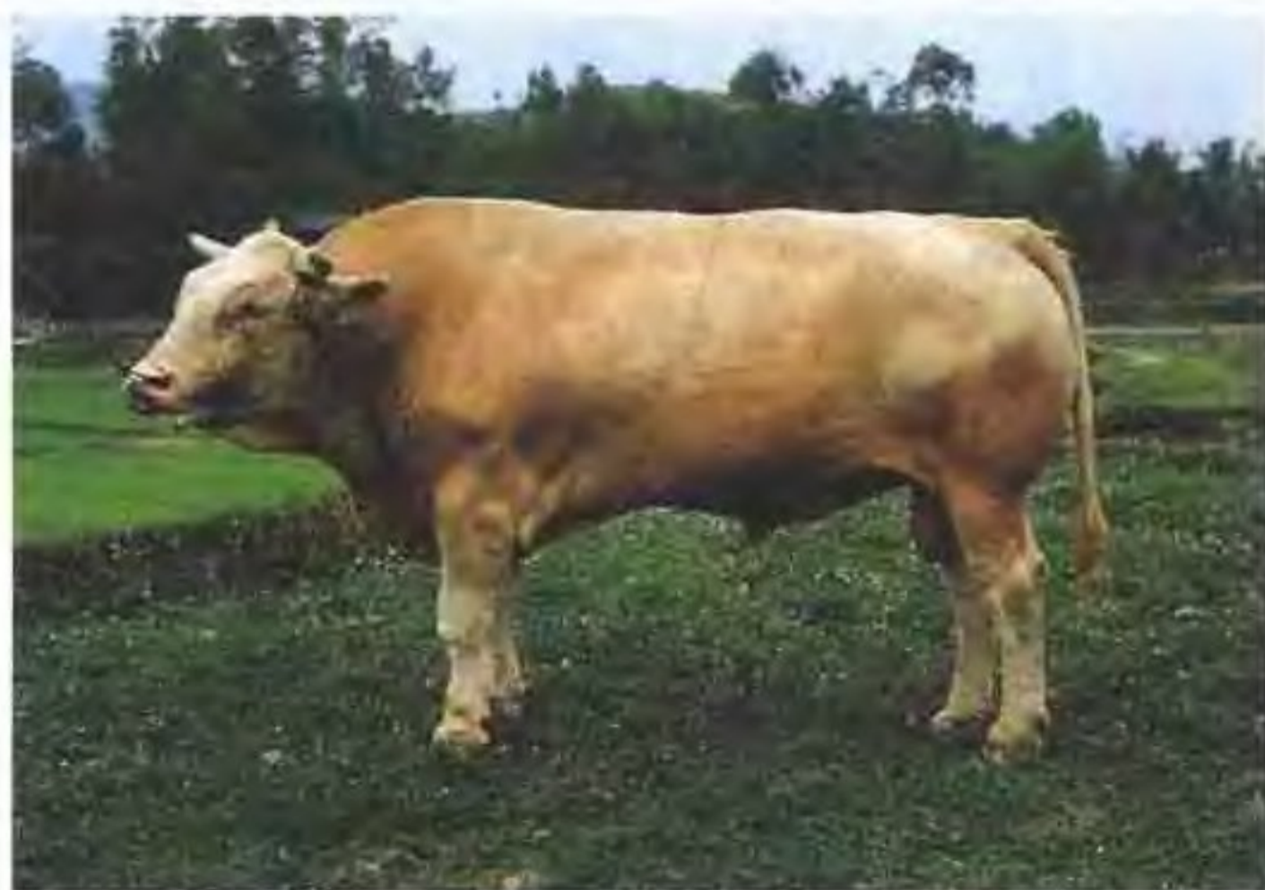
夏洛来牛(公)