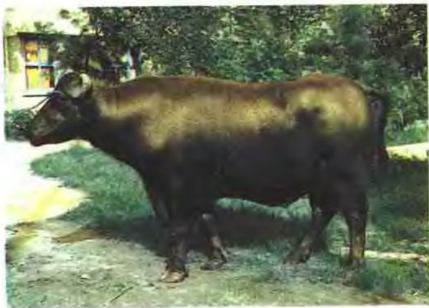
摩拉水牛(公)