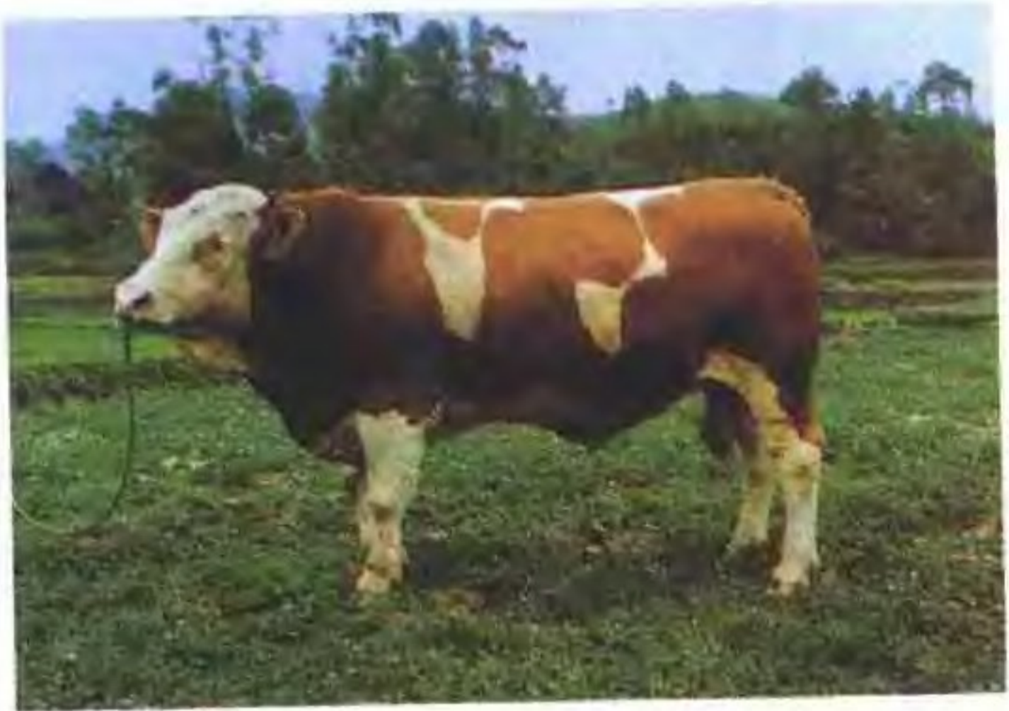
西门塔尔牛(公)