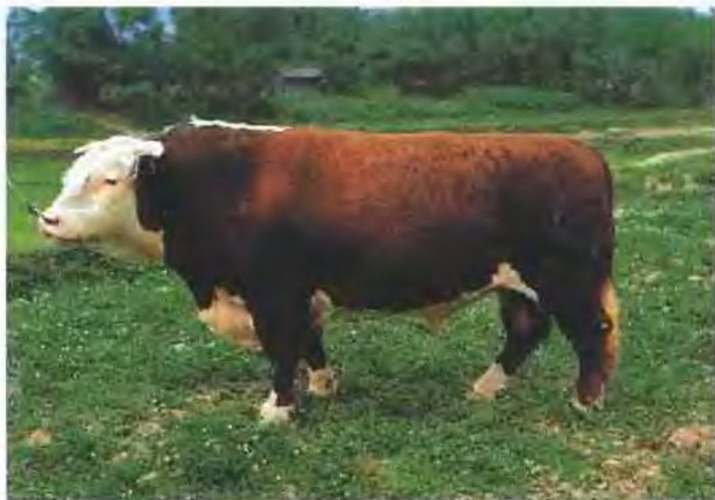
海福特牛(公)