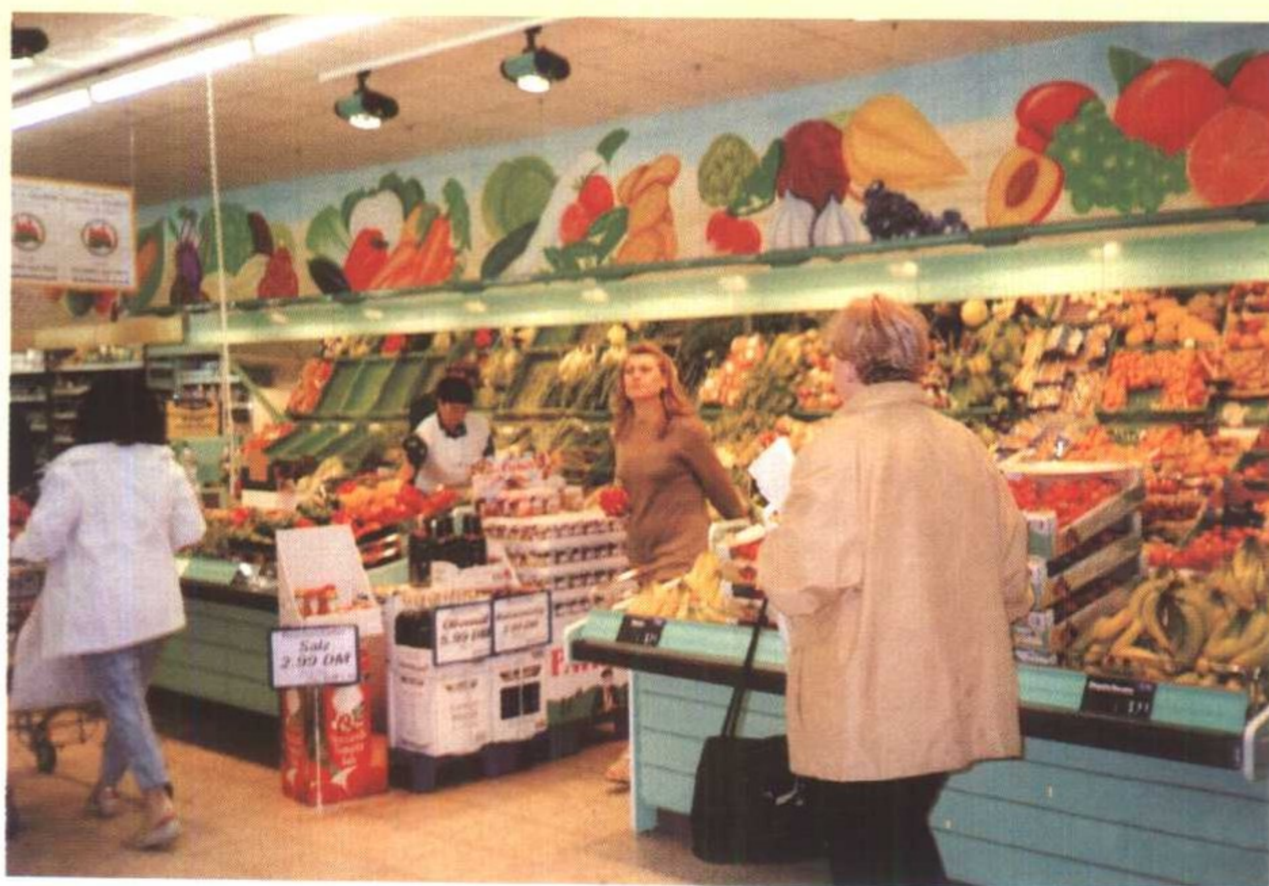
德国有机蔬菜专柜