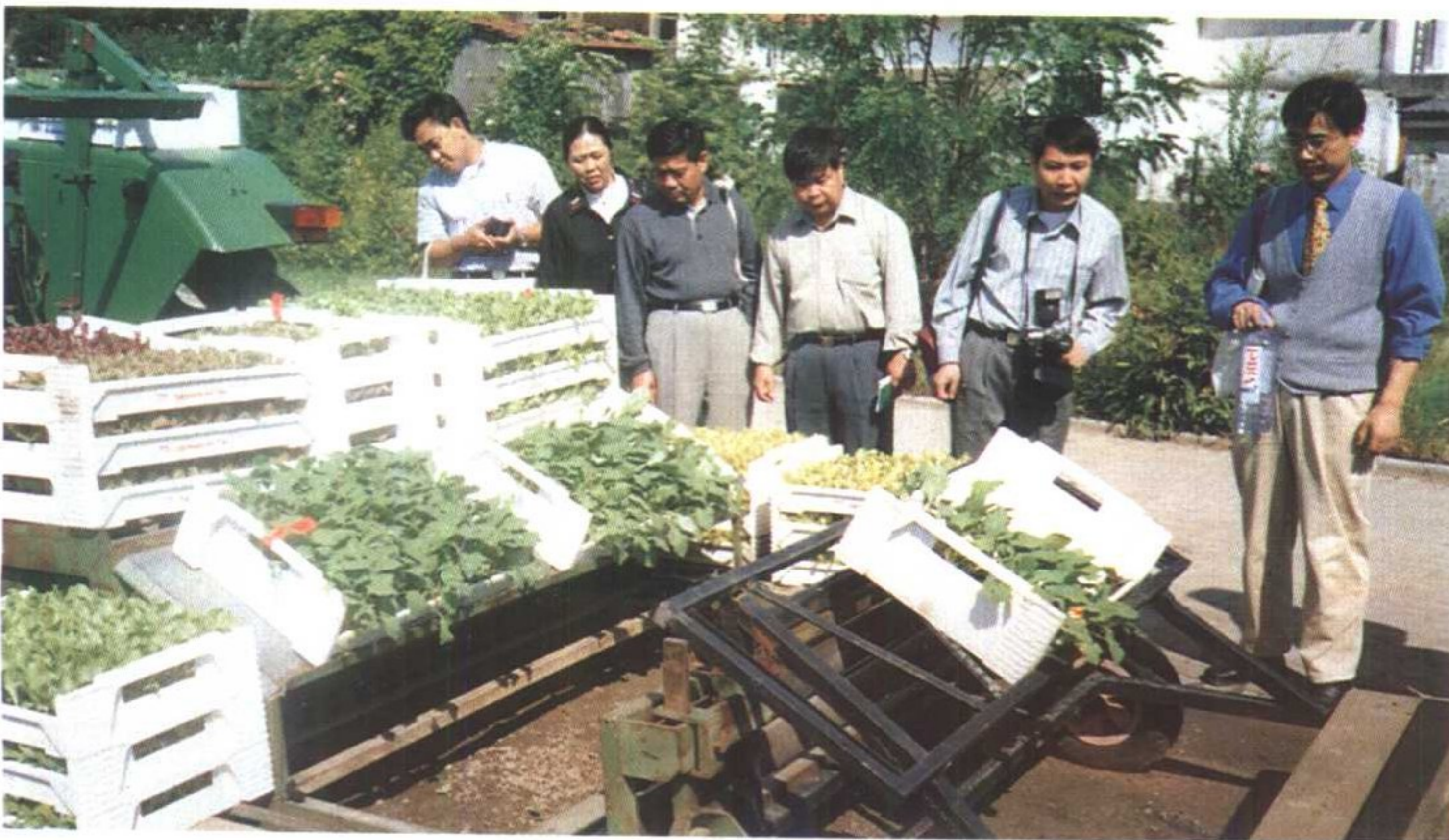
有机农业中广泛使用农业机械