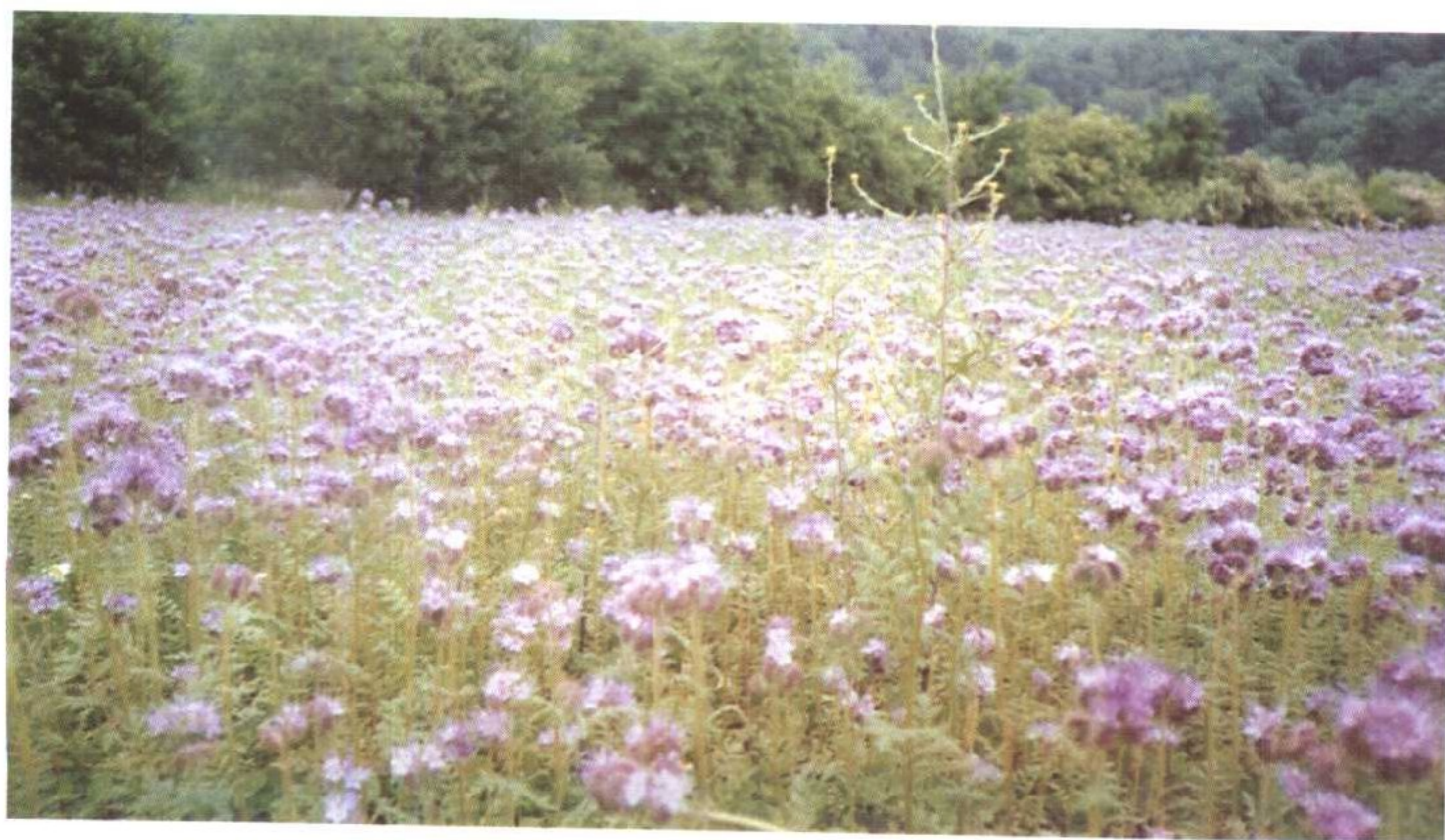
蜜源植物是有机农业中的新宠