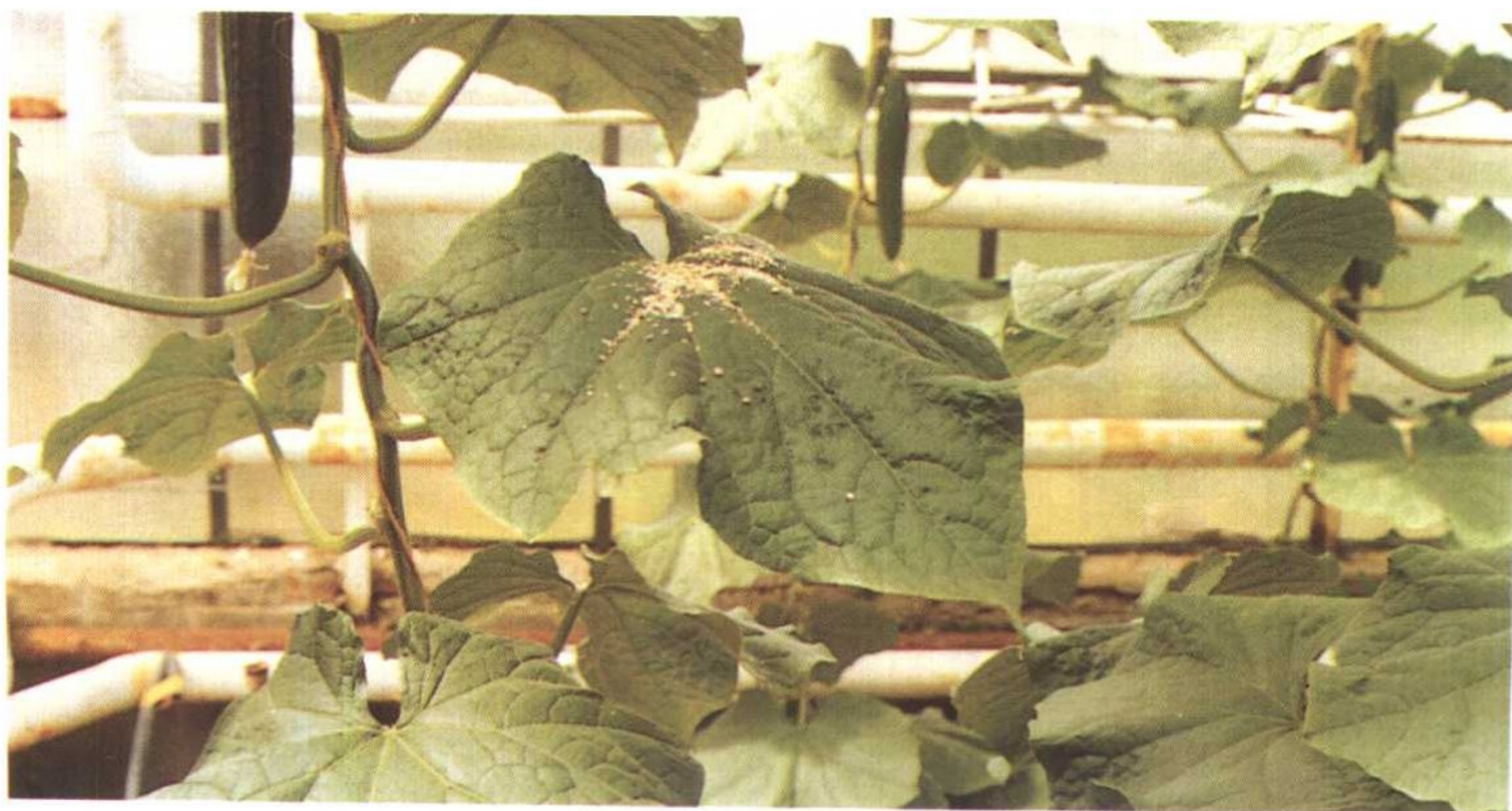
大棚生产中释放捕食螨防治害虫