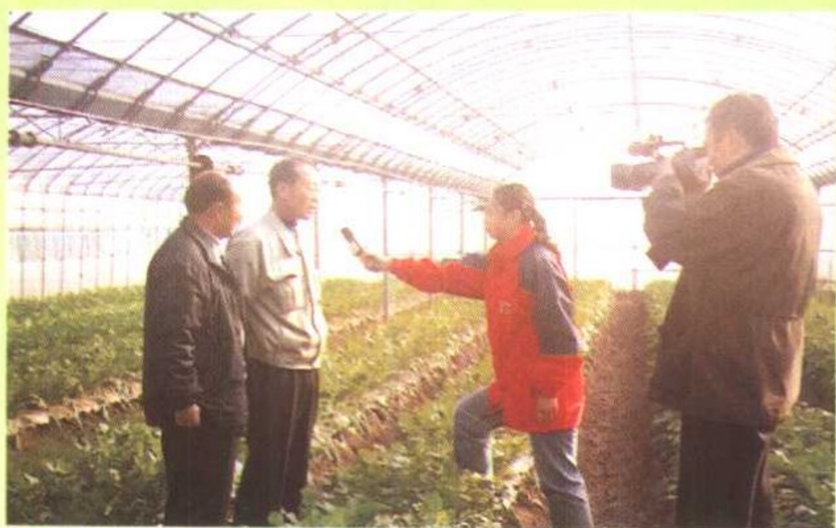
中央电视台记者采访上海有机蔬菜基地