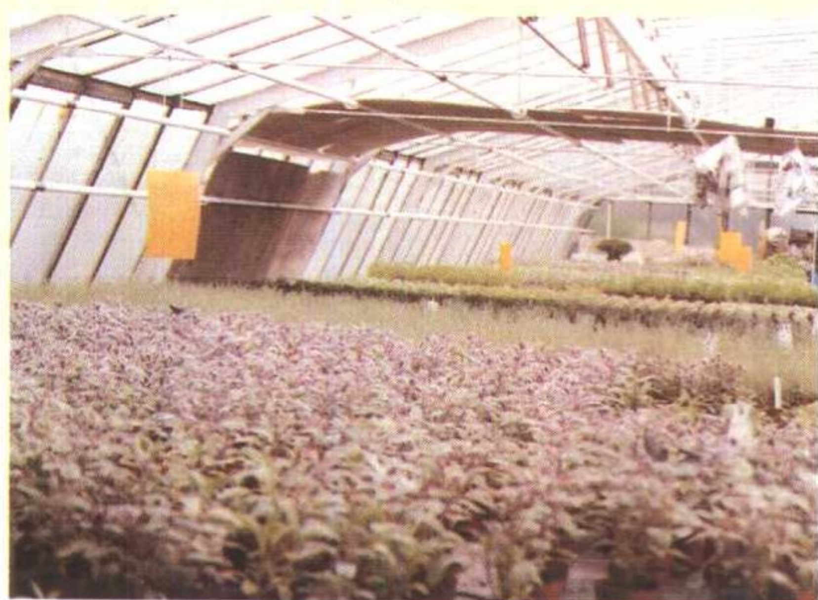
大棚生产中挂黄板防治害虫