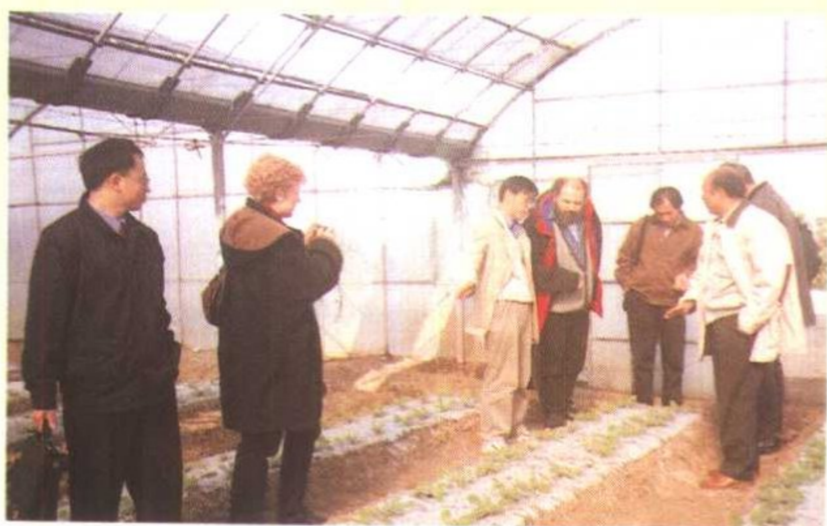
中外专家切磋有机农业技艺