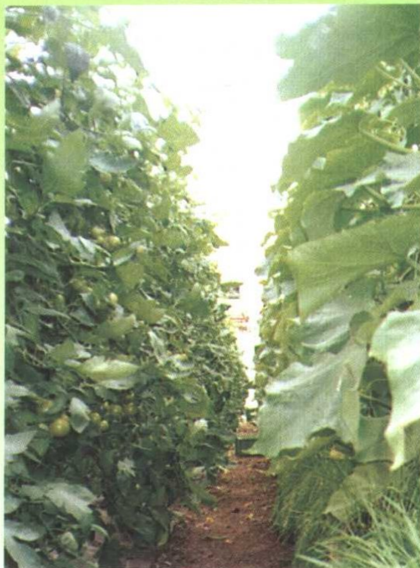
麦子与黄瓜间作减少害虫危害