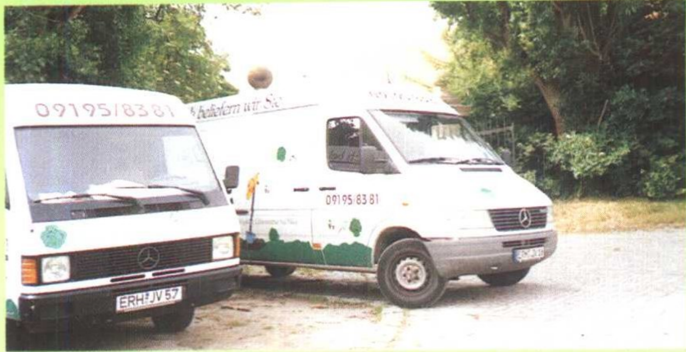
德国有机农场销售专用车整装待发