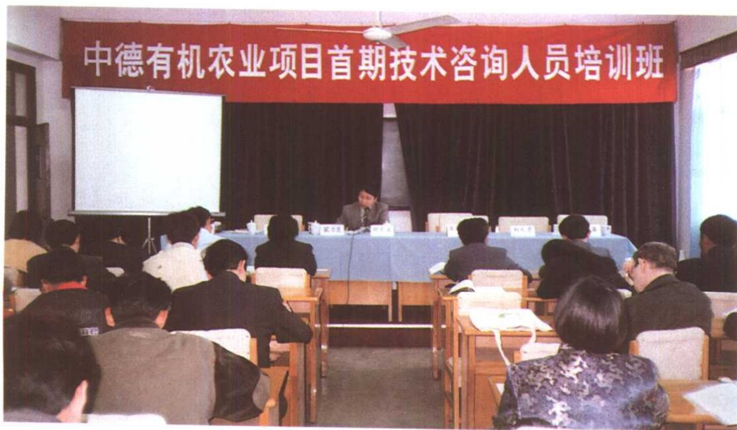
GTZ举办有机农业咨询员培训