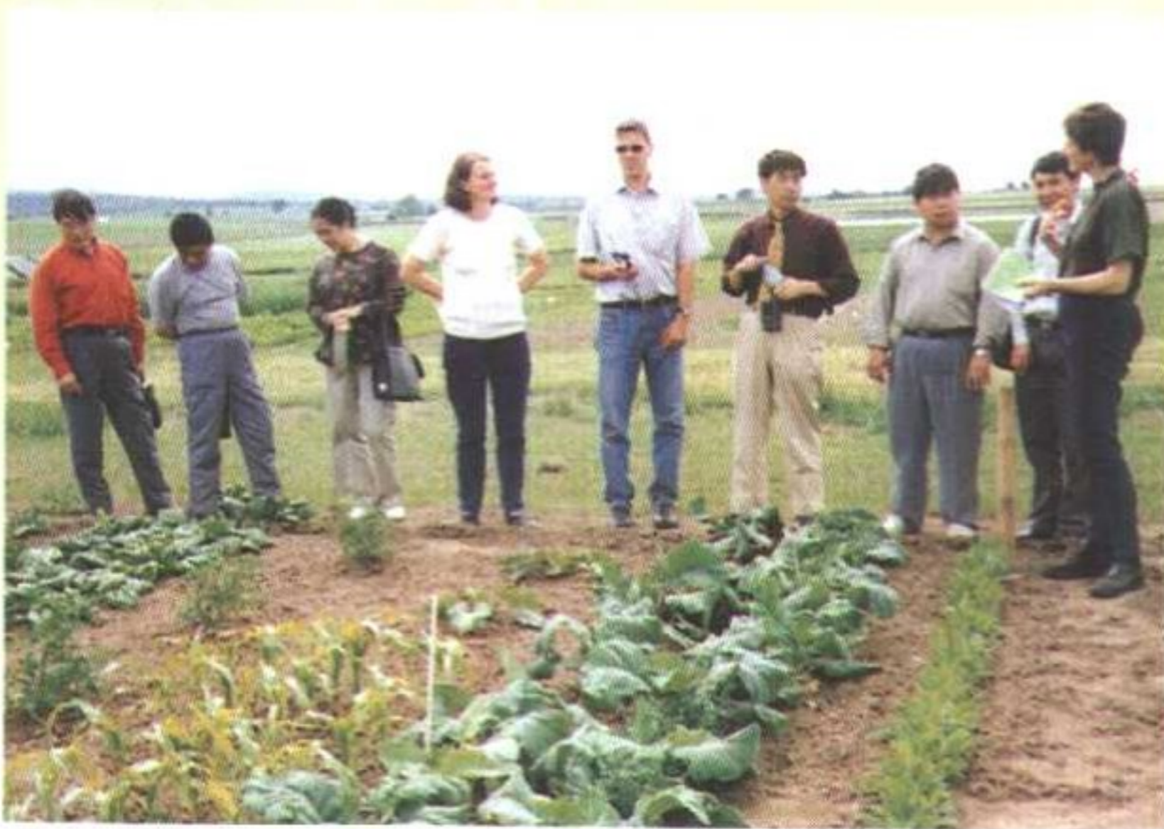
科研人员考察有机蔬菜生产基地试验