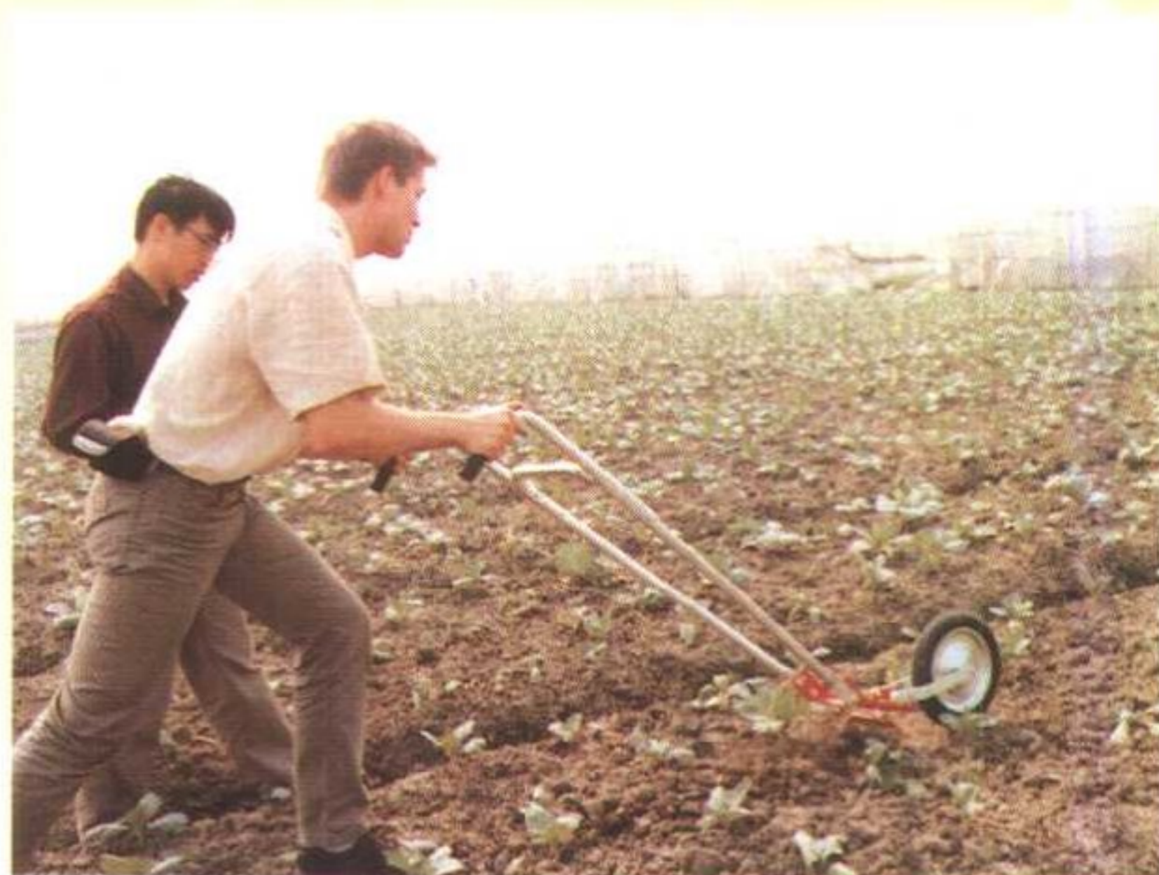
德国咨询专家示范操作除草机械