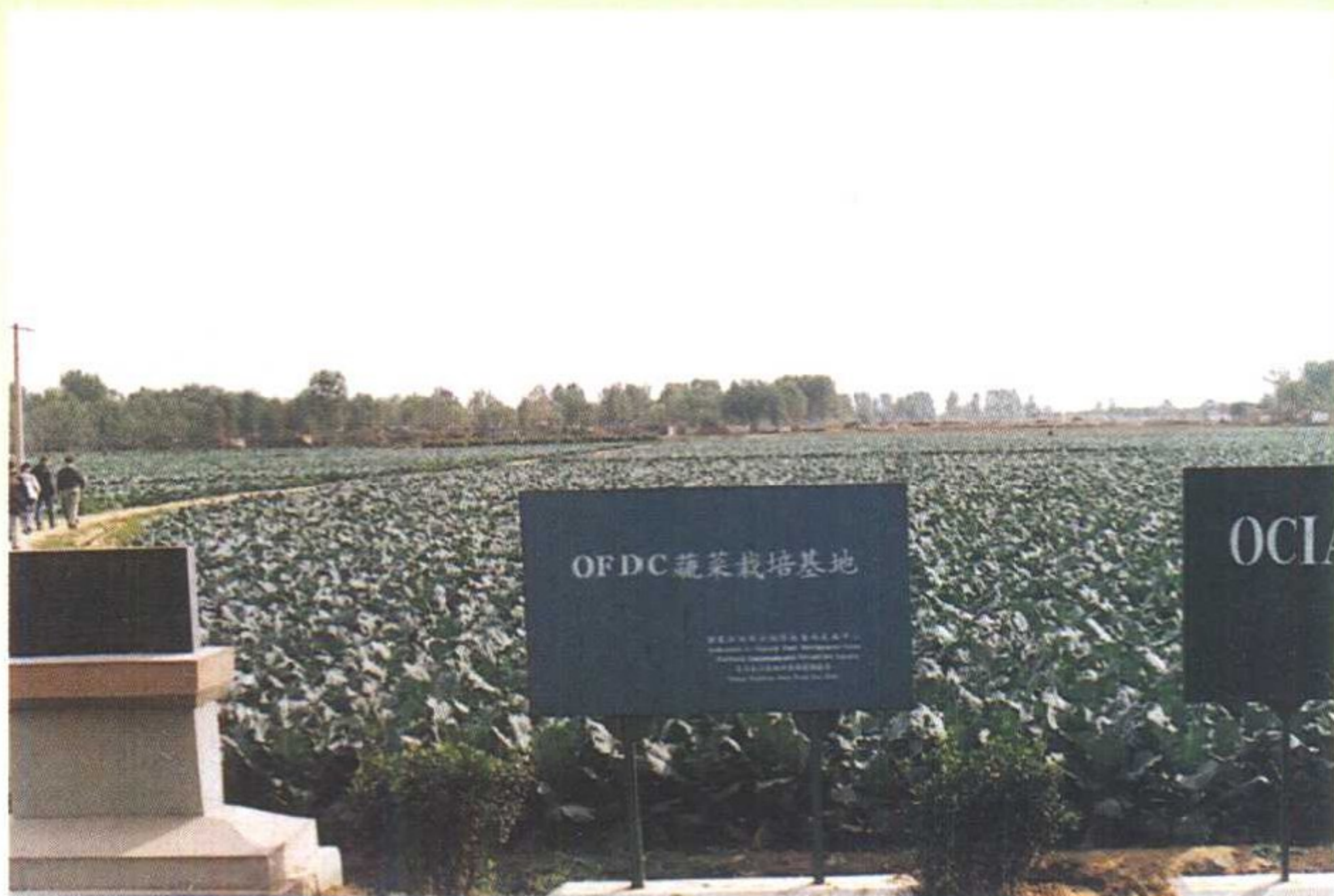
山东有机蔬菜生产基地