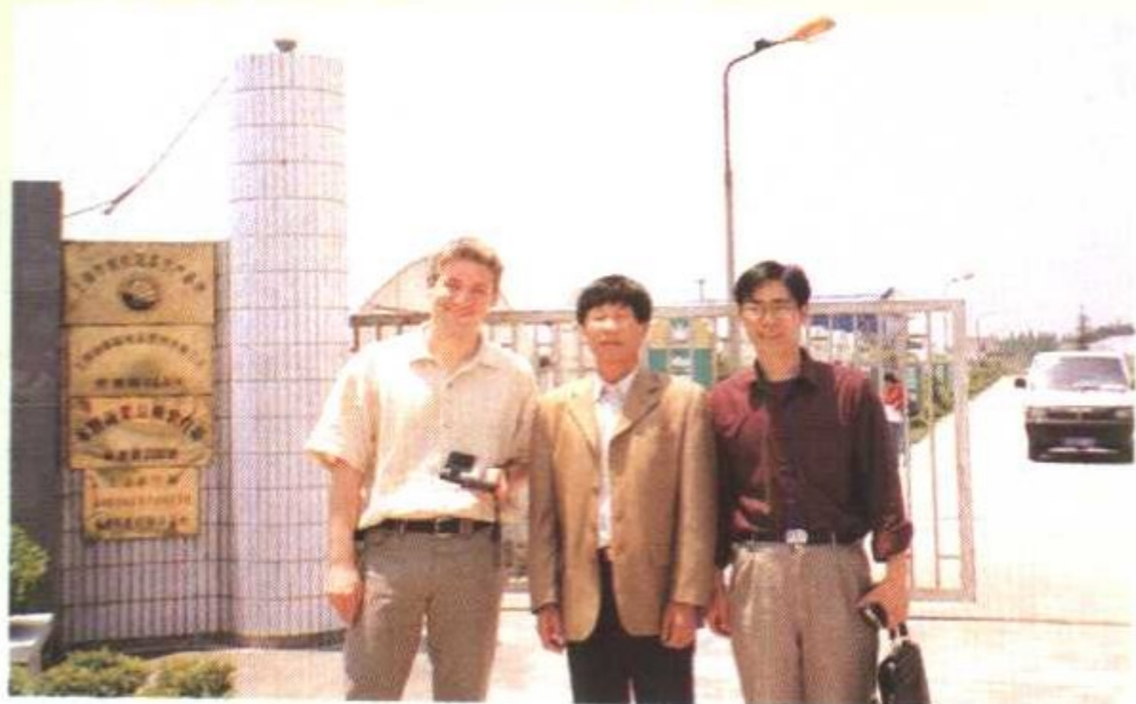
上海奉浦有机蔬菜园艺场