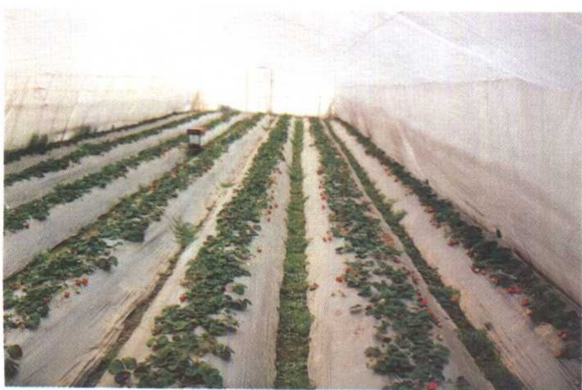
上海青浦赵屯有机草莓生产基地