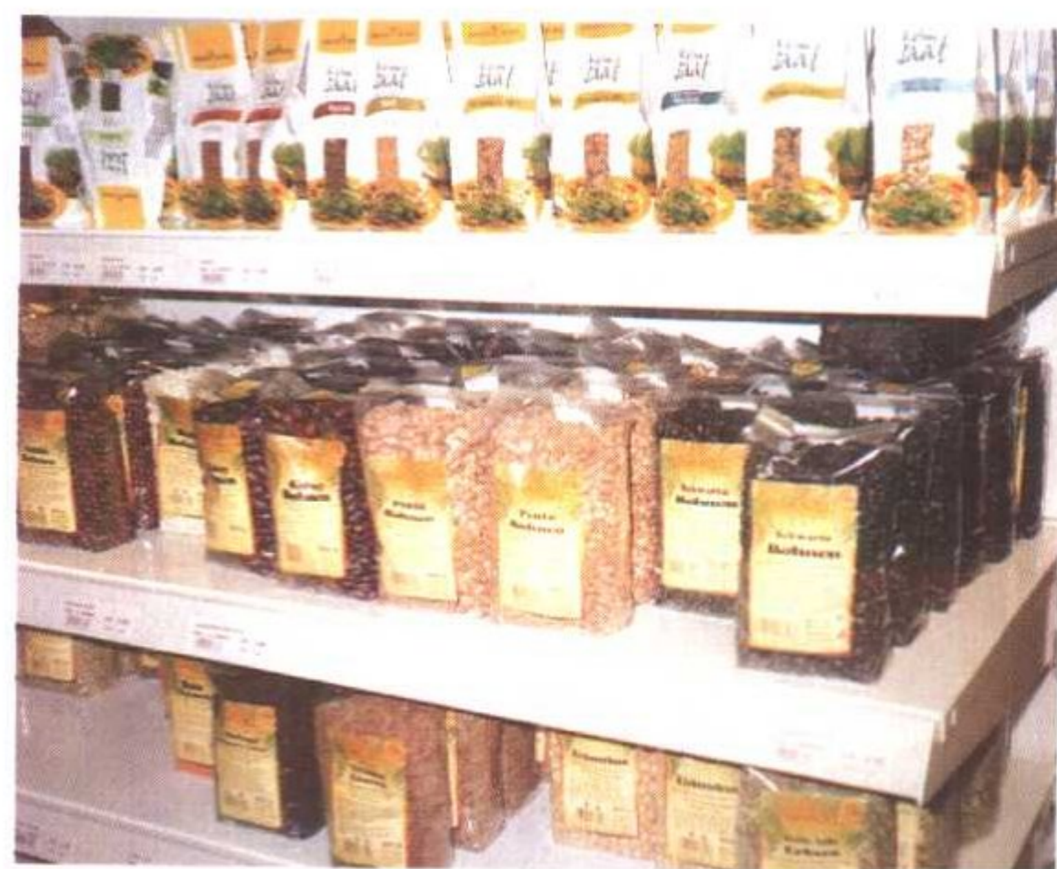
中国有机食品深受欧洲市民青睐