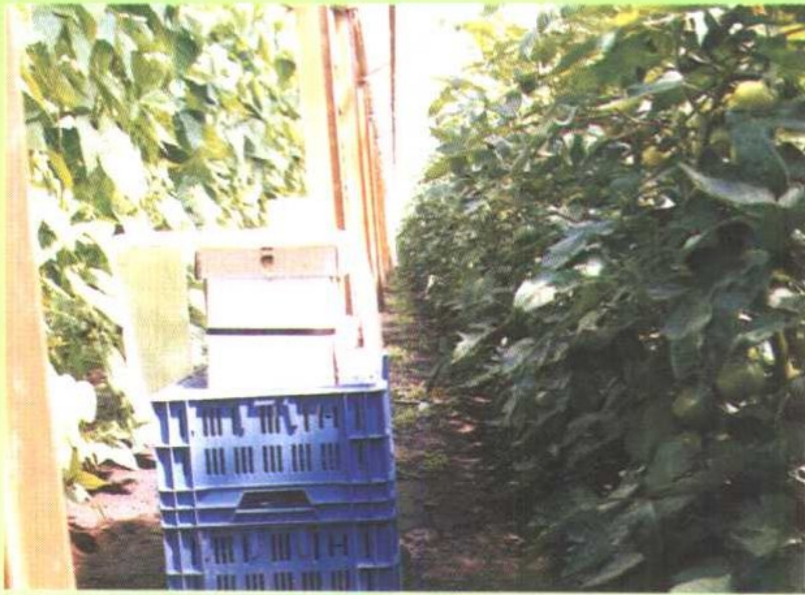
大棚番茄生产中释放熊蜂进行授粉