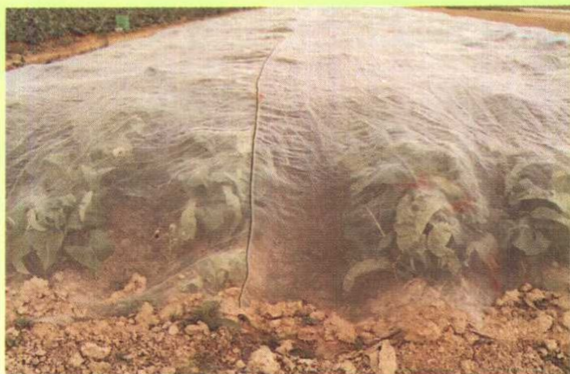
有机绿花菜覆盖防虫网控制害虫