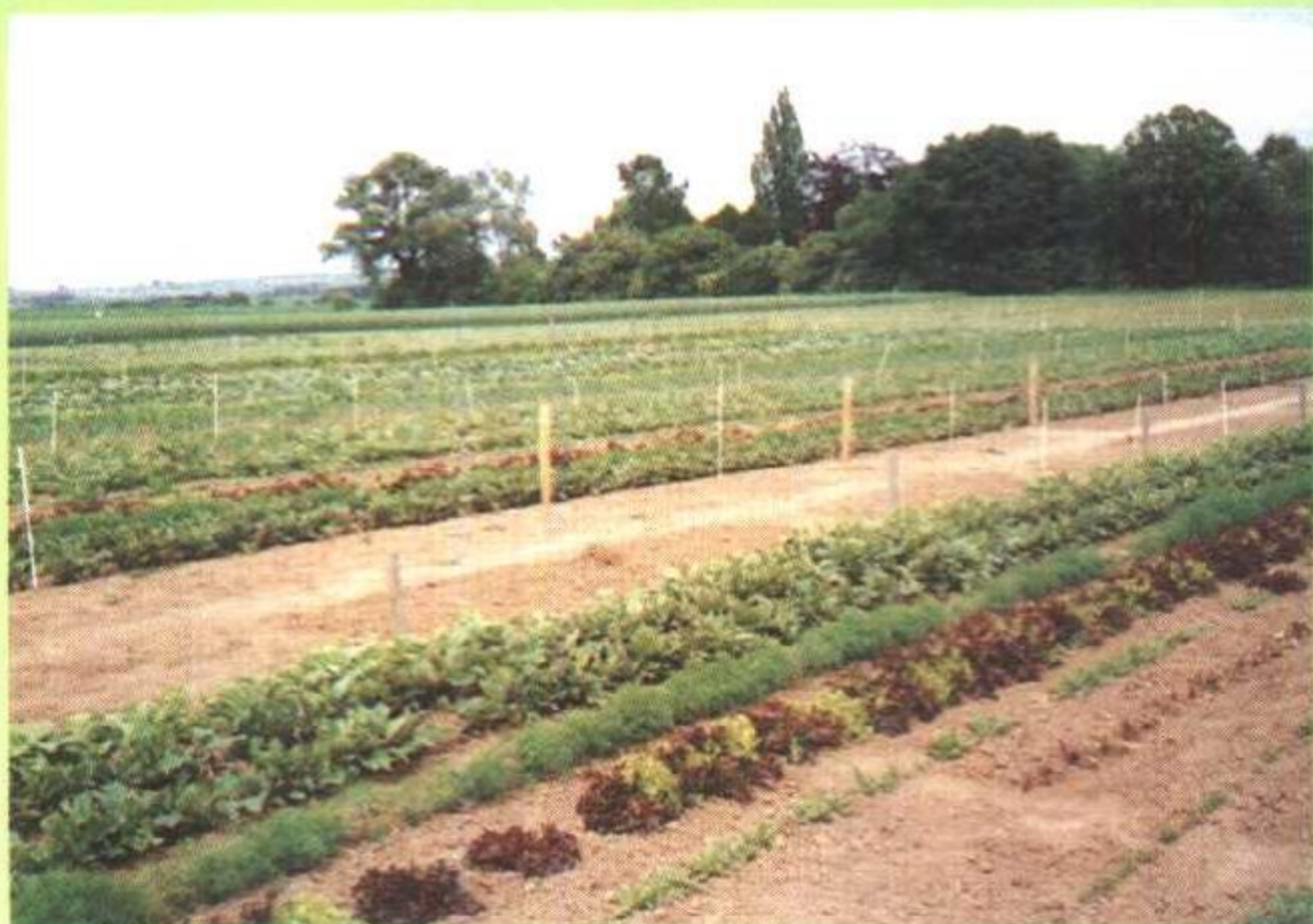
德国有机蔬菜生产基地