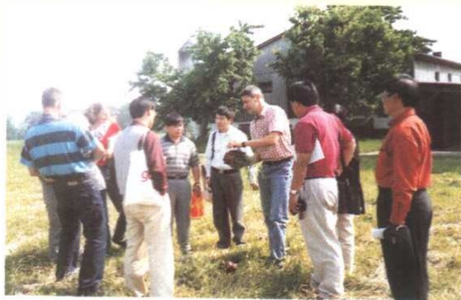
科研人员考察有机农田土壤性状