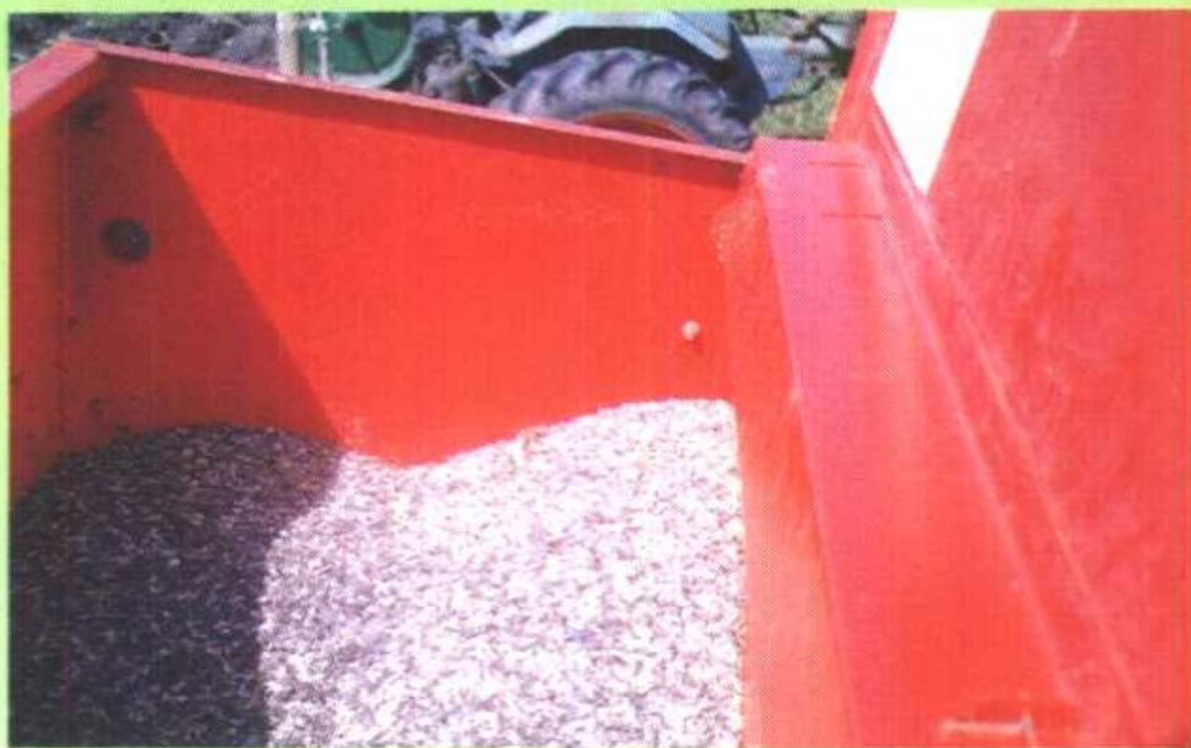
牛角粉在欧洲有机农业生产中被广泛应用