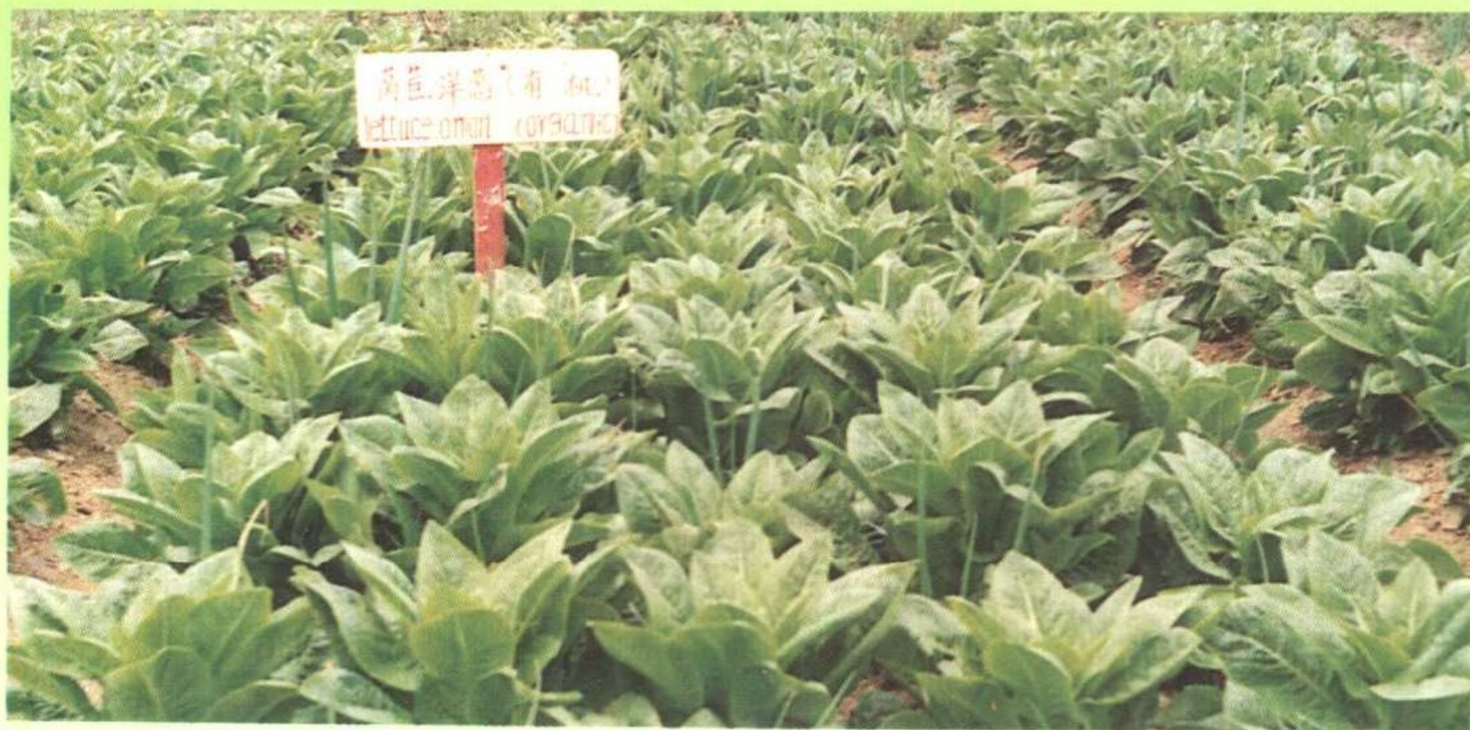
有机蔬菜生产实验