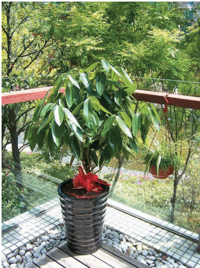
月桂喜阳也耐阴，可放在西阳台的拐角，利落而吉祥。

朝西的阳台，上午较阴，以散射光为主，中午以后光照强度较大，温度较高，特别适合冬季培养花卉。但夏天由于光照过强、温度过高，只适宜养耐半阴耐热的藤本花木，如络石、牵牛花、金银花、爬山虎、凌霄、扶芳藤、月桂等，使之形成一片“绿色屏障”，遮挡烈日直射，起到隔热降温的作用，使阳台形成清凉舒适的小环境。