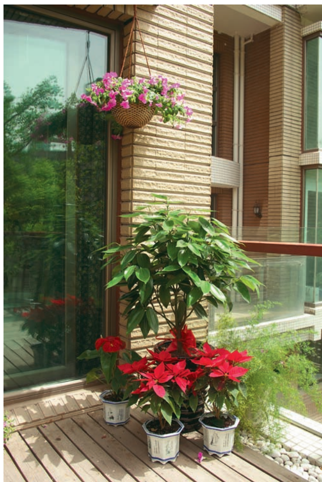
南阳台光照充足，平安树与一品红、矮牵牛搭配，预示着红红火火的日子。

朝南阳台，阳光充足，光照时间长，温度较高，宜选择喜光的花卉，如苏铁、彩叶草、矮向日葵、米兰、茉莉、白兰、月季、扶桑、菊花、太阳花、美女樱、石榴、金橘、葡萄、仙人掌、仙人球以及耐热、耐旱的多肉植物等。夏天可栽培不怕高温日晒的花卉，如三角花、蔷薇、炮仗花、睡莲、荷花、鸡冠花、万寿菊等，而春秋季节温度适宜时，可种植大部分花卉品种，形成烂漫的“花之海洋”。