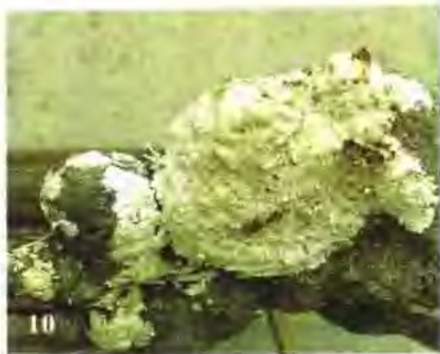
9 滑菇 (珍珠菇)