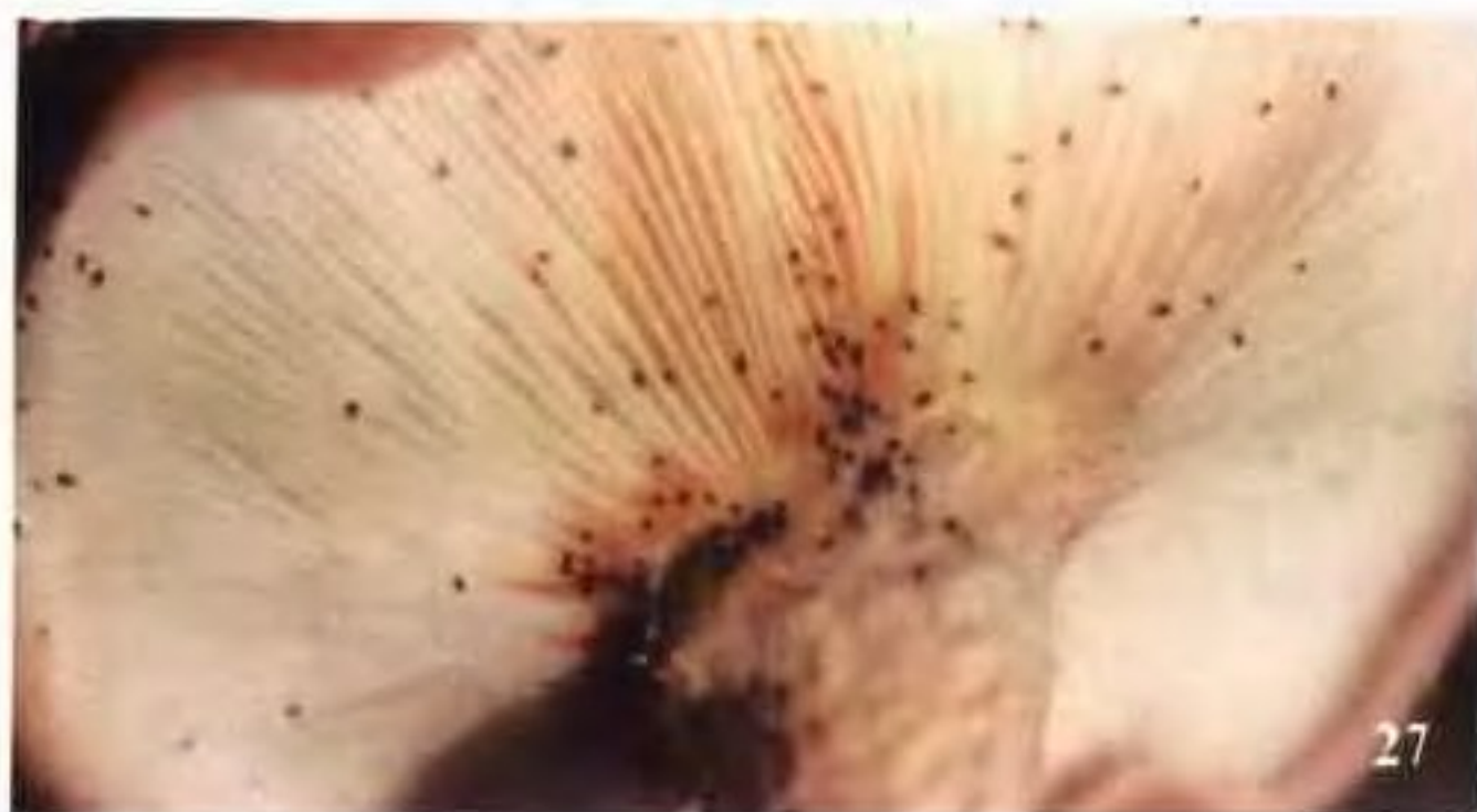
27 跳虫危害香菇菌褶