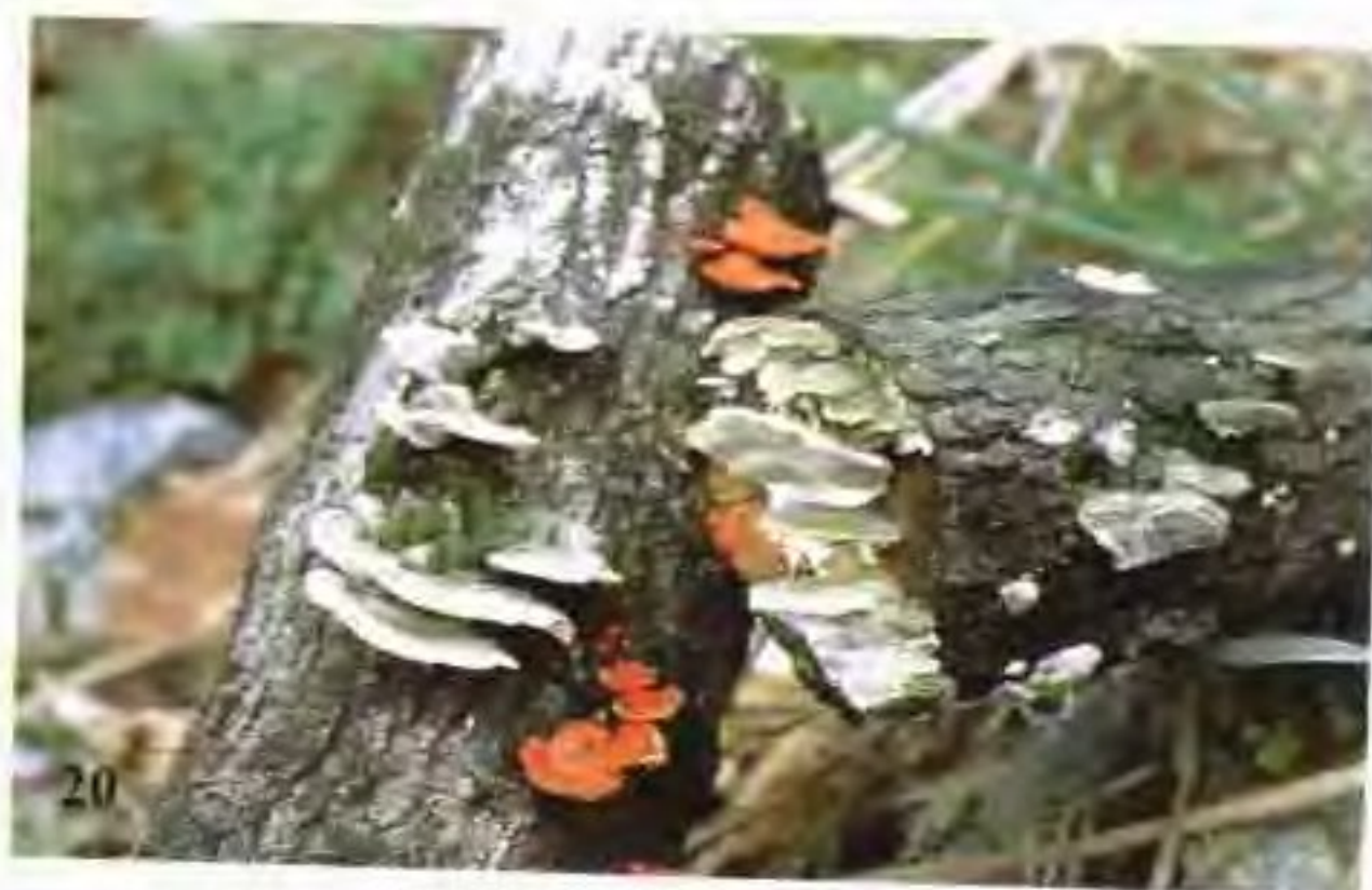
20 血红栓菌和桦革褶菌 侵染香菇段木