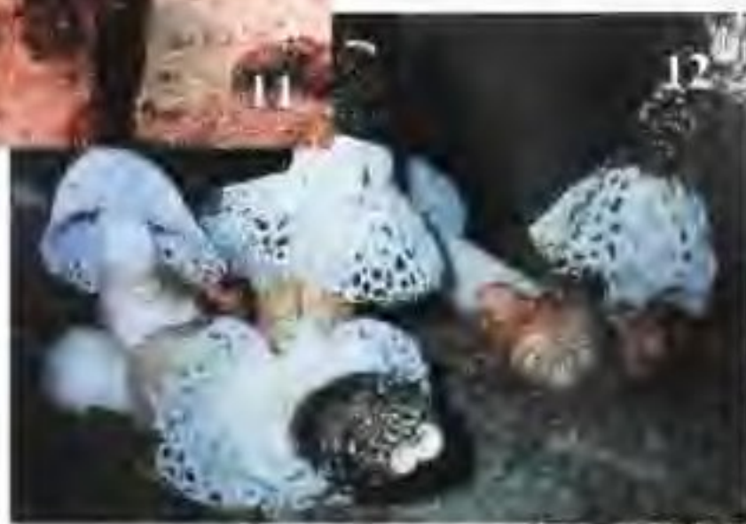
11 灵芝 (红芝)