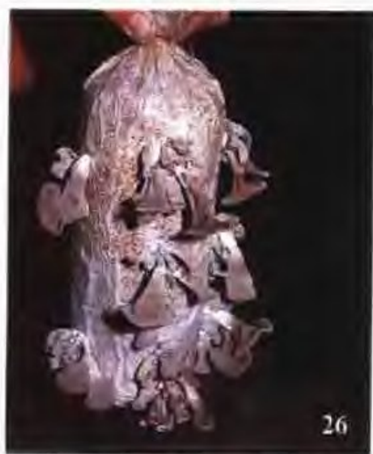
26 毛木耳生理病害(鸡爪耳)