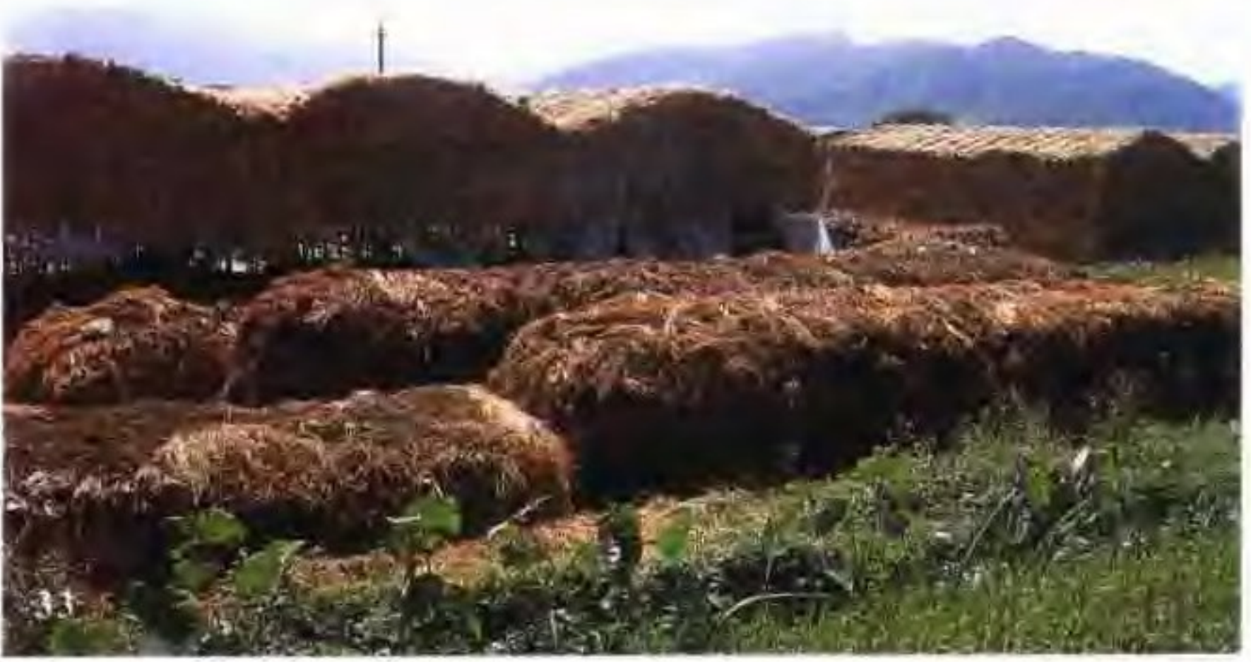
33 双孢蘑菇建堆与规范化菇棚