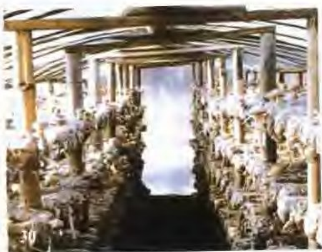
30 复棚层架式花菇栽培