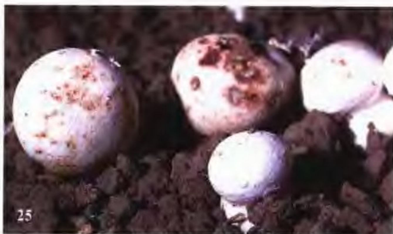
25 蘑菇细菌性 斑点病