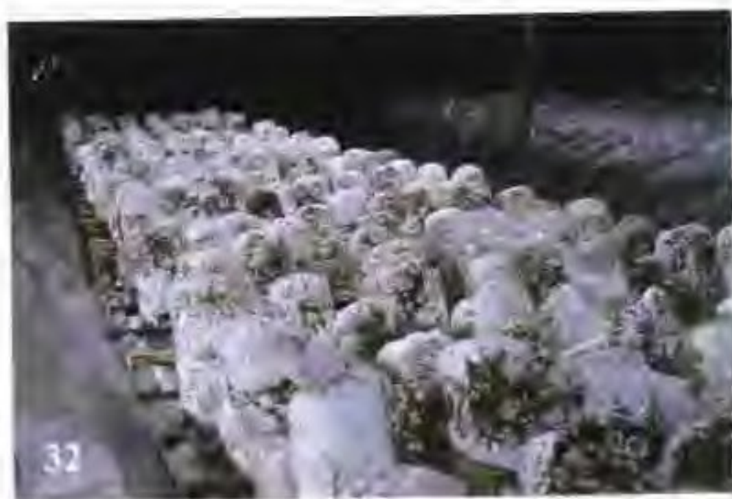
32 香菇菌筒栽培 (转色阶段)