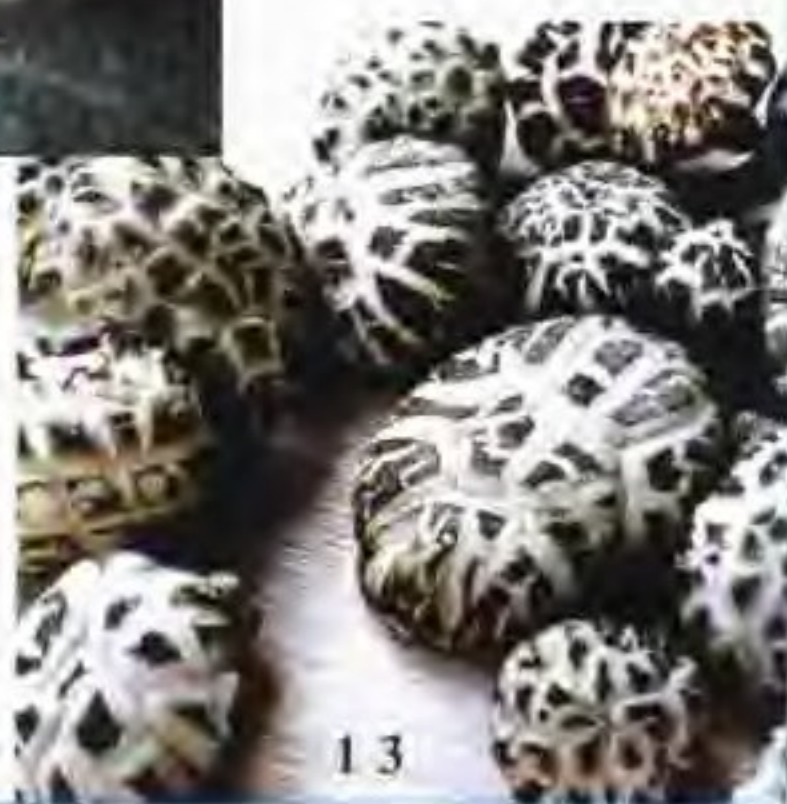
13 香菇花菇 (寿宁县科委供稿)