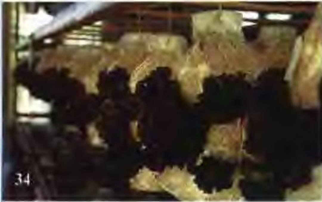
34 黑木耳代料吊式栽培