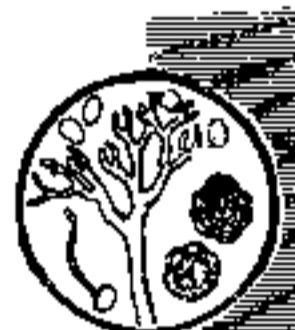
大白菜霜霉病菌的孢子