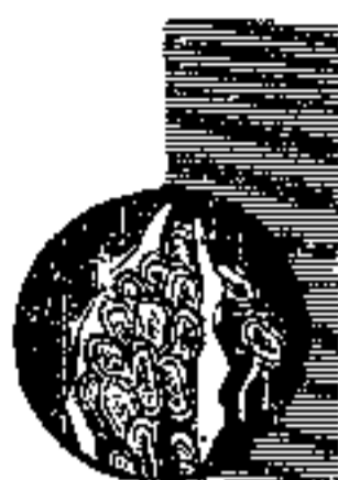
小麦秆锈病菌的孢子

假使你有怀疑的话,不妨做个小试验。从田里收集一些新鲜的小麦秆锈病菌孢子,把它抹在几棵健康的麦苗叶片上,麦苗的品种要和有病的小麦一样。然后,在上