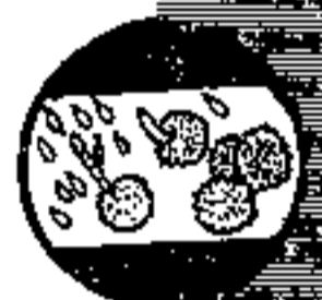
玉米黑粉病菌的孢子