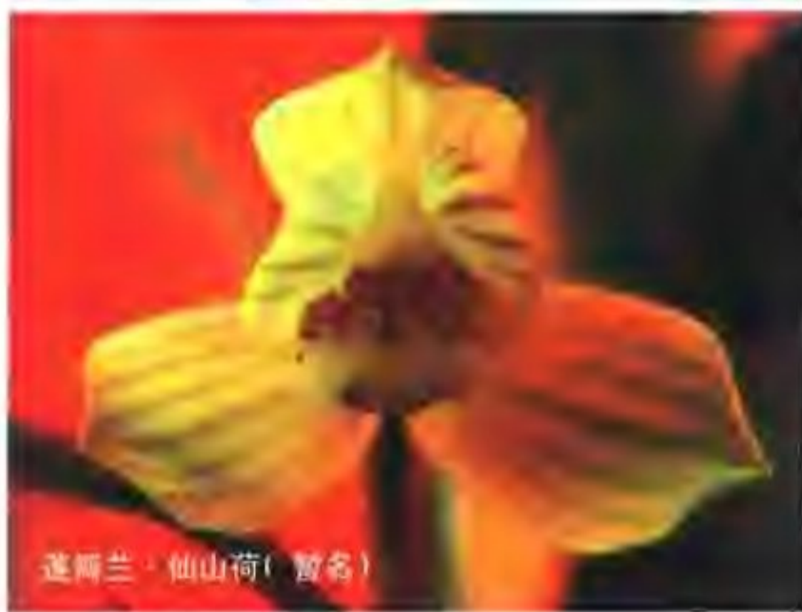
莲瓣兰·仙山荷(曾名)