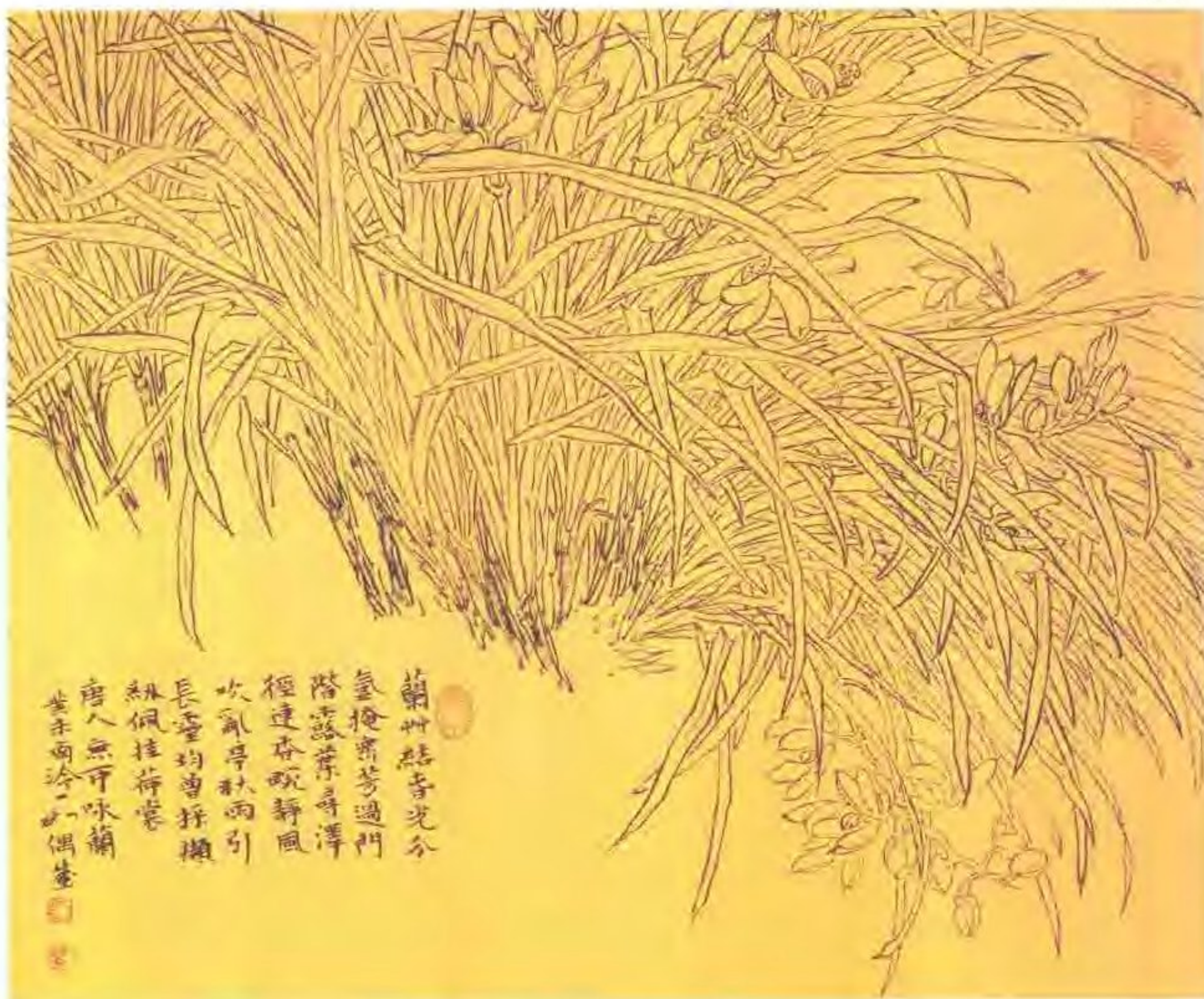
吴静初 - 唐人诗意图

蘭州結香光分 氣掩密芳過門 階露葉弄清潭 徑連春畝靜風 吹亂亭秋雨引 長壺均曾採擷 紅佩挂荷裳 唐人無可咏蘭 畫于南泠一如畫