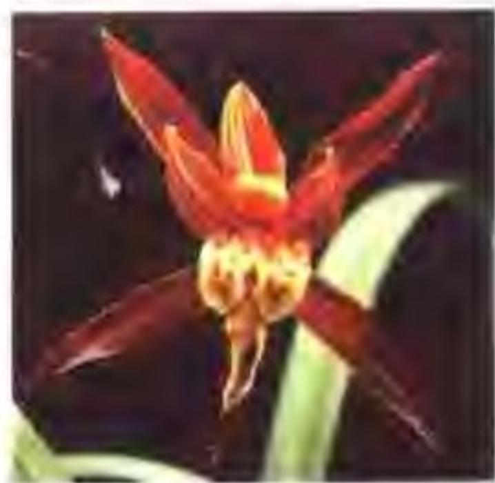
图 2-13-4 大红朱砂奇花