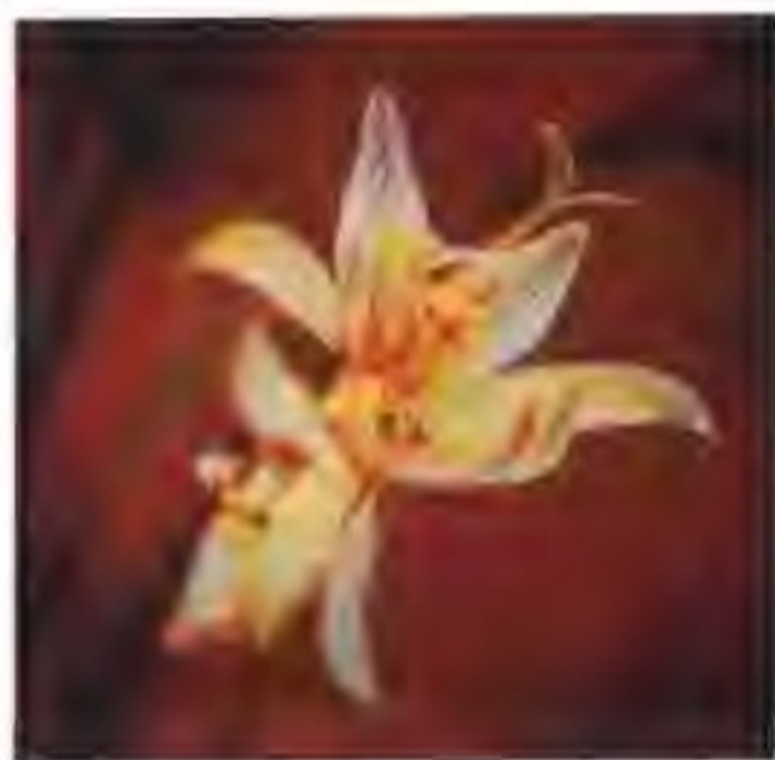
图 2-14-4 姑娘十八