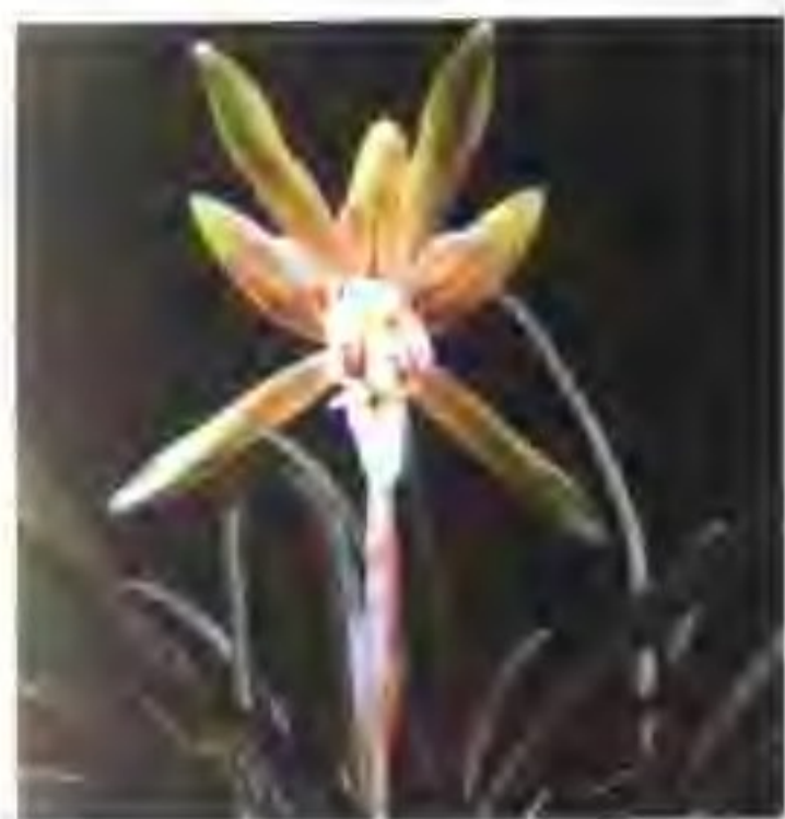
图 2-13-2 佛光普照