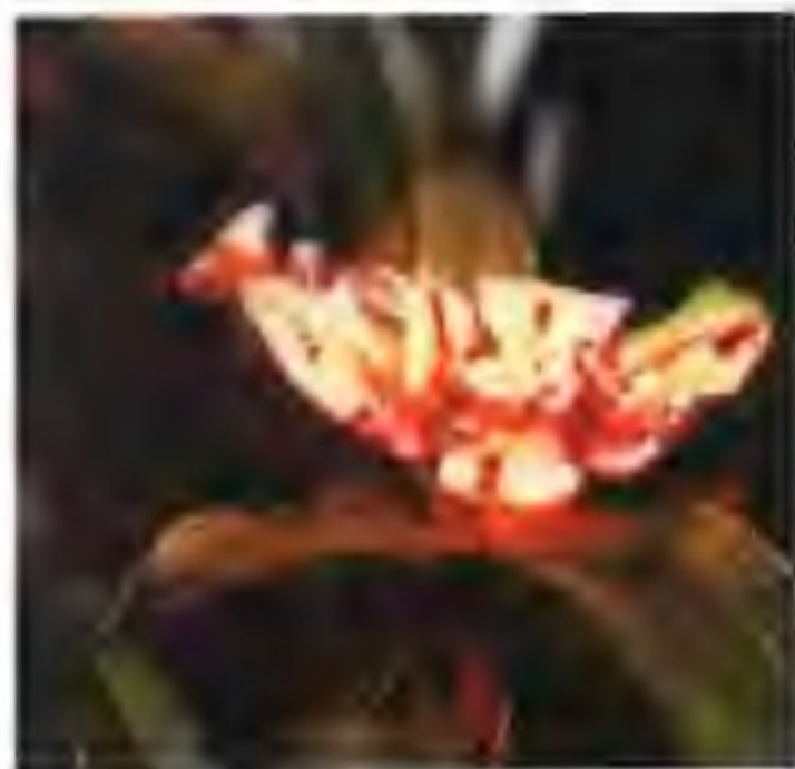
图 2-14-2 胜境奇蝶