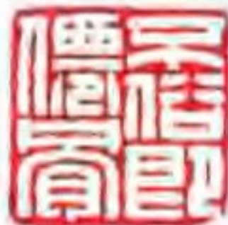
王福庵篆刻 不俗即仙骨

对寒兰的鉴赏评价是前无古人的事,希望有更多的专家和有志者参与,笔者仅在此抛砖引玉而已。