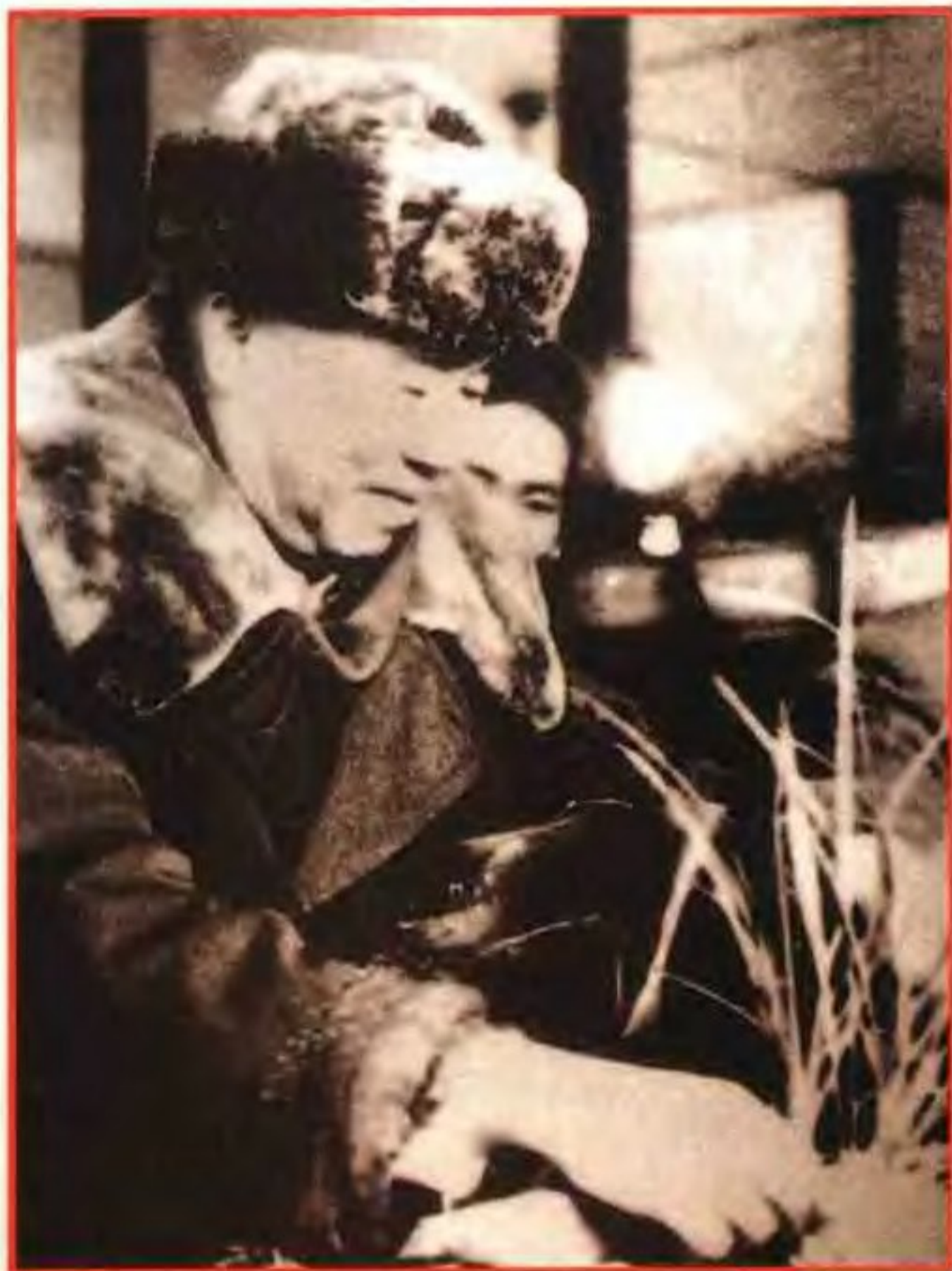
1962年，朱德元帅视察杭州花圃兰花室。