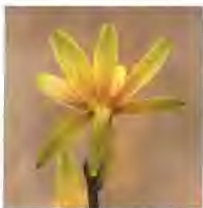
图2-15-2 大叶白奇花(背视)