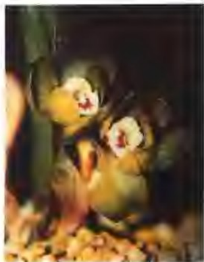
图 2-13-5 绿云

传统春兰名种“绿云”(图2-13-5),既是荷瓣,又是多瓣。2种以上的花被片的数目均可增多,历来著名于兰界,但它的瓣数多少似乎与生长状况有关,壮苗时可开到10瓣,弱苗时也有开正常花的。其机理至今尚不太清楚。