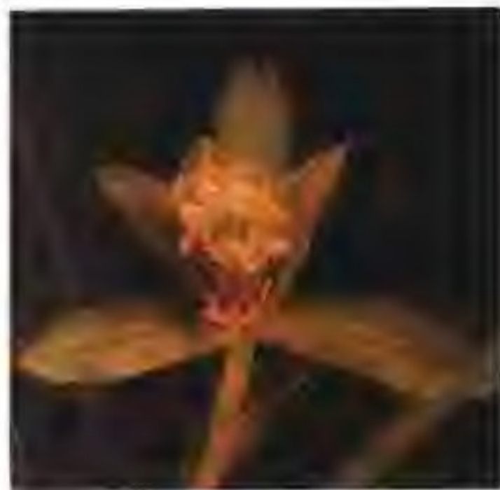
图 2-14-3 奇花