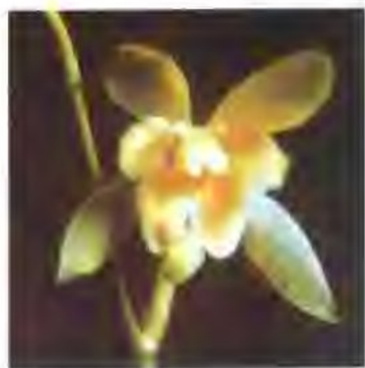
图 2-13-3 鱼鱿奇花