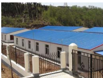
标准化全封闭兔舍