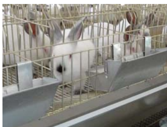
标准化阶梯式商品兔笼