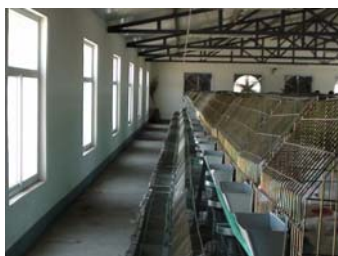
标准化半封闭兔舍及兔笼