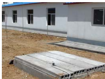
半封闭兔舍及污水处理池