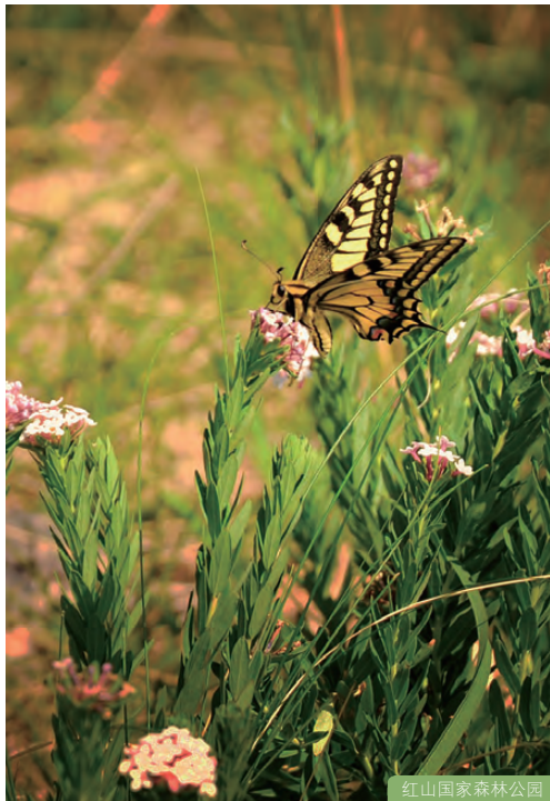
红山国家森林公园