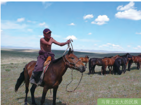
马背上长大的民族