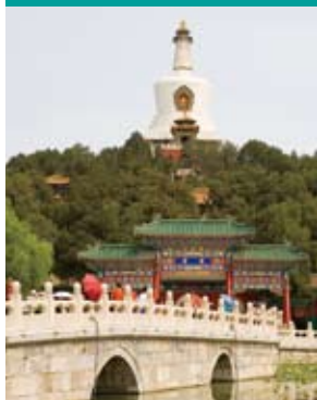
北海，中国古代皇家园林。▼

作为中国的首都，北京每一处繁华终究趋于平淡，令人铭记的，便成为历史。眼前的，将来的，皆是如此。然而，在追逐和探寻的过程中，内心依然雀跃，因为我们曾亲历其中，抚摸过那块砖，那片瓦，面对的时候，是永远的心潮澎湃。