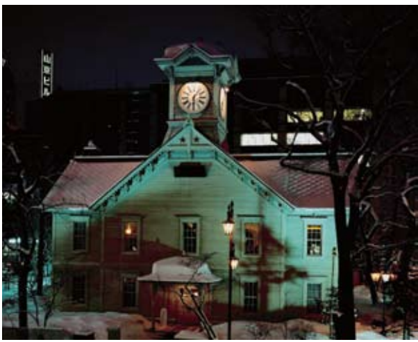
◆北海道札幌的钟楼夜景。

最好、最受欢迎的，是登别温泉，号称“日本第一汤”。泡温泉前，先到地狱谷兜一圈。传说中的地狱谷，各处是火山喷发的痕迹，热气缭绕，不断从地下喷出浓浓的硫黄味气体，冒出滚滚热水和水蒸气，似乎能想象出地狱中那些鬼怪被酷刑拷打的场景，让人不寒而栗。但就是这地狱谷酝酿了温泉。登别温泉每天有多达万吨的温泉涌出来，水质多样，有包括硫黄、明矾、食盐、放射线等11种泉质，泡不同的温泉会产生不同的功效，可解乏祛痛，也可养身美容等。