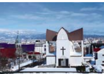
❖ 函馆的圣约翰教堂。

❖ 成片的薰衣草，烂漫、烂漫，与蓝天相嬉戏，如果说蓝天是镜子，那这一片紫色的，就是精灵，她懂你的心思。